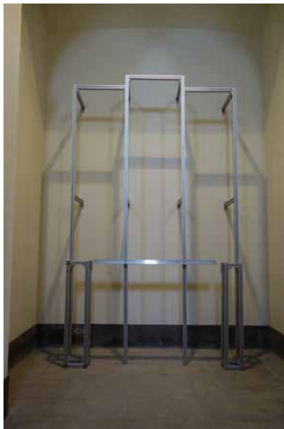
Estructura d'alumini que subjecta el retaule

Un cop finalitzat el procés de restauració s'ha muntat de nou el retaule a la capella. S'ha dissenyat una estructura de perfils metàl·lics d'alumini anoditzat que el subjecta pel darrere i que dona estabilitat al conjunt, tot avançant-lo uns 60 cm de la paret; es deixa aquest espai per tal de possibilitar l'accés al revers i assegurar un bon sistema de conservació preventiva de circulació d'aire i, també, per a futures actuacions preventives en el suport de fusta.