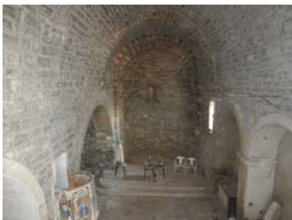
Interior església vella de Santa Maria

El retaule de sant Isidre es troba en una capella lateral de la nova església de la Molsosa. Es tracta d'un conjunt de format mitjà, propi per