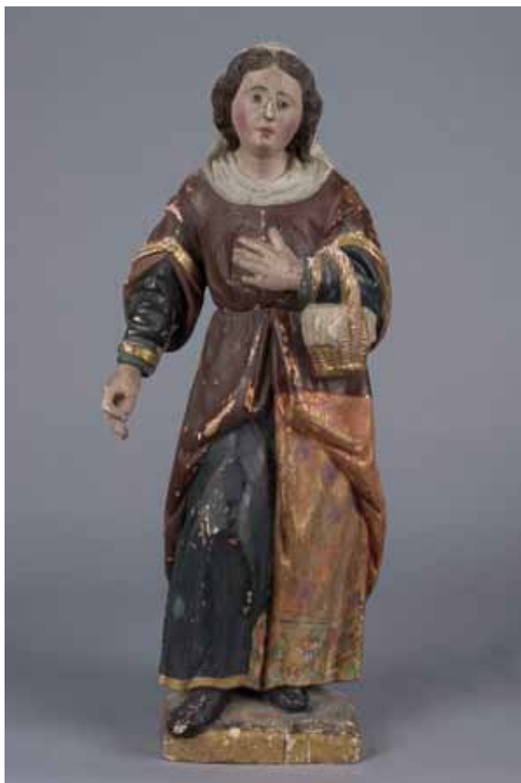
Mitja neteja de la santa.