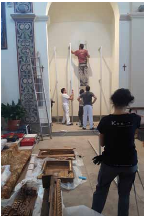
Muntatge de l'estructura d'alumini