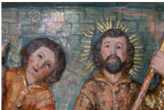
Marca dels quadrats de les làmines d'or