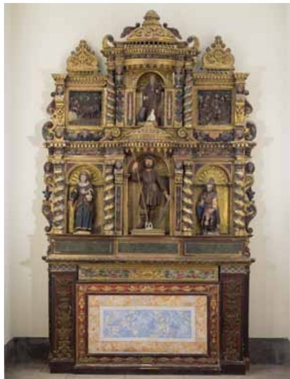
Retaule abans del procés de restauració.

Veus locals del poble ens van explicar que en el primer període de la Guerra Civil el retaule de sant Isidre va ser desmuntat per ser cremat dins l'església nova. Els intents de prendre-hi foc no van ser efectius i els executors van abandonar