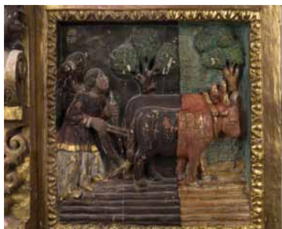
Procés de restauració: mitja neteja.