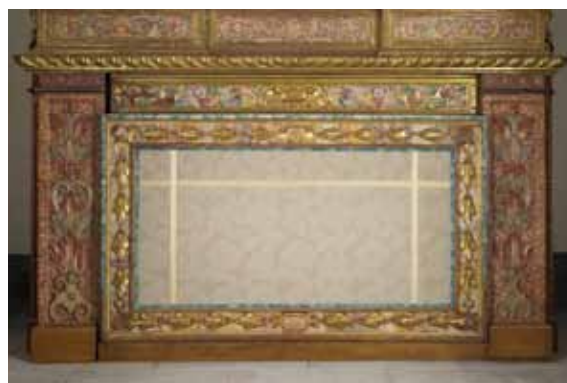
Basament i frontal d'altar.

Les tècniques pictòriques que veiem en el retaule són el daurat amb pa d'or fi a l'aigua, el llatat i estofat, el tremp, i les carnacions a l'oli al poliment. Els basaments estan policromats al tremp amb un jaspiat amb tonalitats vermelles i blanques. Aquesta policromia és molt diferent de la de la resta del retaule, fet que ens fa pensar que podrien ser elements afegits posteriors a l'execució de l'obra.