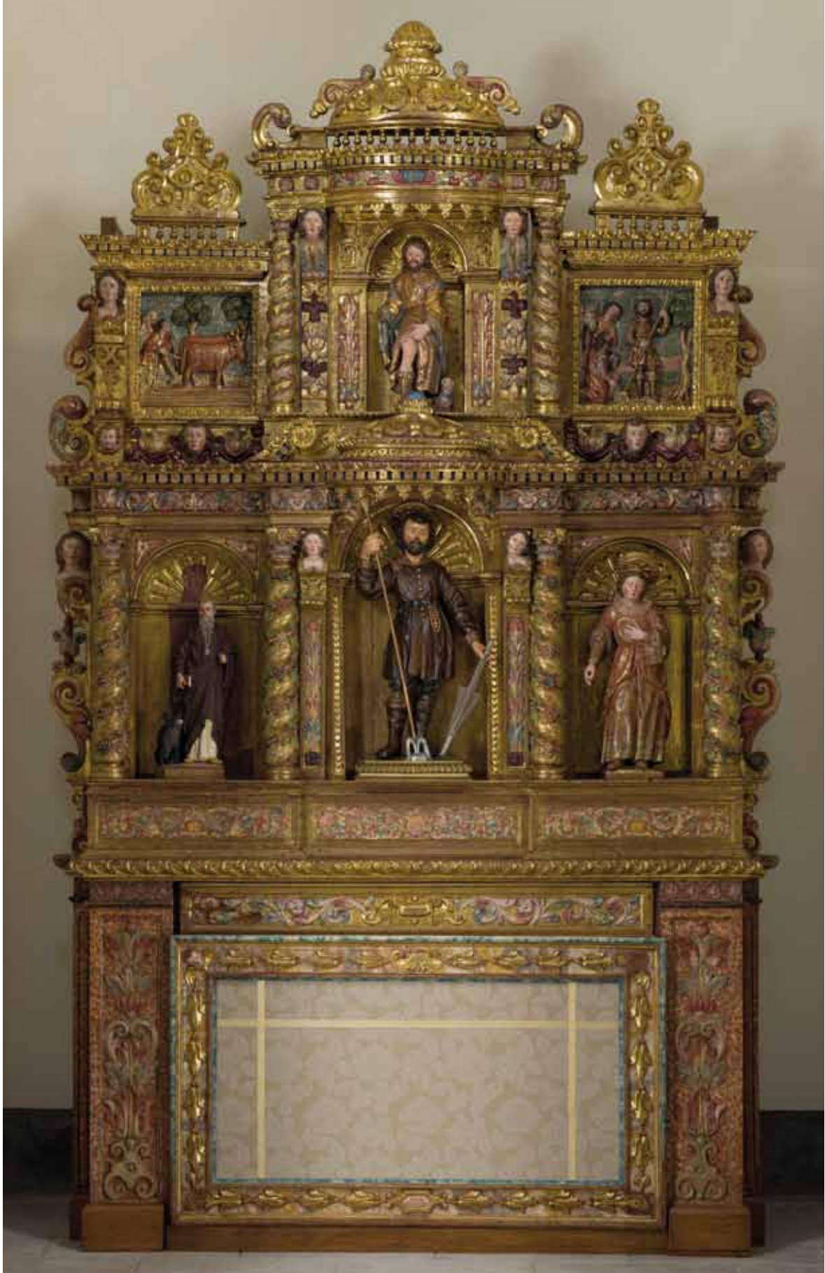
Retaule restaurat