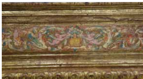
Fragment d'una escena recuperada de la predel·la

En el procés de restauració també s'ha desinsectat, consolidat i reforçat la part inferior del basament, que es trobava afectat per un atac de corc.