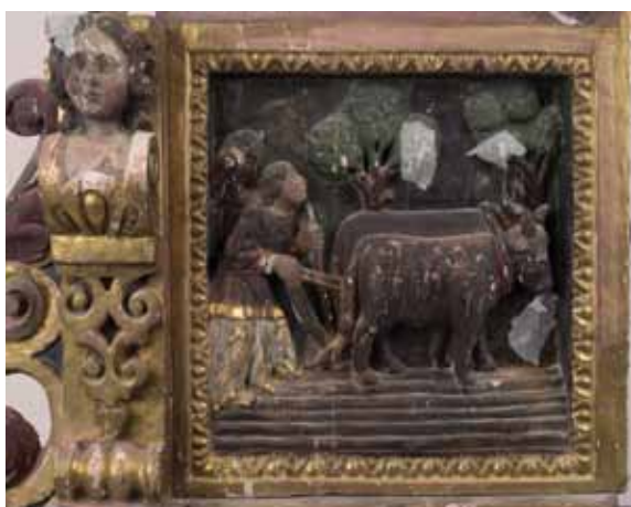
Escena abans de la restauració.

Ha estat una grata sorpresa la recuperació d'una escena de la predel·la que es trobava oculta per la repintada. Es tracta d'un conjunt d'imatges molt acolorit que representen l'abundància de menges, sobretot vegetals, distribuïdes al llarg de la predel·la en tres compartiments, i que van a parar en un recipient central com si fos una cornucòpia; en aquesta tirallonga de fruits hi ha imatges d'àngels menorets que sembla que vulguin jugar.