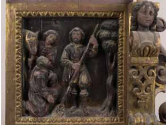
Escena ennegrida de la vida de sant Isidre.