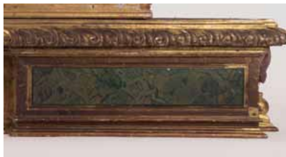
Fragment de la predel·la abans d'enretirar la repintada