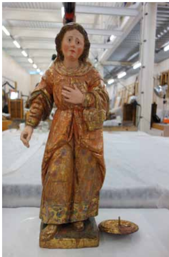
Santa Maria de la Cabeza restaurada