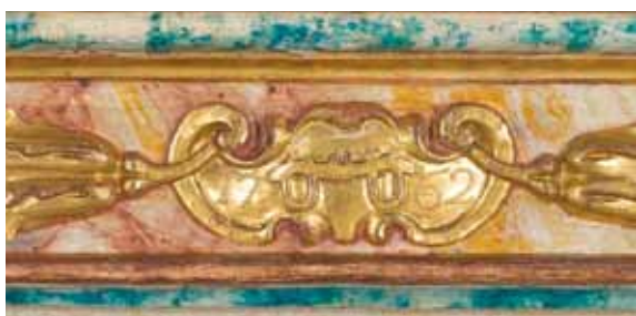
Data en el marc del frontal