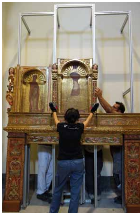
Muntatge del retaule

Un cop finalitzat el procés de restauració s'ha muntat de nou el retaule a la capella. S'ha dissenyat una estructura de perfils metàl·lics d'alumini anoditzat que el subjecta pel darrere i que dona estabilitat al conjunt, tot avançant-lo uns 60 cm de la paret; es deixa aquest espai per tal de possibilitar l'accés al revers i assegurar un bon sistema de conservació preventiva de circulació d'aire i, també, per a futures actuacions preventives en el suport de fusta.