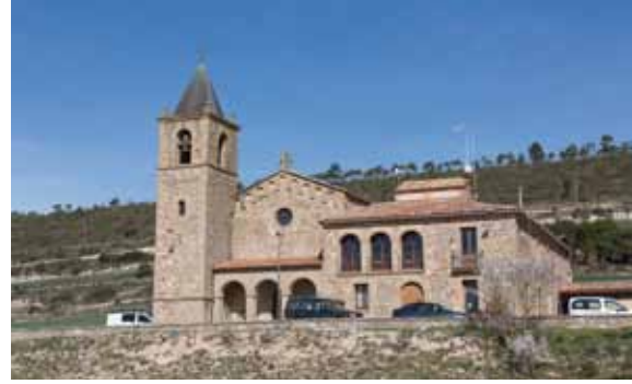
Parròquia nova de Santa Maria.

decorar una capella lateral. L'estructura està formada per un banc a la part inferior, amb l'alçada adequada per posar una taula d'altar al davant, per poder-hi celebrar missa. A més a més, hi ha dos pisos desenvolupats en alçada amb tres carrers d'amplada, el central amb dimensions lleugerament superiors als dels laterals. Al mig del retaule, sant Isidre el presideix: porta una rella de llaurar a la mà esquerra, mentre que amb la dreta clava una fanga al terra, d'on brolla aigua. A l'esquerra de l'espectador trobem sant Antoni abat i el porquet -típica imatge de sant d'Olot feta amb pasta de fusta-, segurament de