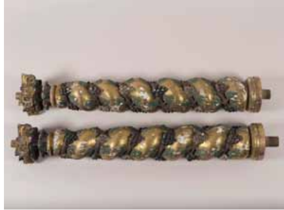
Aixecaments i pèrdues de daurat en les columnes.

La primera impressió que es va rebre del conjunt abans de la seva restauració és d'un enfosquiment general: una gruixuda capa negra de sutge cobria tota la superfície del retaule, tant pel davant com per la part del revers. L'alteració més greu que es va observar en un primer examen organolèptic realitzat in situ , són els nombrosos aixecaments del daurat i de la policromia amb les consegüents pèrdues que deixen el blanc de la capa de preparació a la vista –endemés de la detecció d'un atac tèrmit actiu que en debilitava l'estructura-.