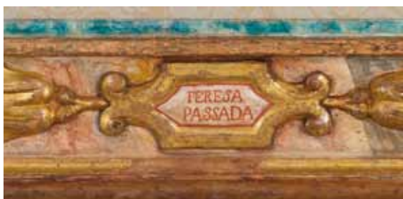
Nom pintat en el marc del frontal

te que la Passada és el nom d'una masia de la Molsosa, podria tractar-se de la persona que va pagar el frontal d'altar.