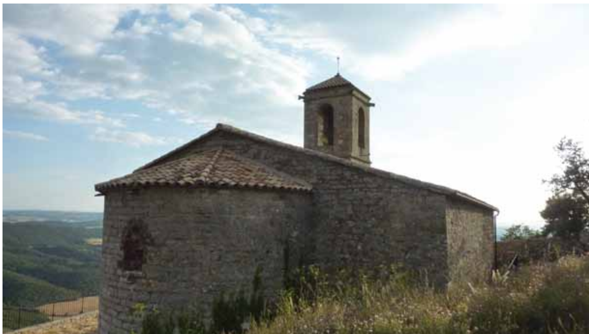
Antiga església de Santa Maria