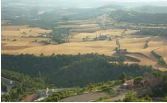
Vista de la plana amb la nova església de Santa Maria