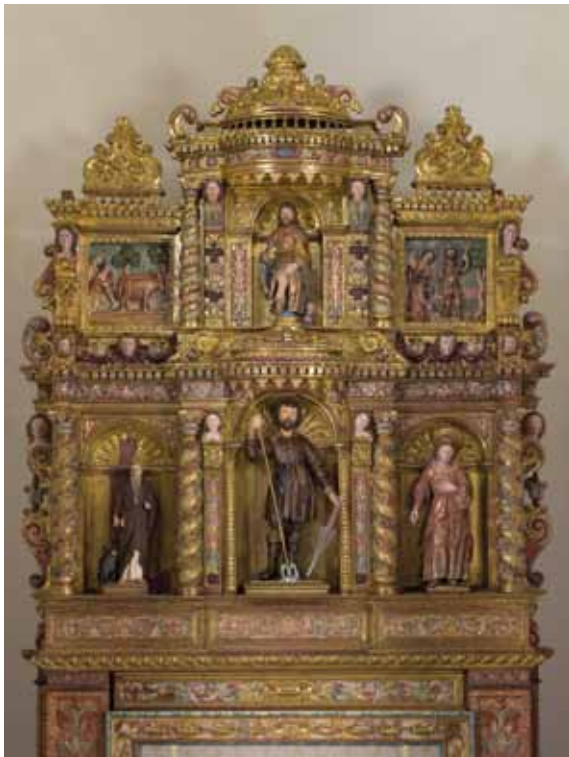
Part superior del retaule.