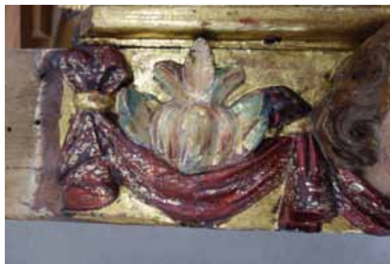
Laca carmí sobre un full platejat