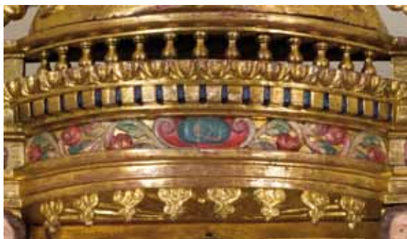
Element superior on hi ha pintada la data de "1680"

l'església plena de fum, i van deixar tots els elements del retaule apilats i ben enfosquits.