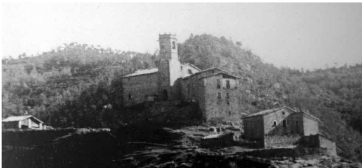
Els Torrents (dècada del 1930 o principis dels anys 40 del segle XX) (Família Sala-Sabata)

Les cases que hi havia en el terme dels Torrents 4 i que van declarar els seus propietaris en la capbreuació que es va fer l'any 1730 5 eren: