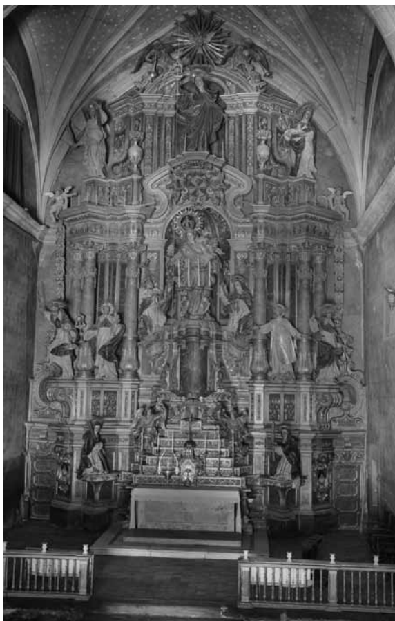
Retaule de l'altar major del monestir de Santa Clara de Vic

figurat i presència de la fornícula central que predomina damunt de tot el retaule; es produeix així una gran unitat compositiva, amb la total integració d'escultura i arquitectura». 32