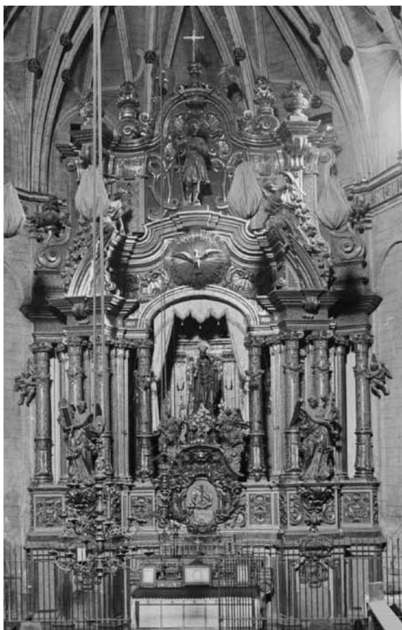
Retaula de l'altar major de l'església de Tremp (Fundació Institut Amatller d'Art Hispànic. Arxiu Mas)