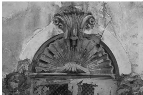
Detall de la petxina de la volta del presbiteri i de la pica baptismal (2014)

- «Dia 15 janer 1752 tinch pagat a Jaume Jordana, fuster, set lliuras catorse sous, que són: 6 ll 15 s per 13 jornals y mitg que se ha ocupat en fer la cúpula de las fonts, las gradas per 2 altars 15 , los bastimens per tancar dos picas per posar oli, 2 portas, una al cor altra al cap de la escala, y la finestra del cap de la escala, 11 s per claus, y 9 s per 6 frontissas, 2 per las fonts y 4 per las picas, és ... 7 ll 14 s».