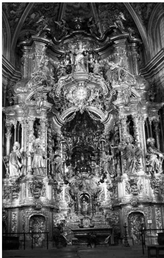
Retaula de l'altar major del santuari del Miracle (Riner, Solsonès)

Mentre estava treballant en el retaule de Tremp, Carles Morató, el 14 de març de 1746, contracta, amb el fuster Francesc Nadal, les obres del cimbori gran de la capella de la mare de Déu del Claustre de la catedral de Solsona, «conforme la trassa que dit Carlos Moretó ha fabricat per est fi y efecte, qual resta en poder de dit Carlos Moretó, y aquella deurà entregar a dits señors administradors després de finida la obra», que ha de realitzar-se en el termini de 3 anys. El cost total de l'obra ascendeix a les 1.400 lliures que s'han de pagar a Carles Morató «per lo treball de escultor», més les 350 lliures que es donen a Francesc Nadal «per lo treball de arquitecto». 38