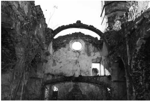
Arc del cor i espai que ocupava la vidriera (2014)

- «per mans de fer dit reixat ... 1 ll 2 s 6 d». 14