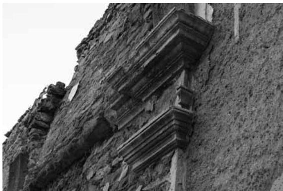
Detall de la cornisa de la nau principal i d'una capella lateral (2014)

2. «Item, que dit Guillem Però dega fer la cornisa que circueix la iglésia nova y capellas y sacristia y mutllura dels portals y cornisas del simbori ab lo perfil que li entragaran los dits reverent rector y regidors».