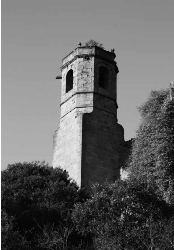
Campanar de l'església dels Torrents (2010)

y agua», «jornal de pujar terra per anivellar lo cor de dita iglésia», «jornals de traure terra de la iglésia antes de enrajolarla, y per (...) cabassos [de] salsó».