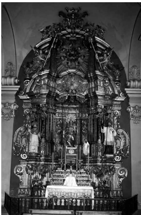
Retaule de l'altar de la capella de la Mercè de la catedral de Solsona

Al mateix temps que s'estava construint el retaule del santuari del Miracle, a la catedral solsonina es va aixecar la capella de nostra senyora de la Mercè, per iniciativa de l'aleshores bisbe de Solsona, el mercader Josep de Mezquíia. 41 Acabada la capella, es va ornar amb la construcció del corresponent retaule, atribuït per la majoria d'estudiosos a Carles Morató, basant-se en les similituds estilístiques amb el retaule del santuari del Miracle.