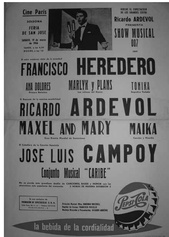
ACS. Fons Ajuntament de Solsona. Col·lecció de cartells, 1966.

Los actos organizados le dan un colorido singular a esta feria llena de tipismo.”