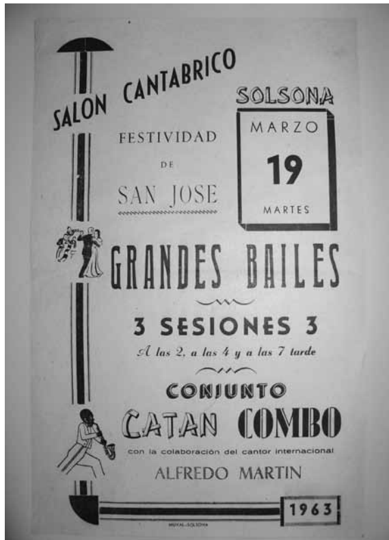
ACS. Fons Ajuntament de Solsona. Col·lecció de cartells, 1963.