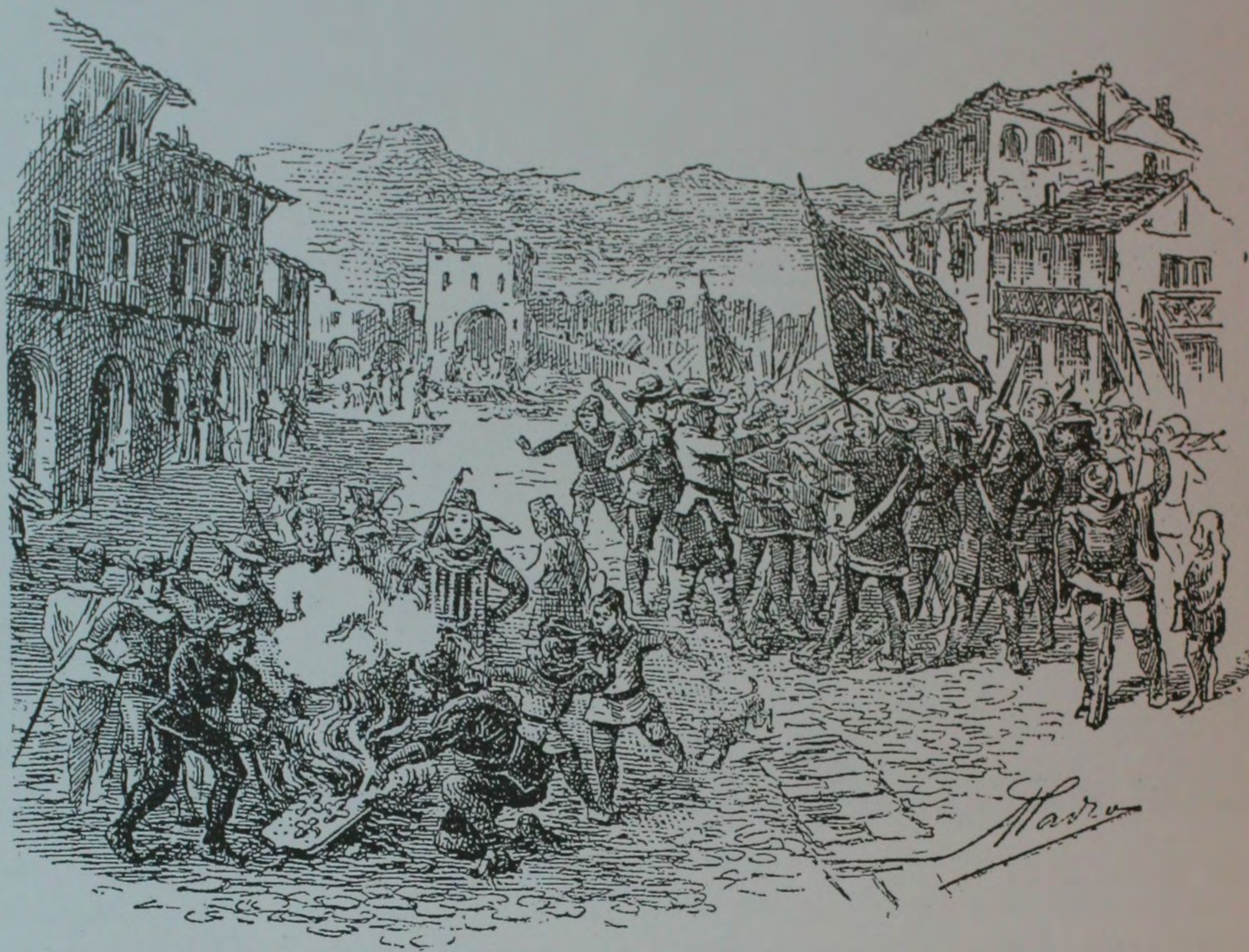
Alçament de Vic contra Felip V de l'any 1705, segons dibuix d'A. Padrós

guerra a favor de Felip V. Els aliats, considerant que Àustria tindria massa àmbit de poder, buscaren una pau negociada a Utrecht (1711-1713) i abandonaren el nostrepais. Però Catalunya continuà la lluita en defensa de les seves llibertats i institucions. Caigudes la majoria de les places catalanes, Solsona es rendia el 15 de juliol de 1713 al duc de Pòpuli, generalíssim de Felip V. Sols quedaven les places fortes de Cardona i Barcelona. Després del dramàtic setge de l'11 de setembre fou vençuda Barcelona; Cardona capitularia pocs dies després.