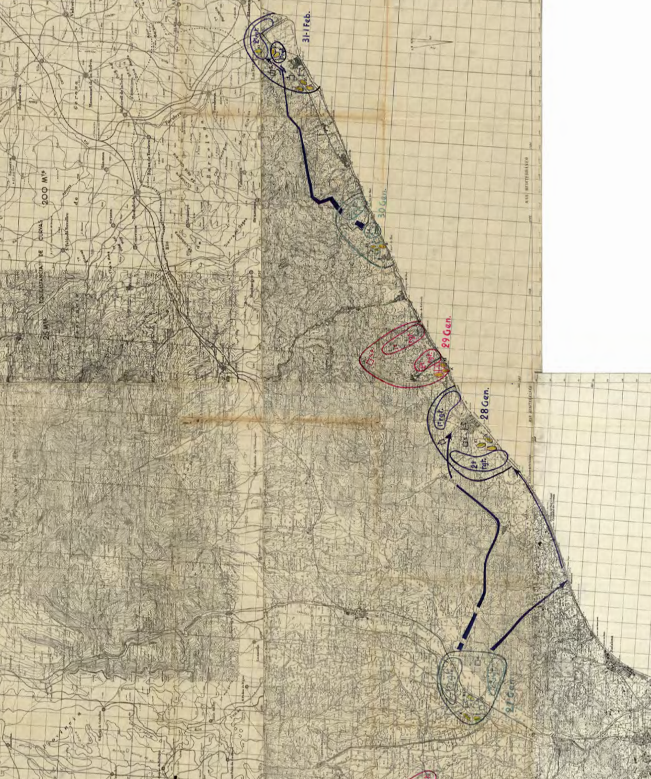
Figura 8. Mapa RM.248686. Informe sobre la Batalla de Catalunya. Estat Major. Comandament de la Divisió Fletxes Blaves. Carta 2/8. Mapa collage dels fulls Centelles 364 (Osona) i Calella 394 (Maresme.) Dates 23-des./1 de feb. del Mapa Topogràfic Nacional d'Espanya escala 1:50 000 amb les posicions de les tropes.