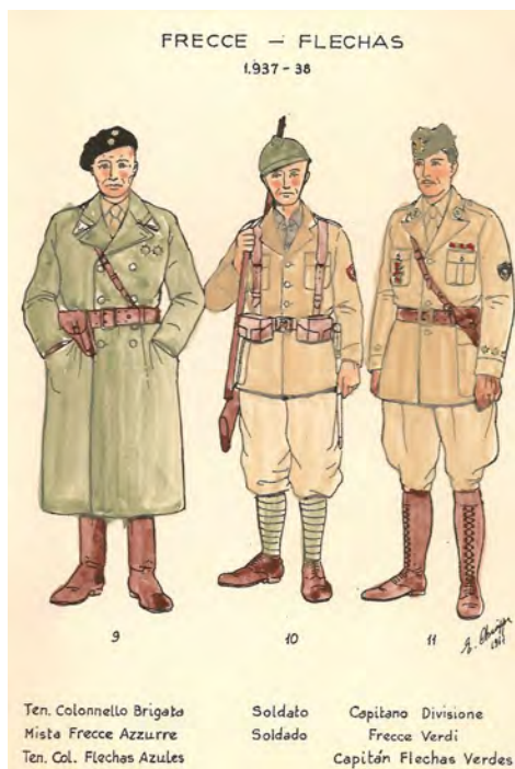
Figura 1. Uniforme militar de les Fletxes Blaves i Verdes 1937-38.

El CTV al complet o bé alguna de les seves divisions va participar directament en diferents fronts de guerra: el seu primer combat va ser a la batalla de Málaga (febrer de 1937). Durant aquesta batalla els italians van posar en pràctica la seva tàctica de guerra llampec ( guerra celere ), que depenia de la utilització de columnes motoritzades que avançaven a tota velocitat i tenien com