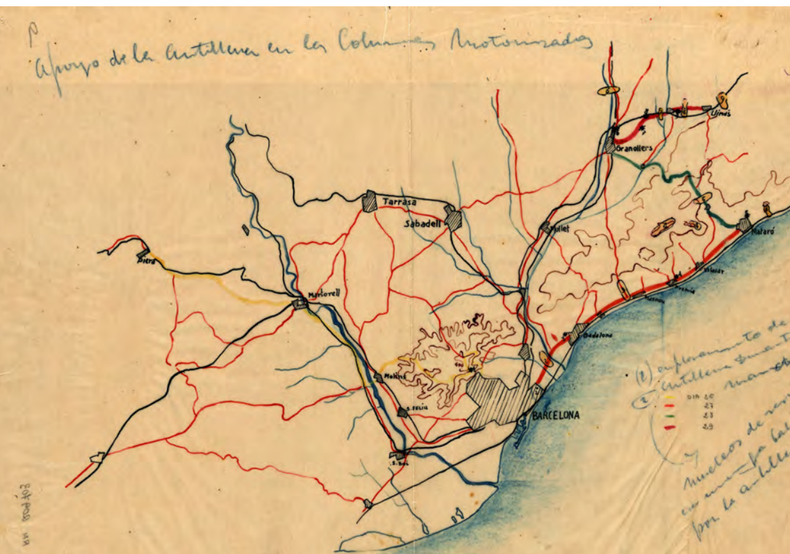
Figura 10. "Apoyo de la artillería en las columnas motorizadas". Mapa en paper vegetal de l'àrea geogràfica del Barcelonès, Baix Llobregat, Vallès i Maresme.

El mapa ens mostra el suport de l'artilleria a les columnes motoritzades del CTV. D'una banda trobem representats els "nuclis de resistència con enemigos batidos por la artillería" i, d'altra, l'emplaçament de l'artilleria. La ruta de les columnes motoritzades està pintada amb colors que ens indiquen l'avanç de cada dia. El 26 (color groc) les columnes es desplacen de Piera a Barcelona mentre que al Tibidabo trobem emplaçat un primer grup d'artilleria i un segon al litoral de cara al Besòs, on trobem el nucli de resistència número 2. El dia 27 (color vermell) les columnes motoritzades marxen de Barcelona i passen per Badalona, on trobem el tercer grup d'artilleria mentre que, a l'alçada del Masnou, trobem el tercer nucli de resistència. A Premià se situa el grup 4t d'artilleria mentre que el nucli de resistència 4 se situa a l'interior. A Mataró s'emplaça el 5è grup d'artilleria amb el nucli de resistència 5 al seu davant. El dia 28 (color verd) les columnes es desplacen per la carretera de Mataró a Granollers on es torna a trobar el grup 5 de resistència. El dia 29 (color grana) les columnes avancen de Granollers a Llinars, al nord de Granollers hi trobem el grup 6 d'artilleria enfrontant-se amb el nucli 6 de resistència, mentre que a la carretera de Llinars se situen els grups 7, 8 i 9 d'artilleria per tal d'atacar els nuclis 7, 8 i 9 de resistència.