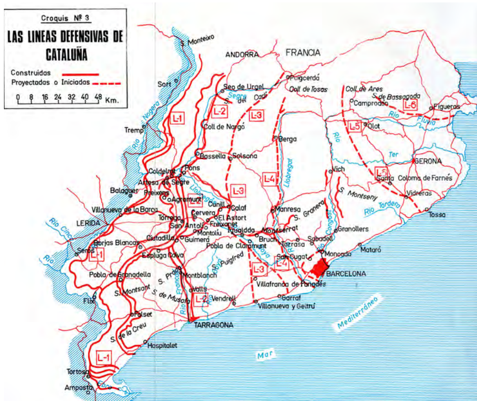
Figura 5. El pla de defensa del general Vicente Rojo es basava en sis línies fortificades successives pensades per protegir la retirada de l'Exèrcit Republicà i les comunicacions amb la veïna França.

blanc i Valls. 33 Altres línies de defensa eren la L-3 (Vilanova-Puigcerdà), la L-4 (desembocadura del Llobregat-Puigcerdà), la L-5 (oest de Tossa-oest de Camprodon) i la L-6 (Nord del Fluvià—est de Camprodon).