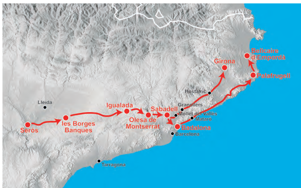
Figura 11. Recorregut del CTV a Catalunya. La ruta parteix de Seròs i arriba fins a Sabadell passant per les Borges Blanques, Igualada i Olesa de Montserrat. Des de Sabadell, es marquen dues rutes, una de Badalona fins a Belcaire d'Empordà passant per Mataró i Palafrugell i l'altra de Sabadell a Girona passant per Granollers i Hostalric.

L'ocupació de Catalunya es va fer de manera molt ràpida, només en 49 dies. De fet és la idea que defensava el comandament italià: la guerra llampec ( guerra celere ). Només va costar d'avançar els primers dies, la resta de l'ofensiva seria una marxa continua. Si ens fixem en els mapes que reproduïm en aquest