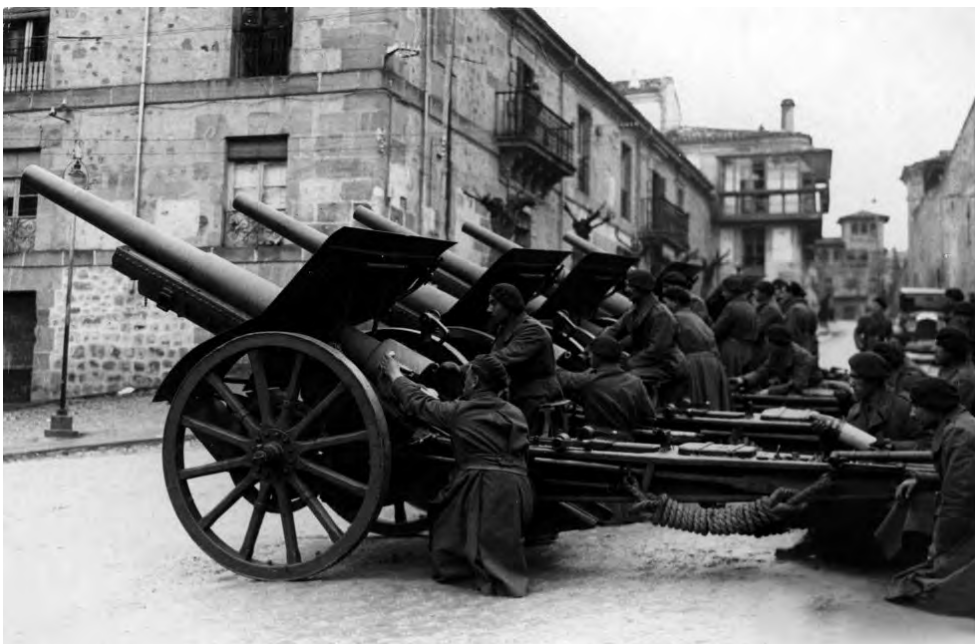
Figura 3. Canó de 105/28 construït per la casa italiana Ansaldo sota llicència de Schneider (Sigüenza, Guadalajara. Octubre de 1936).