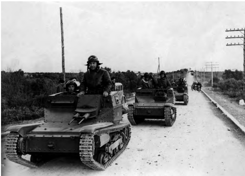
Figura 2. Tanquetes Fiat Ansaldo a la carretera de Guadalajara. Març de 1937.