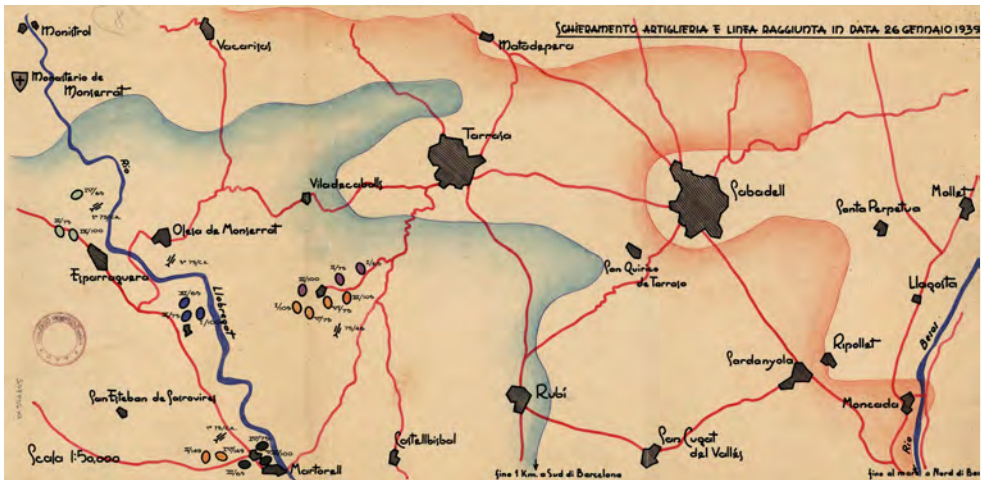
Figura 7. Desplegament de l'artilleria i línia assolida amb data 26 de gener de 1939. CTV. Mapa en paper vegetal de l'àrea geogràfica del Baix Llobregat i el Vallès.

La previsió del CTV per a l'endemà és d'arribar al Llobregat entre Monistrol i Olesa de Montserrat amb les Fletxes Verdes mentre que les Blaves ho faran des d'Abreera a Olesa. La columna motoritzada s'ha de preparar per anar cap a Barcelona.