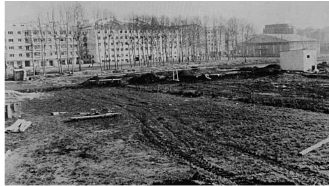
Figura 1. Terrenys on es van construir l'Escola Salvat Papasseit i l'Institut Vicenç Plantada. Imatge publicada al calendari de 1988 editat per l'Ajuntament de Mollet.

La novetat i la insistència de la pressió popular devia tenir els seus efectes per a l'Alcaldia, que des del 1965 era ocupada per la mateixa persona. El gener de 1976 es presenta una instàn-