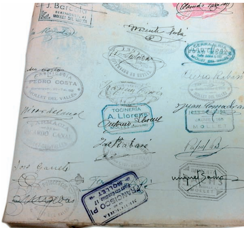
Figura 7. Signatures d'alguns dels comerciants que van donar suport a Pelegrí Pi.