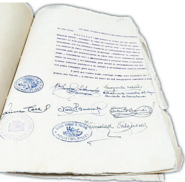
Figura 8. Signatures dels mestres que van donar suport a Jacint Marquina.