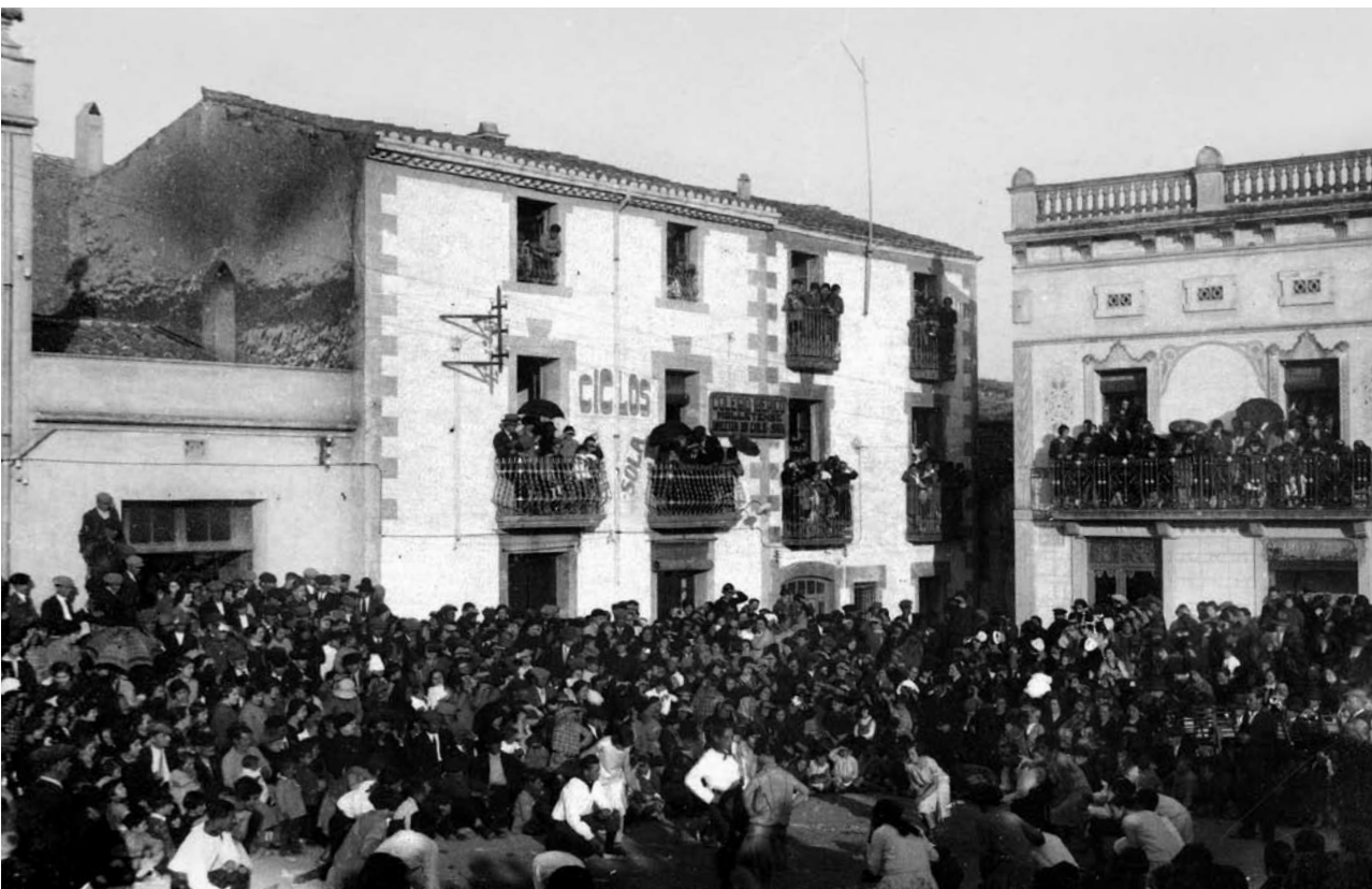
Plaça del Mercadal als anys 30.

panya, on tradicionalment es feia el ball, estaven a vessar. En tota la població es respirava un ambient festiu. El ball de gitanes del dilluns de Carnestoltes a Mollet es vivia aleshores com una festa molt celebrada per tothom, balladors i espectadors; i extensiva a altres poblacions. És fàcil pensar, doncs, que es tractava d'un veritable esdeveniment anual.