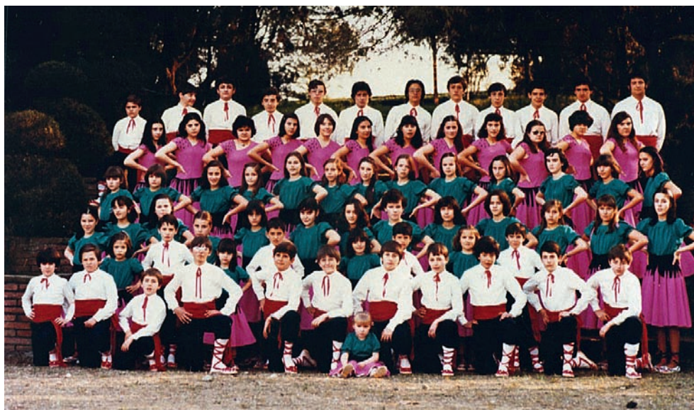
Colles infantil i juvenil, 1980.

carnavalesques i s'informa dels balls de trajes que se celebren s'afegeix que aquell any tampoc hi haurà ballada de gitanes i gairebé cada any es repeteix que es troba a faltar aquesta tradició.