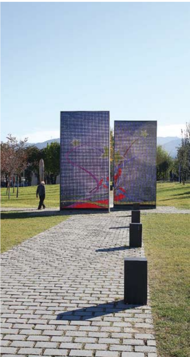
Figura 5. Pantalles de leds al centre de les Pruneres.

amb les formes que tenim al fons, la Serralada de Marina. Si ens posem a davant de l'arc, podem acabar amagant, amb les capçades dels arbres, la majoria de les construccions i el que acabem veient és una perllongació del parc amb la serralada.