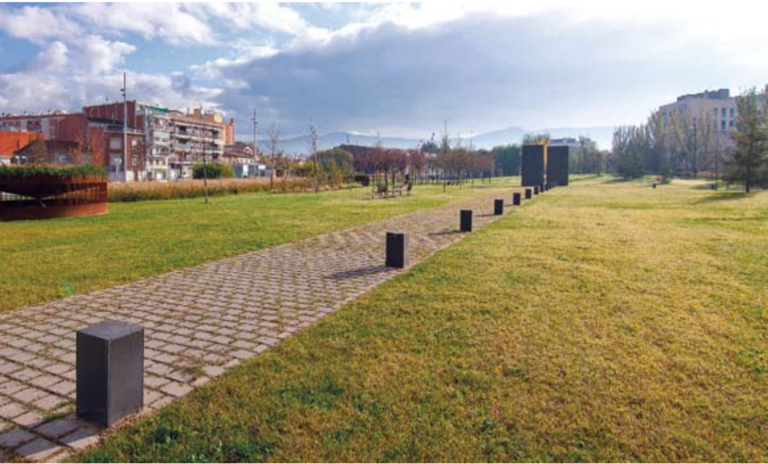
Figura 4. Parc de les Pruneres, amb la Serralada de Marina al fons.