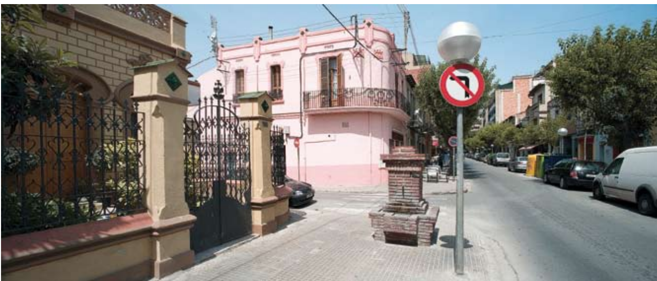
Figura 9. Carrer de Berenguer III, cantonada Jacint Verdaguer, amb la casa del número 100 i la font modernista. Ferran Mateo

La font del davant és modernista. En tot Mollet n'hi havia vuit, més la de la plaça de Prat de la Riba. L'any 1998 es van substituir totes les canonades d'aigua del carrer, que estaven molt malmeses i el clavegueram que passava per sota. Llavors es va haver de treure la font i es va tornar a reconstruir resseguint els dibuixos originals.