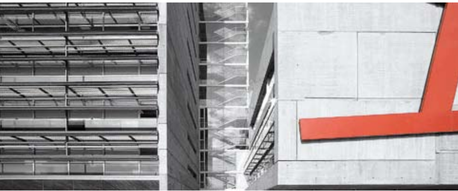
Figura 14. Vista parcial de la Casa de la Vila amb l'edifici administratiu a l'esquerra i l'institucional a la dreta, units per una escala envoltada de vidre. Ferran Mateo