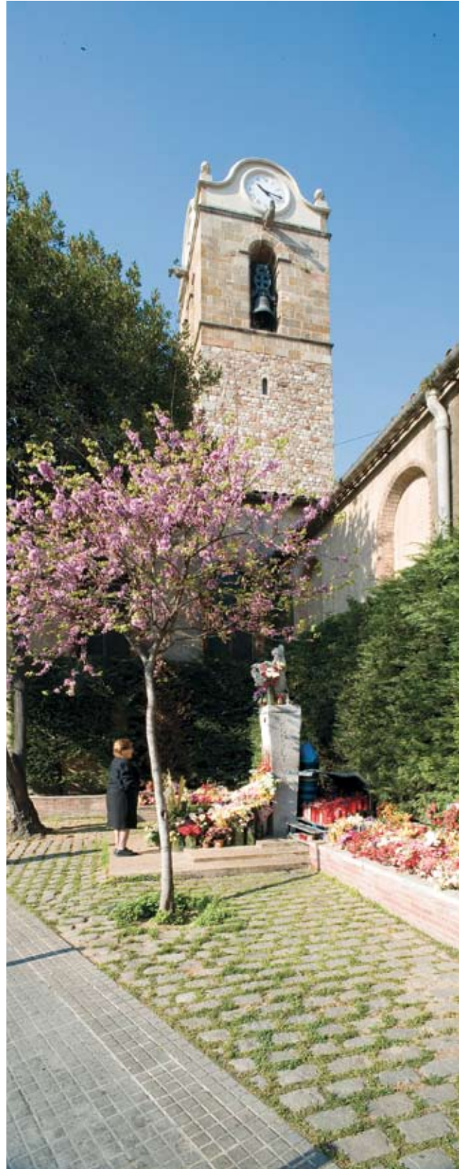
Figura 1. Imatge de Santa Maria de Mollet (Sebastià Badia, 1962) i al fons, el campanar. Ferran Mateo

La façana de l'església actual ens porta a recordar la importància dels símbols. Una porta d'una església