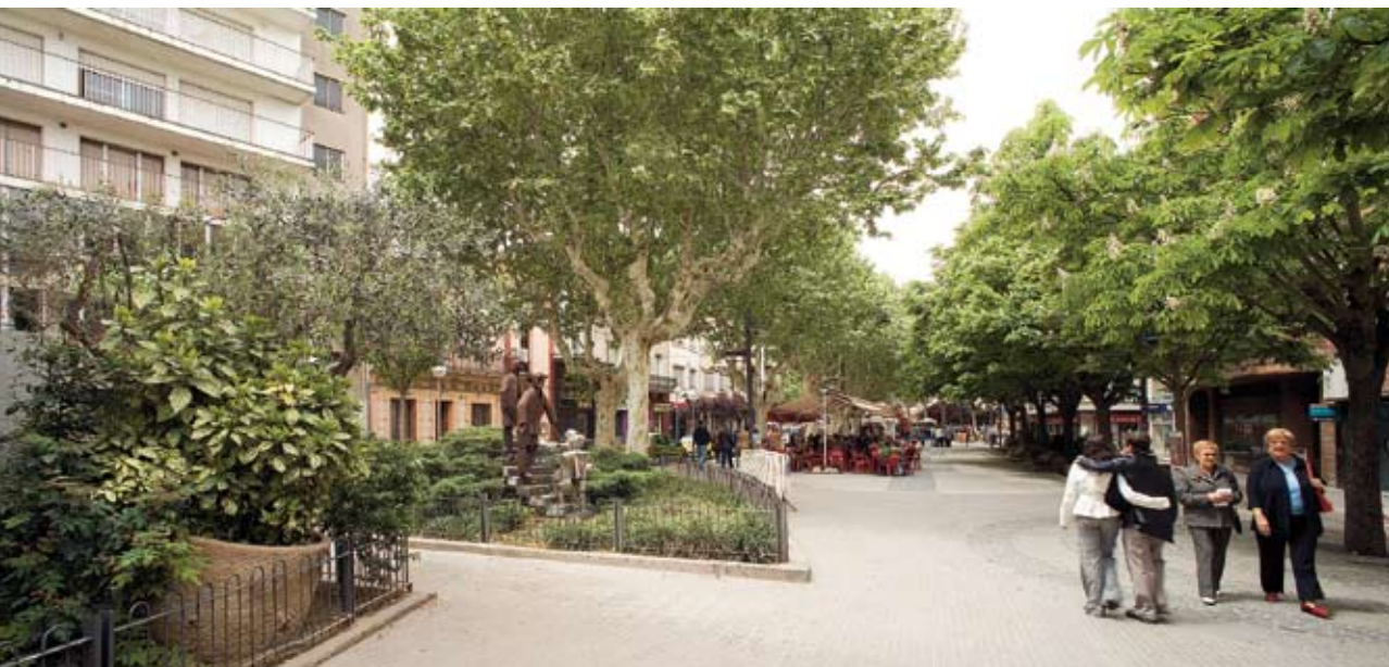
Figura 11. Rambla de Balmes. A l'esquerra, Casal Cultural i monument a Tots els vells del món . Ferran Mateo

molt diferents. Trobem acer inoxidable, acer corten (acer feblement aliat que en contacte amb l'aire es recobreix d'una pàtina de rovell densa que el fa resistent a la corrosió) i acer al carboni galvanitzat. L'acer inoxidable té un color lluent, ja està oxidant però no es veu. La lluentor simbolitza l'esperit de la joventut, el no pas del temps. L'acer corten es veu oxidat, però no és òxid de ferro, sinó una capa protectora que evita que el material continuï oxidant-se i queda un color de rovell que simbolitza la vellesa, la degradació. Però encara hi ha un element més, l'arbre de la vida. Inicialment, quan es va pensar en situar l'escultura aquí, es volia posar un dels plataners al voltant de l'escala, però després es va valorar que amb les arrels es podria alçar el terra i fer malbé el monument. Se'n va plantar un de nou, que es va assecar i així va quedar. Per tant, no es pot dir que l'escultura estigui acaba-