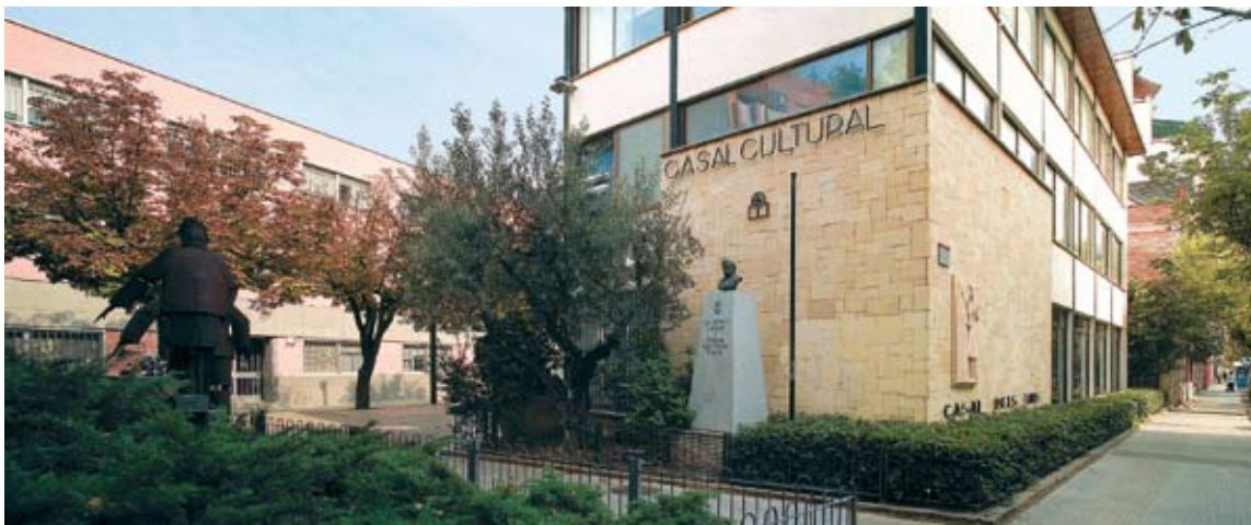
Figura 10. Casal Cultural (1964). Bust d'Anselm Clavé, mural de Ramon Sabí, test de pedra (possible cup romà) i monument a Tots els vells del món (Cesc Bas, Josep Nogué, 1995). Ferran Mateo