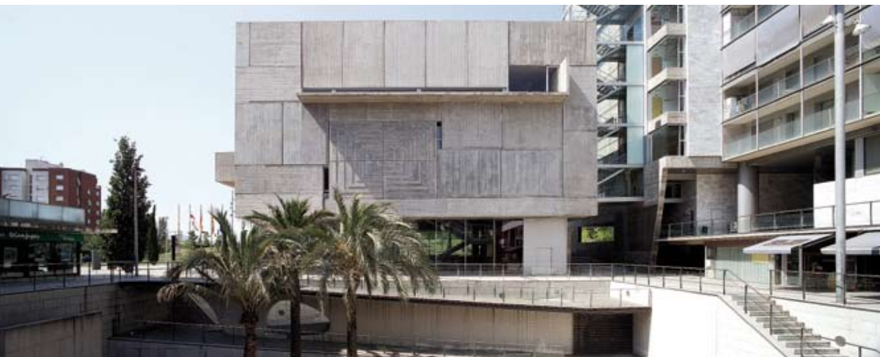
Figura 13. Edifici institucional de la Casa de la Vila. Ferran Mateo

Com al parc de les Pruneres, hi ha una zona de paviment llis i una altra sense pavimentar, amb ondulació i vegetació, però mentre a les Pruneres l'aparcament és sota la zona pavimentada, aquí s'oculta sota una gran duna amb gespa.