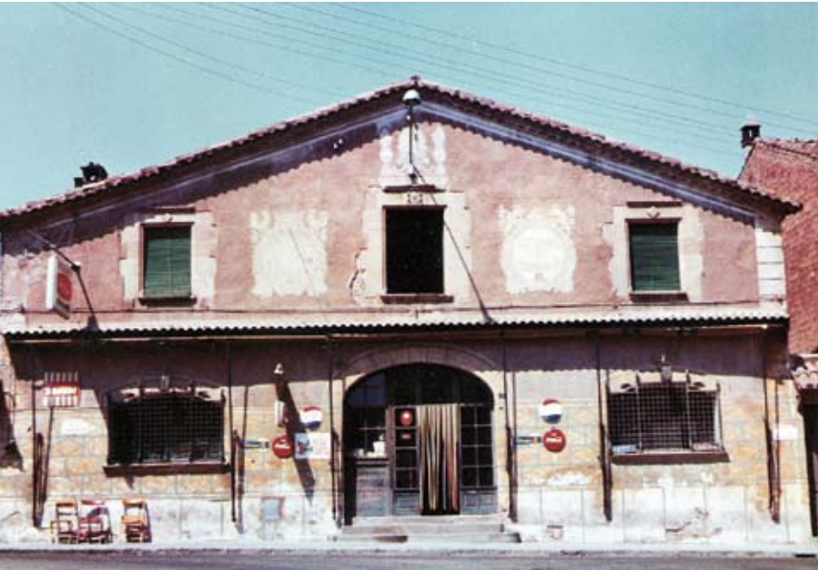
Figura 2. Hostal la Marinette a finals dels anys seixanta. Galobardes- Molins