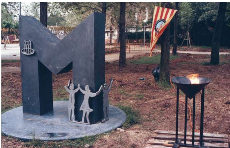
Figura 15. Monument Mollet, Ciutat Pubilla de la Sardana, al parc de Can Mulà (Lluís Gueilburt, 1992). Arxiu Històric Municipal.

el relleu del peix van preparar unes peces de fusta, que van posar dins de l'encofrat i el formigó, fins que es va assecar. La A es va soldar aquí i està formada per bigues en forma de U que es van anar tapant pel davant i pel darrera amb unes planxes. Es va soldar per art elèctric, amb elèctrodes, i després, unes grues i unes orelles van anar aixecant-la i penjant-la, com qui penja un quadre sobre els suports que s'havien fet prèviament a l'estructura.