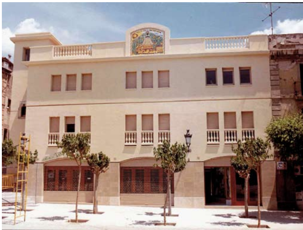
Figura 3. Cases de Prat de la Riba amb el mosaic de la Mare de Déu de Montserrat al fons.