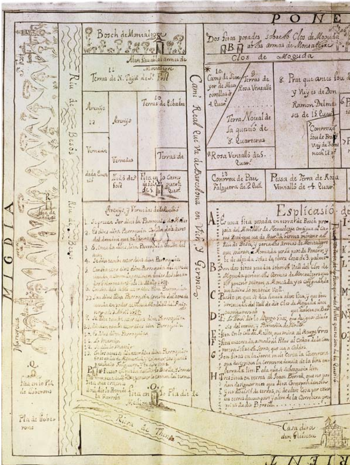
Figura 1. Plànol de la zona de Mollet i rodalies, vers 1726 (Ref: España. Ministerio de Educación, Cultura y Deporte.