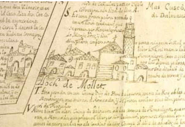
Figura 2. Detall de la part on es representa el poble de Mollet

retera que passa per la Serra / Palau Solitar [amb dibuix]