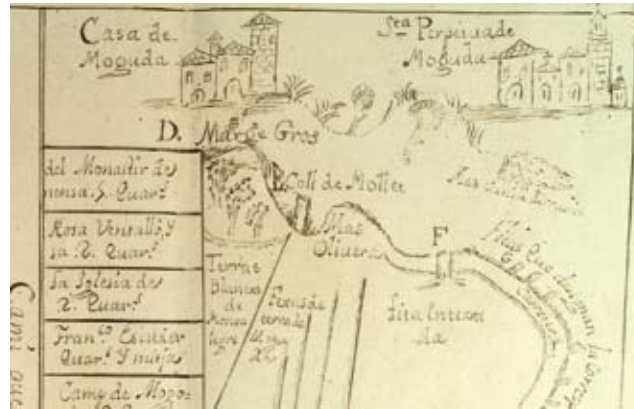
Figura 3. Detall de la part de Santa Perpètua de Moguda

T. Fita posada en un camp vuy de Pau Falguera, antes de Ros, ab las armas de Montalegre que miran de Moncada y se pretén arribar fins dita pedra la decimari de Moguda.