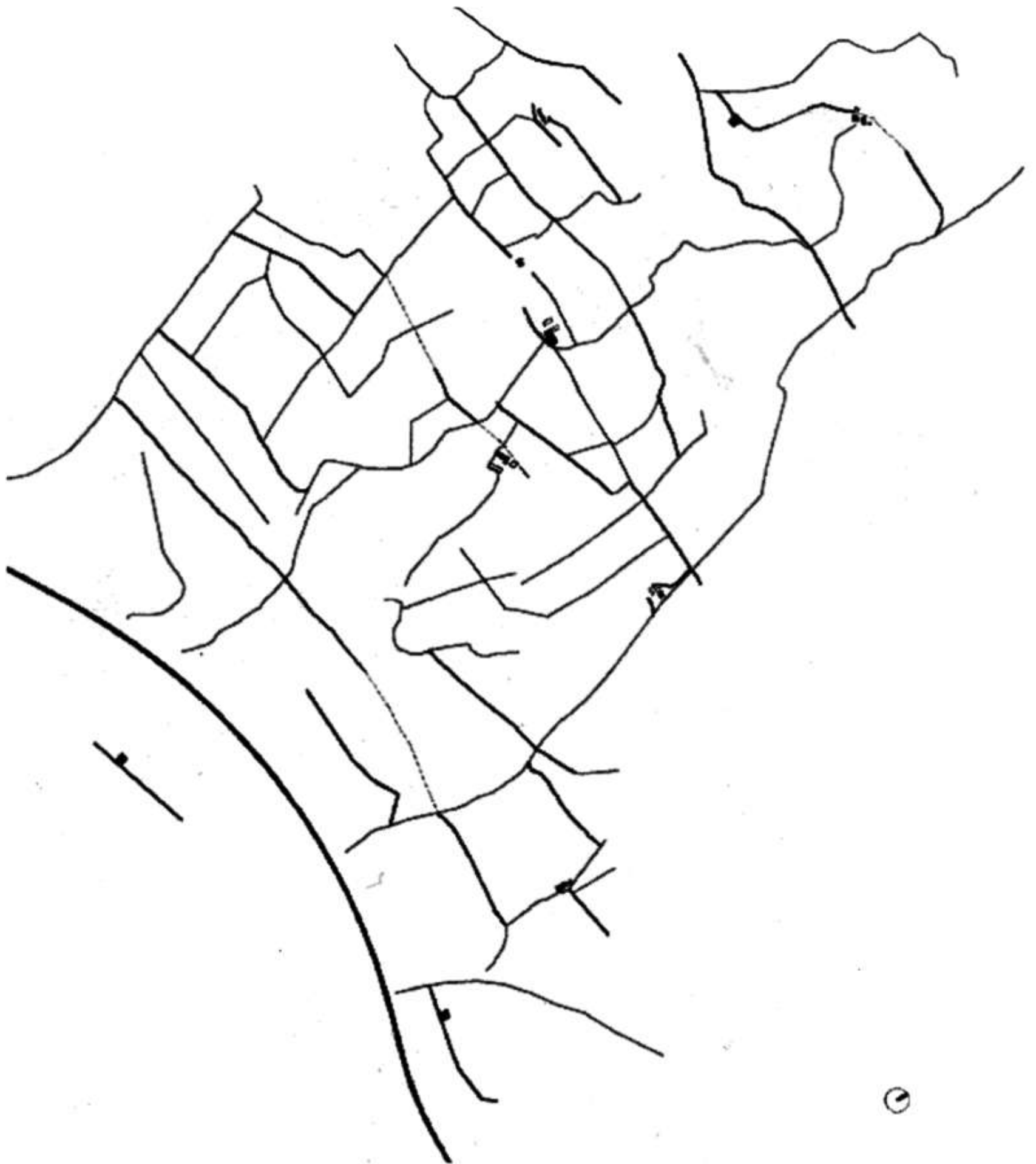
Les traces de Gallecs i les Masies. (Elaborat pels autors del treball)