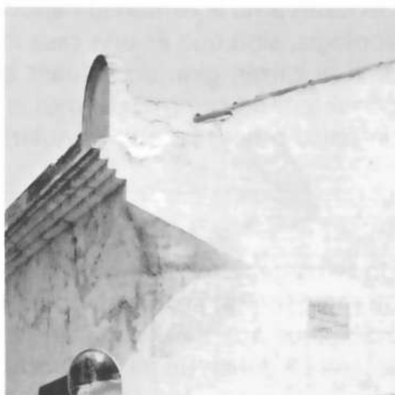
Buits, mitgeres, cases en cantonada, rafecs i cobertes