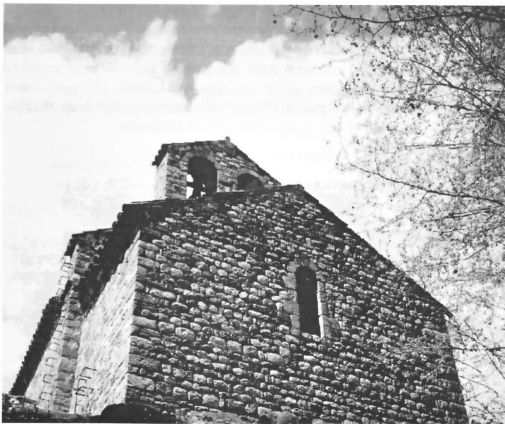
Sta Maria de Gallecs (Peça del Catàleg categoria A)