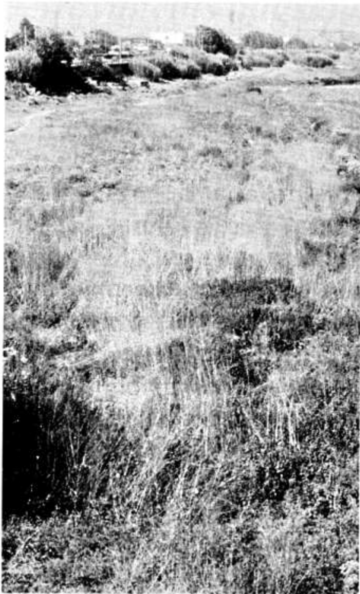
El territori de ribera a Gallecs

Tenint especial cura de la necessitat urgent d'intervenció en un dels espais naturals més interessants del sector i del municipi, i molt important pel valor ecològic i complet com els cursos d'aigua: la Riera Seca, la Riera de Gallecs o Torrent del Caganell i, sobretot, el Riu Besòs (estudi necessàriament complementari i conjunt amb altres municipis de la conca).