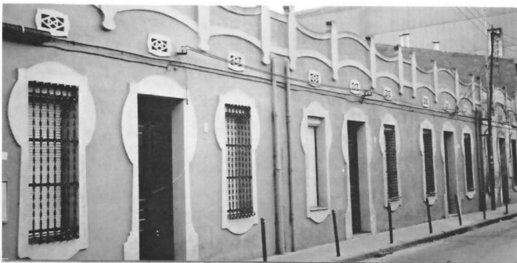
Conjunt de cases al c/Àngel Guimerà 7-9-11-13 (Peça del Catàleg categoria B)