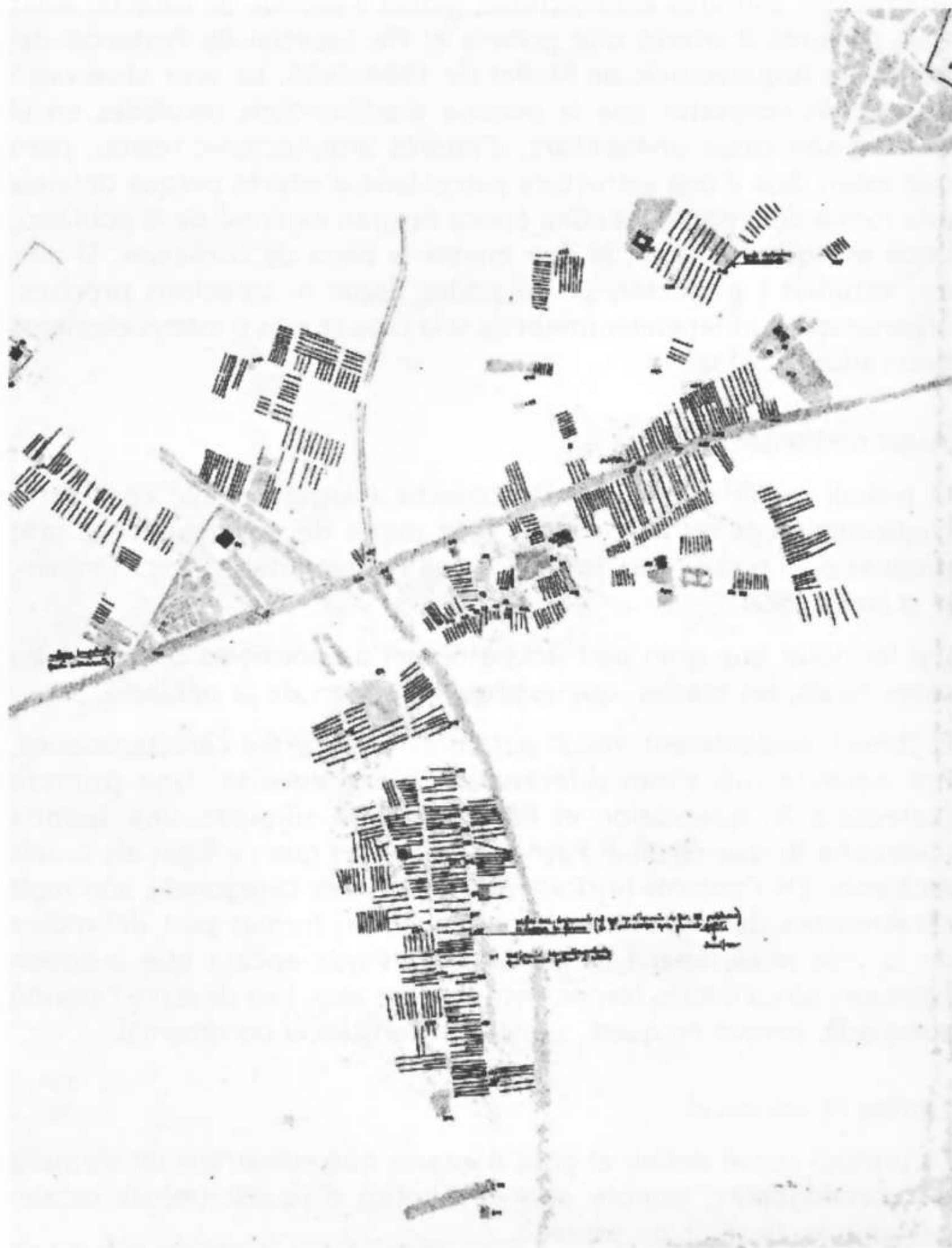
Les agrupacions parcel·laries i el primer gran creixement de Mollet (Elaborat a e1/2000 pels autors del treball)