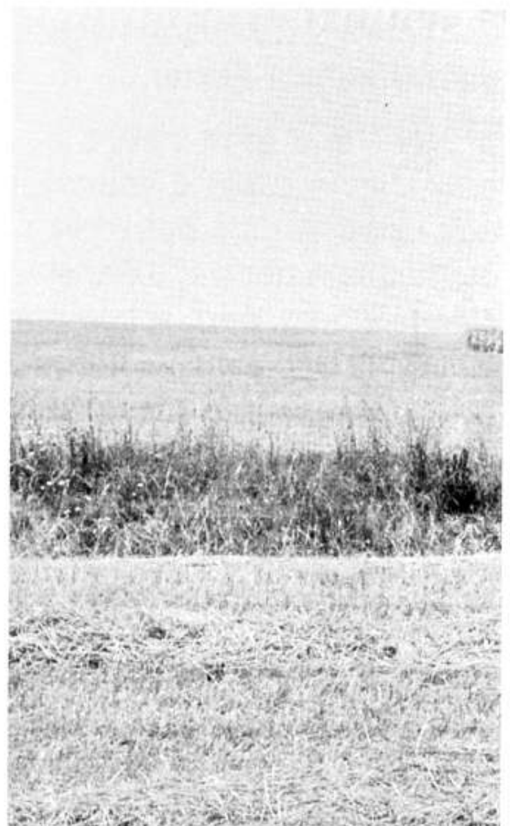
El territori de secà a Gallecs