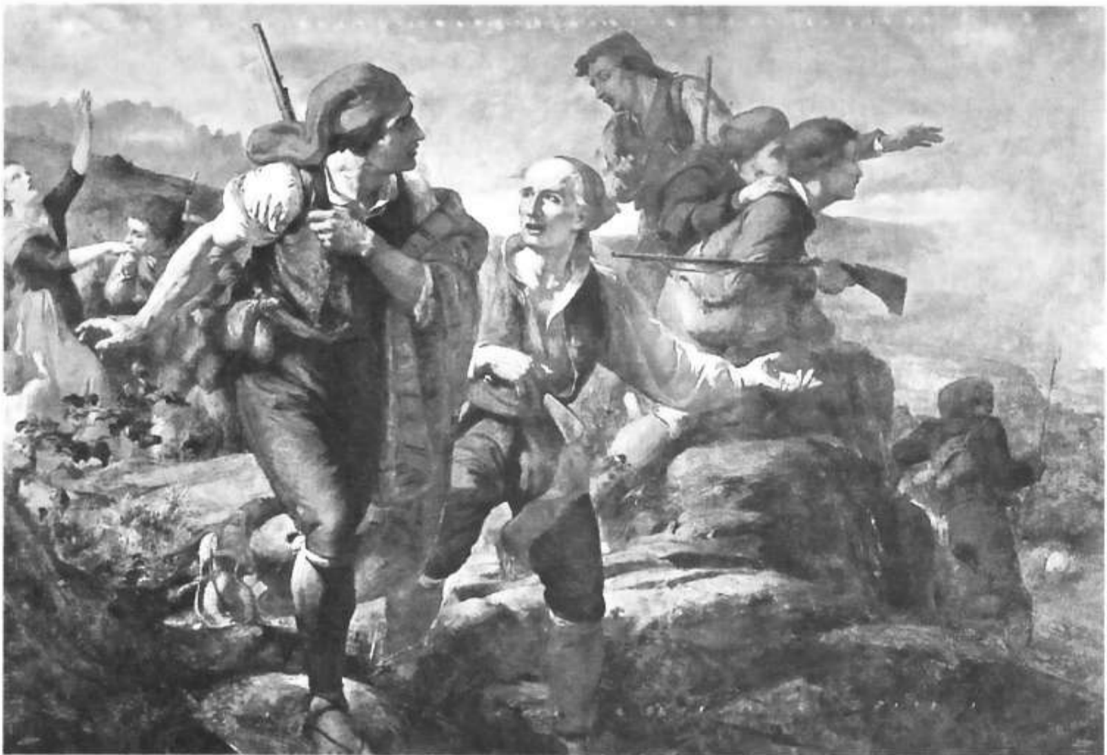
"El timbaler del Bruc". Ramon Martí i Alsina. El somatent del Bruc 1866

El títol de l'article tenia a veure amb la primera anècdota històrica que explicava. Es tractava d'un rudimentari sistema de senyals que, en l'època de l'ocupació francesa, permetia que els habitants del poble coneguessin quan arribava un comboi enemic. D'aquesta