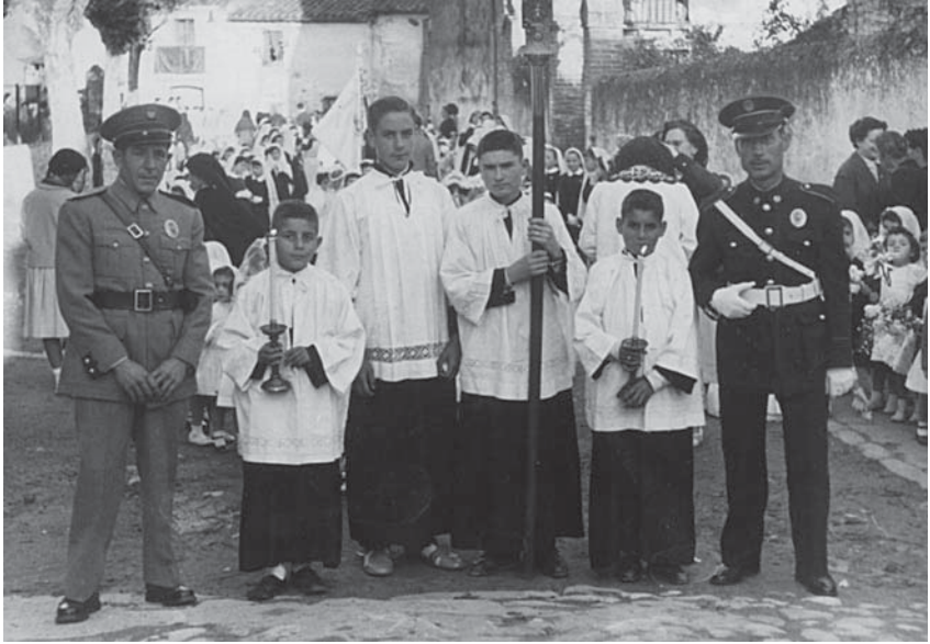
Anys cinquanta a Mollet del Vallès.