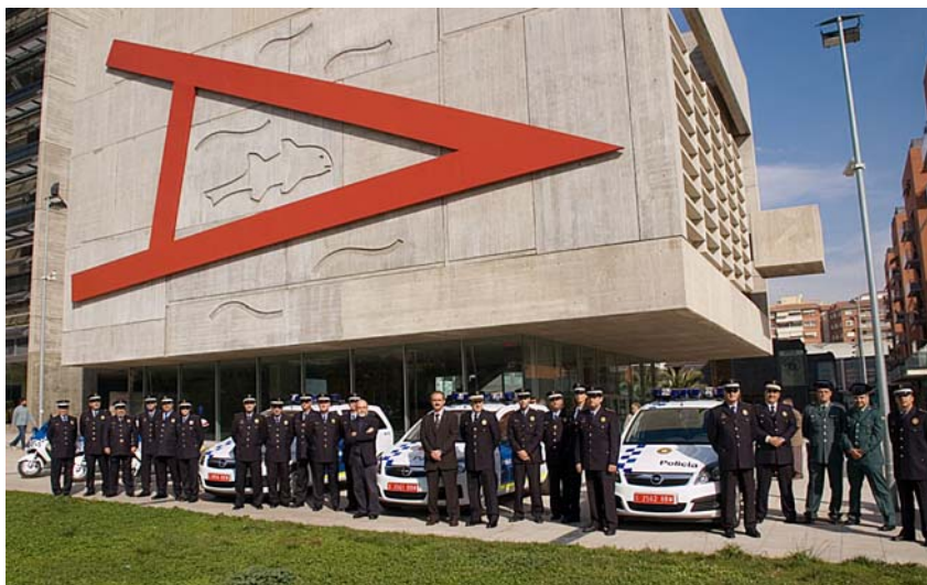
Presentació dels nous cotxes de la Policia Municipal davant la Casa de la Vila.

Tornem a Mossos i Policia Municipal. Respecte, coordinació, recursos, experiència, companyonia, treball en comú, mesa única de