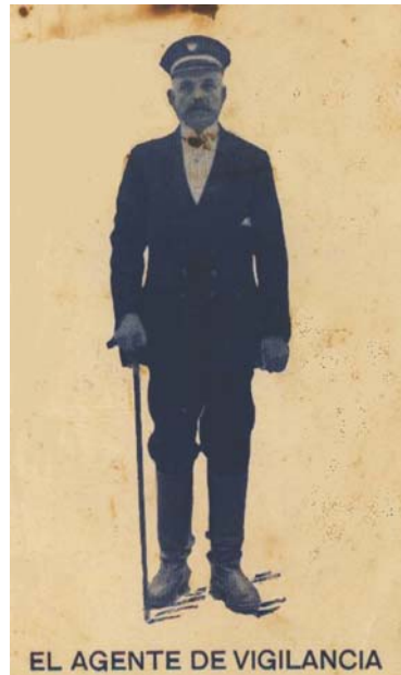
Felicítació de Nadal de l'any 1928. Mollet del Vallès.

tard, el cos de serenos s'incorpora al cos de la Guàrdia Municipal. Cinquanta anys més tard —ens diu l'epíleg de l'opuscle— la Policia Municipal estava dotada amb 71 policies que exercien funcions de Seguretat Ciutadana, Policia Comunitària, Seguretat vial i Trànsit, Denúncies i Atestats i Mediació i Atenció a la Víctima i, conjuntament amb la comissaria dels Mossos d'Esquadra, inaugurada l'1 de novembre de 2002, constituïen les forces de la Policia de Catalunya, a Mollet del Vallès. Un salt enorme; certament, un salt històric que mereix ser estudiat.