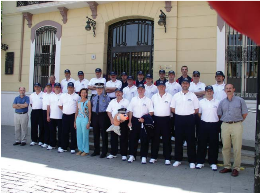
Olimpiada policial davant l'antic Ajuntament.