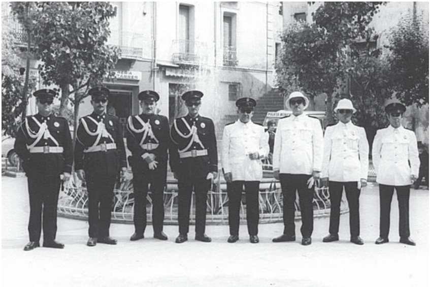
Anys seixanta. Plaça Prat de la Riba, Mollet del Vallès.