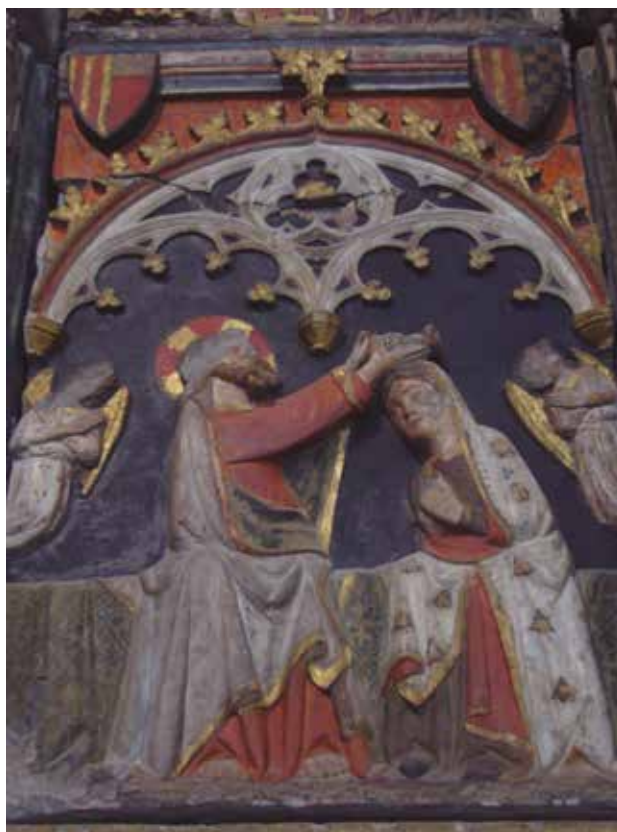
Figura 3. Detall del retaule d'Albesa amb els escuts dels comtes Pere d'Urgell i Margarida de Montferrat.

El rei Martí, arran de la seva amistat amb Margarida, li va regalar una estella de la veracreu que havia aconseguit del papa cismàtic Benet XIII. El lliurament de la relíquia