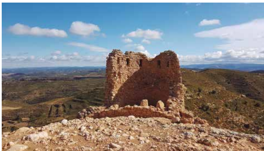
Figura 5. Restes del castell d'Olocau on estigué empresonada Margarida 1415-1418.