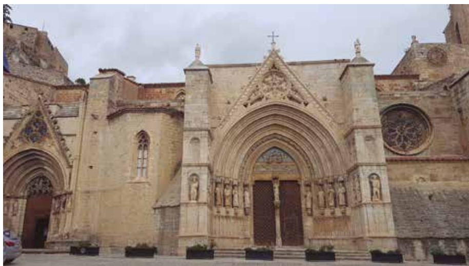
Figura 6. Església de Santa Maria de Morella. Margarida de Montferrat morí a Morella el 10 de novembre de 1420.

Margarida encara en reclamava el pagament al rei. 28 I encara Alfons, el 6 de març de l'any següent, el 1420, tornava a ordenar al batlle general que pagués el deute. 29 Contrasta la demora en el pagament de la modesta assignació a la comtessa i a les seves filles amb les elevades despeses de la flota que el rei preparava i amb les acusacions que s'havien presentat a les Corts contra les elevades donacions reials (VICENS 1969, 109-110). Poc temps després, el rei s'embarcava amb un estol de naus en aquesta costosa empresa amb destí a Itàlia. Sembla que Alfons, tot i les cartes amb mostres d'indignació, no tenia veritable interès a solucionar el problema del sosteniment de Margarida a la presó.