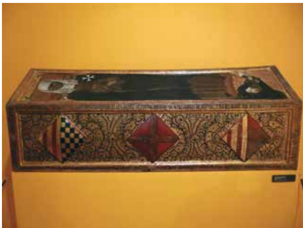
Figura 4. Caixa funerària de la filla Isabel d'Urgell, monja de Sixena.

(GIMÉNEZ 1901, 377). Es pot suposar que aquesta creu portava incorporat l'escut esmaltat de la comtessa, raó per la qual s'identificava clarament com un objecte que li pertanyia. Les armes dels Montferrat figuraven en altres joies valuoses que també van ser embargades als comtes i en diversos objectes que els van pertànyer (VELASCO - FITÉ 2016b, 75).