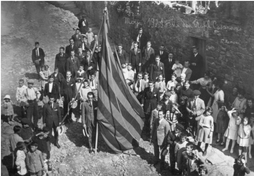
Celebració de la Diada de 1921, al carrer de la Cendra, davant el Foment Nacionalista Català Rafel Casanova