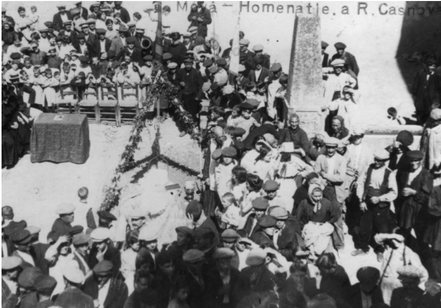
Primera pedra al monument de Rafel Casanova a la baixada del Mestre, 13 de setembre de 1914