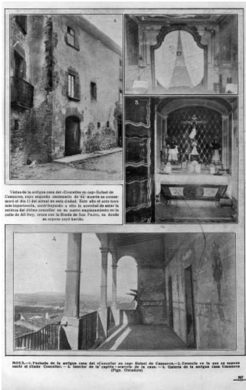
Fotografies de Can Casanova, del sabadellenc Josep Obradors, publicades a La Hormiga de Oro , el 19 de setembre de 1914

A continuació, y previo discurso del representante del Ayuntamiento, se procedió al descubrimiento de una artística lápida, con la cual se dió el nombre de calle d'en Rafel de Casanova á la misma donde se halla enclavada la casa histórica de la familia de los Casanova.