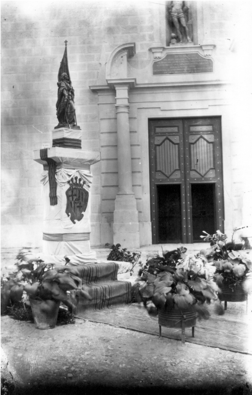
Estàtua no permanent del Rafelet, davant l'església de Sant Sebastià, l'any 1919