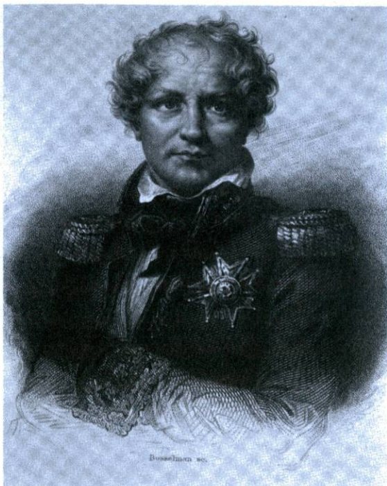
El mariscal Saint-Cyr comandava les primes tropes franceses que passaren pel Moianès (Bosselman, «G. Saint-Cyr». Biblioteca Nacional, Madrid)

menaven «insurgents». Els exèrcits imperials van penetrar moltes vegades cap a la Catalunya central i muntanyosa perseguint les tropes patriotes i cercant provisions i botí, però havien de marxar-ne aviat perquè s'hi trobaven insegurs i massa lluny de les bases. Només a partir de 1810 pogueren afermar-se a la plana de Lleida després de conquerir aquesta ciutat, i a partir de 1812 pogueren establir guarnicions permanents en dues ciutats de l'interior: Olot i Puigcerdà. Els napoleònics calculaven que necessitarien 60.000 homes per a sotmetre totalment el Principat, però mai no pogueren passar d'uns 40.000.