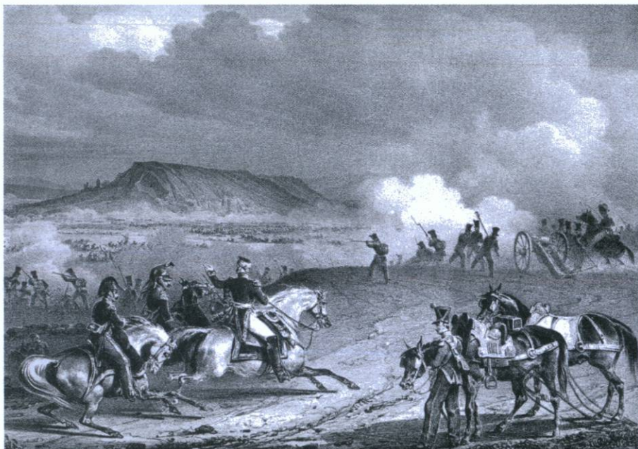
Escena que representa la batalla de Vic; en ser derrotades, les tropes espanyoles marxaren d'estampida cap al Moianès, seguides per les imperials (C. Langlois, «Bataille de Vich». Biblioteca de Catalunya, Barcelona)

l'endemà es plantaren a Manresa, d'on hagué de fugir el governador Ventura Vallgornera. El dia 18 de març totes les columnes franceses ja eren a Molins de Rei, per intentar altra vegada l'avenç cap a la baixa Catalunya que encara se'ls resistia.