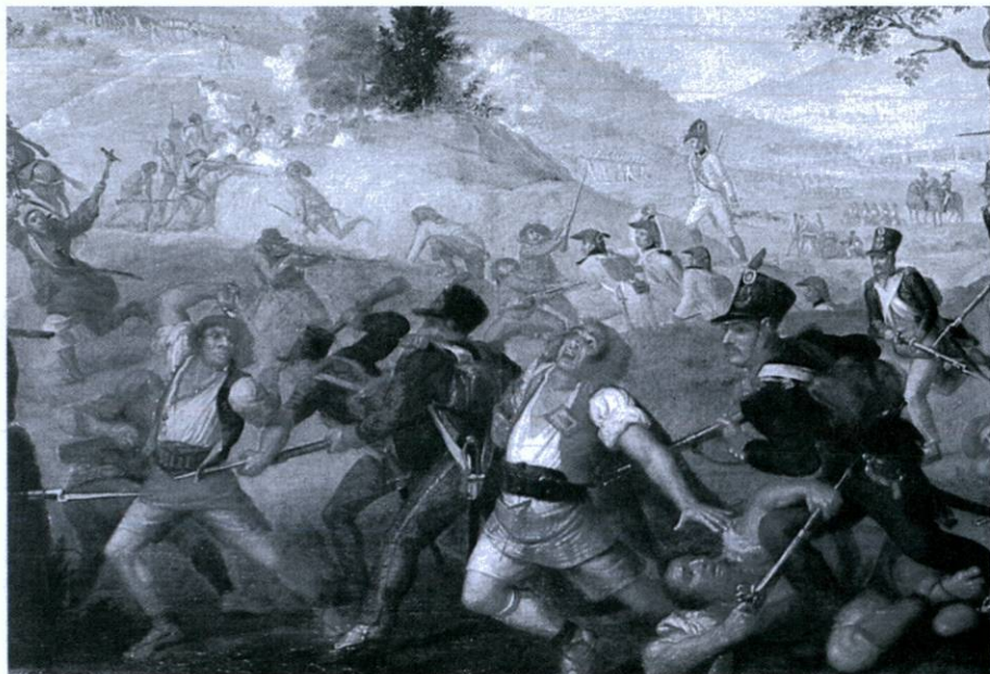
Detall d'una batalla de la Guerra del Francès pintada per Josep Flaugier ( Història de Catalunya, Edicions 62 )

era el revers de la gran participació de la gent en la resistència. Fou necessari canviar el llenguatge i usar profusament les paraules poble , nació , pàtria i revolució . L'exercici de la política es va complicar.