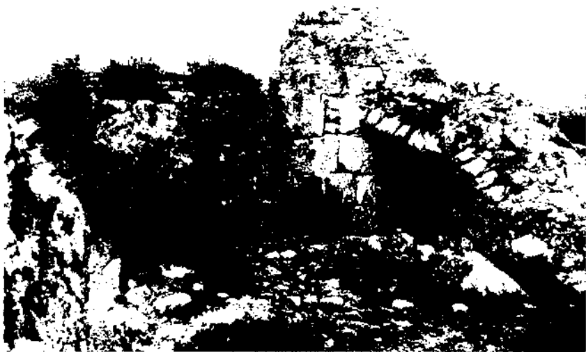
Al punt més elevat de la muntanya d'Olèrdola s'aixequen les restes d'una fortalesa medieval bastida sobre una torre-talaia d'època romanorepublicana (1968).