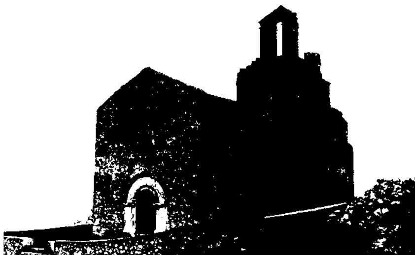
Vista frontal i lateral de l'església de Sant Miquel de l'antic poblat d'Olièrdola (foto Albert Virella - 1971).