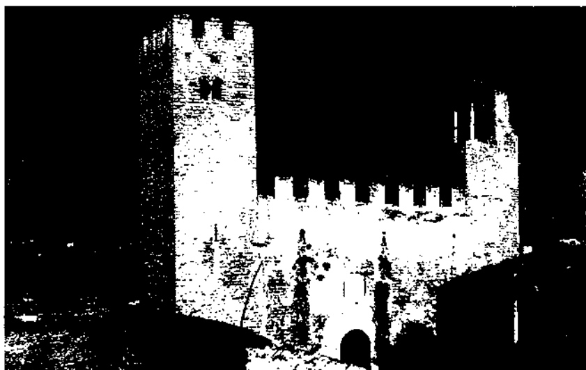
El castell del Remei, o de Santa Oliva constitueix un bell exemplar de l'arquitectura militar del segle xi.

En no acordar-se i poder afirmar una sentència favorable a cap de les parts, la qüestió fou sotmesa al Judici de Déu per mitjà de la prova "per albatum". (24) Finalment, i en no poder provar cap de les dues parts la veracitat sobre la qüestió que es dirimia en el litigi, s'arribà a una concòrdia entre ambdues parts. (25)