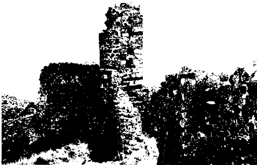
Testimonis pretèrits en vies de desaparèixer del castell del Montmell (1972).