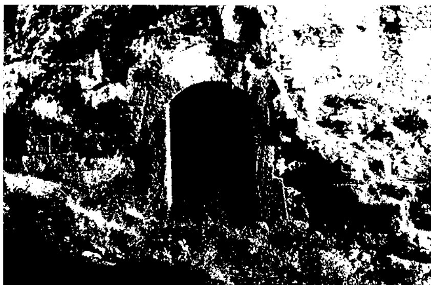
Casa de Sant Vicenç de Calders, que mostra possibles elements castellers (foto Arxiu Joan Virella - 1967).