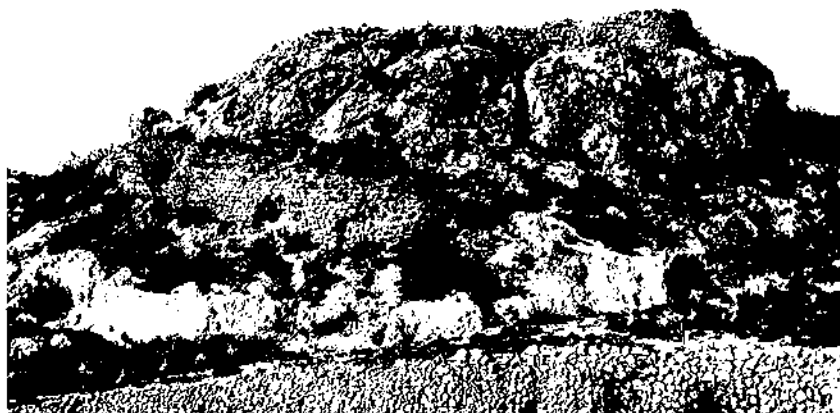
Peany roquer on se suposa que s'assentava el castell d'Albinyana.

anys, i tenint en compte l'encara llavors recent desastre de l'any 985, l'economia del monestir devia trobar-se força folgada. La documentació coetània d'aquells anys sembla palesar-ho sobradament.