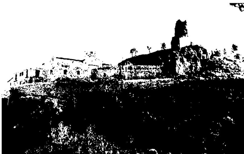
Vista de les ruïnes del castell de Subirats, un dels més antics de la comarca, i del santuari de la Font Santa, antiga capella castellerà (foto Vicenç Carbonell - 1974).