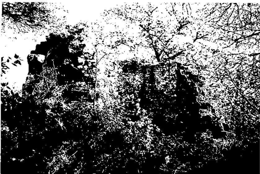
Restes de la torre de planta circular que centrava l'antic castell de l'Aibà.