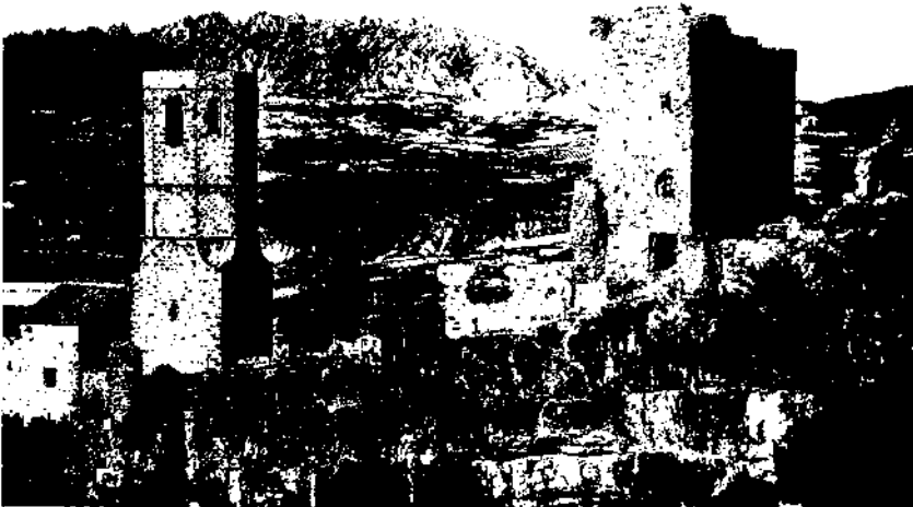
L'església castellera de Sant Pere i les restes de les dependències del castell de Gelida ocupen un allargat esperó rocós gairebé inexpugnable.