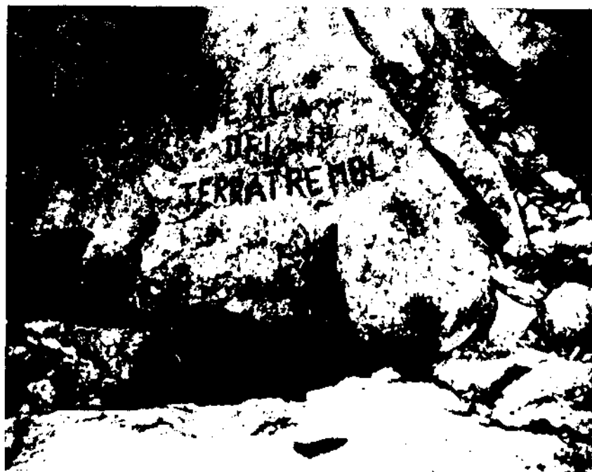
Fotografia de l'any 1969 de la boca d'entrada de l'avenc de la Roser, cavitat del pla d'Ardenya, avui desapareguda.