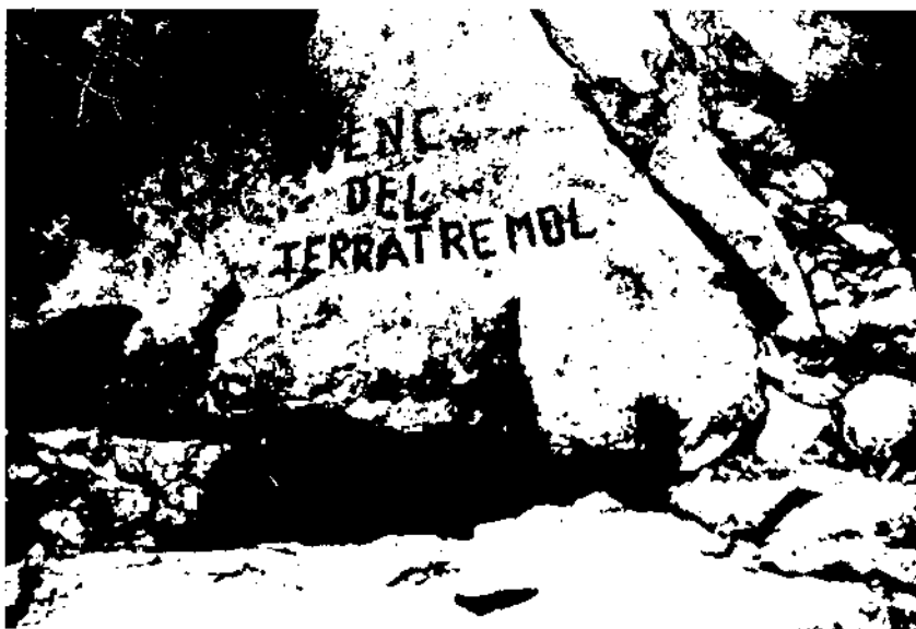
Fotografia de l'any 1969 de la boca d'entrada de l'avenc del Terratrèmol, també desaparegut per acció de la pedrera del pla d'Ardenya.

L'espai de sota la casa s'utilitzà com a celler de bótes i en la dècada dels cinquanta s'hi construïren tines de ciment armat per a la seva collita de vi.