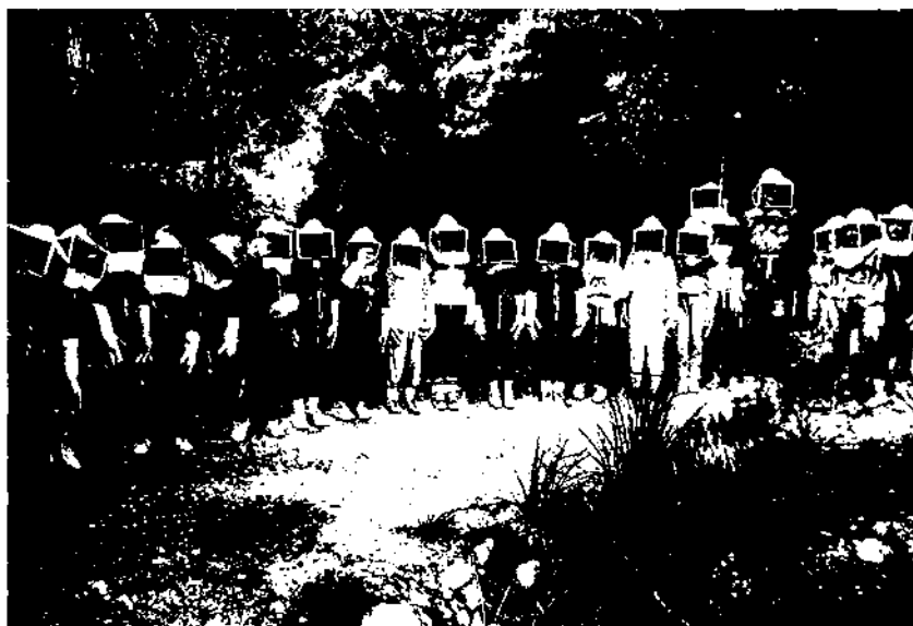
Grup d'alumnes del cicle mitjà de primària a la casa de colònies Can Pere, de Sant Pere de Ribes. Preparats per fer el taller de les abelles. Juny de 1991.