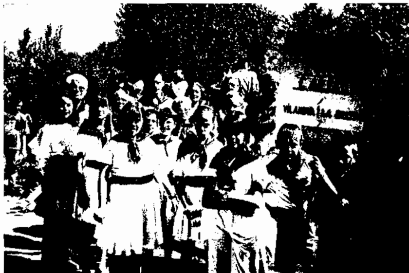
Grup de sardanistes amb els seus monitors. Dissabte, 7 de juny de 1997. Parc de la Ciutadella de Barcelona. Fi de curs organitzat per la campanya «El país a l'escola» de l'Acció Escolar del Congrés de Cultura Catalana.