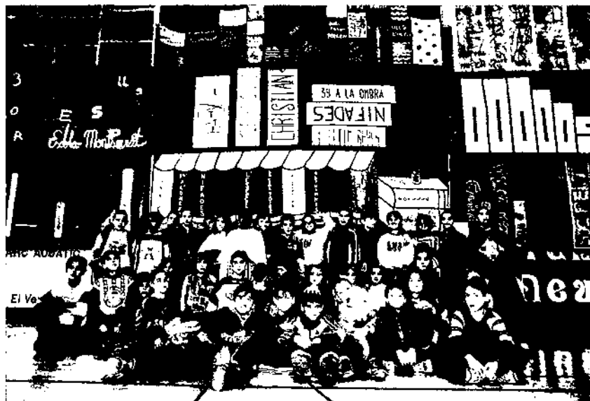
Grup de nens i nenes del cicle superior de primària al Poliesportiu del Garraf convertit en biblioteca, davant dels cartells que varen pintar per a la nit de Santa Llúcia. 12 de desembre de 1997.