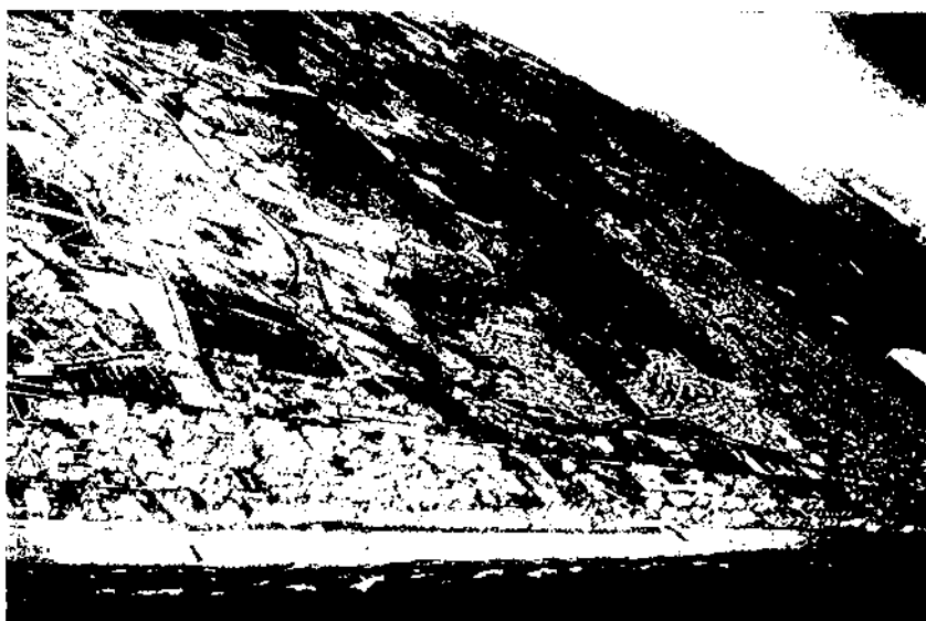
La dispersió urbana, tal com per exemple es dona a la comarca del Baix Penedès, és la forma característica que està prenent l'actual procés d'urbanització de Catalunya.

concentrar-se al cor metropolità— cal que sigui considerada com una opció de diversificació del teixit productiu, i especialment el procés irreversible vers la dispersió demogràfica (despoblament de l'àrea central metropolitana cap a les corones perifèriques) ha de ser entès com una possibilitat de captació de nous residents. És significatiu el fet que municipis com Calafell o Cunit guanyen mensualment nous empadronats. La millora de les comunicacions amb Barcelona —ja sigui mitjançant una major freqüència i eficiència del ferrocarril, ja sigui, properament, gràcies a la continuació de l'autopista A-16 fins al Baix Penedès— i un diferencial de preus del sòl i de l'habitatge considerable respecte al cor metropolità estan tenint com a conseqüència més notòria l'inici d'un procés de conversió de segones residències en habitatges permanents.