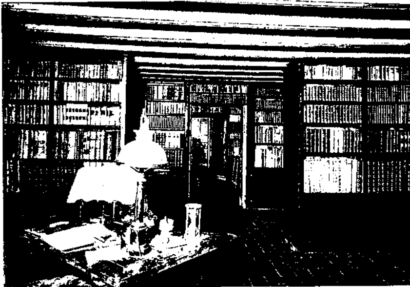
Biblioteca noucentista de la Casa Papiol.

Maria de Nàpols. La tercera temptativa es basà en l'acreditada fertilitat, i així escollí Amàlia de Saxònia. Nada el 1803, passà la frontera el 2 d'agost de 1819 i morí el 18 de maig de 1829, sense donar al marit el noi que tant ansiava. I a la quarta anà a la vençuda: fou Maria Cristina de Nàpols, filla de la infanta Maria Isabel. Era la quarta esposa de Ferran i fou la darrera, ja que el monarca estava envellit i malalt i no eren imaginables més aventures. El seu germà Carles i la infanta Francisca —filla de Carlota Joaquina— esperaven que no es trenqués la mala sort de la nova cunyada. El casament tingué lloc el dia 11 de desembre de 1829. El dia 9 de desembre de 1829, Ferran VII es casà amb Maria Cristina i veié en ella la núvia més bonica de totes les reines que havien compartit el tron.