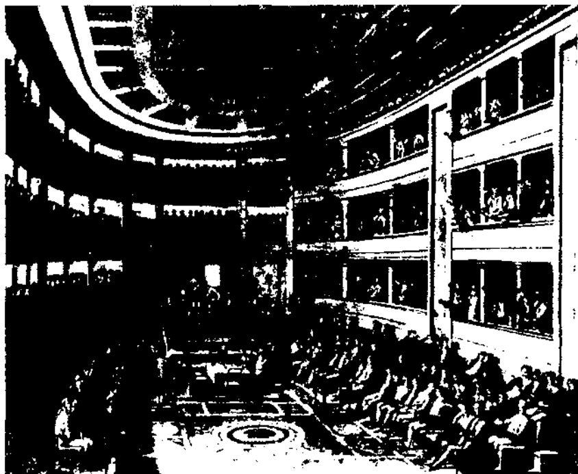
Una sessió de les Corts.

Però la infanta no es rendia i lluità fins a la darrera hora per ser portada a un setial que mai no obtingué. Però, així sí, mai no renuncià a mantenir un bon contacte amb les persones que li feren costat. En una carta autògrafa de la infanta dirigida a Francesc Papiol de Padró: