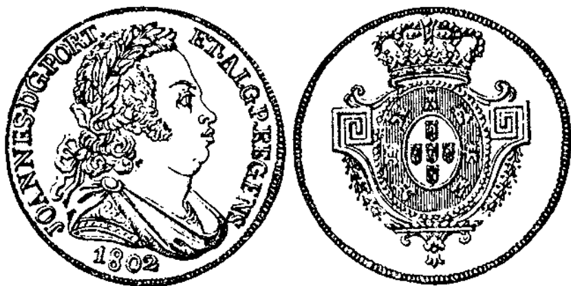
Moneda d'or de D. Joan, príncep regent de Portugal, casat el 25 d'abril de 1785 amb Carlota Joaquina de Borbó.

armada a tota pressa, de manera que el 27 de novembre començà l'embarcament cap al Brasil, amb tota la família reial i molta gent cortesana, servents i un gran embalum d'estris variats. L'arribada al Brasil d'aquella extravagant flota tingué lloc el 22 de desembre. No hi mancava la princesa Carlota Joaquina, ni tampoc el regent príncep Joan, el qual, per raó d'intrigues palatines, deixà la seva esposa, la qual s'instal·là a Rio en un palau separat del que estatjava el seu marit i entrà en un període d'intromissió en els afers de la política que, per sempre, fins a l'hora de la mort, mai més no abandonaria.