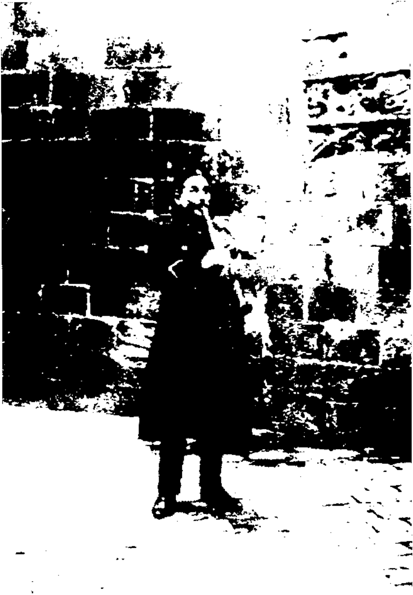
Conrad Cardús i Canals amb el clarinet (1923).