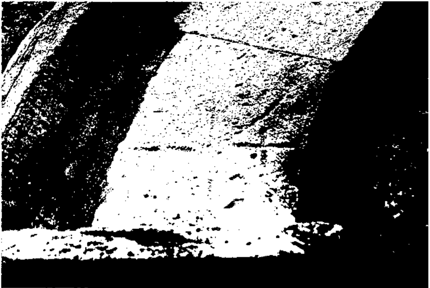
Santa Maria de Lavit. Torrelavit.