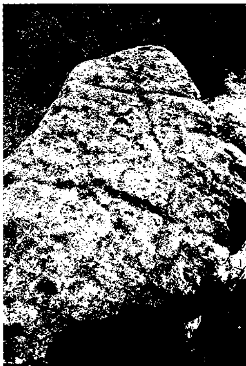
Coberta del dolmen de Plans de Ferran. Argençola.