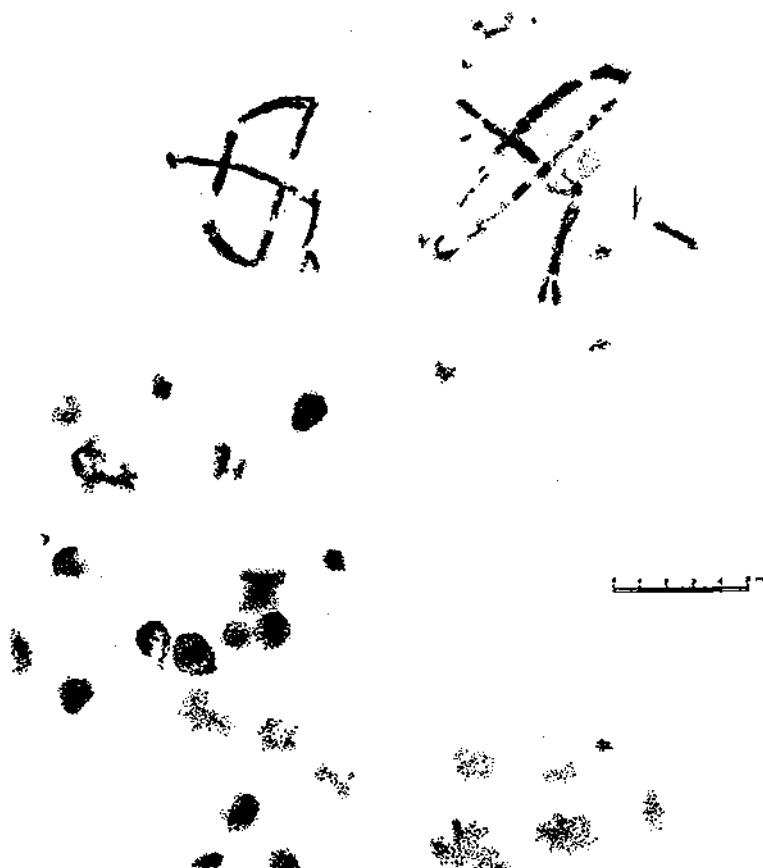
Calc de les pintures esquemàtiques de la Cova de Segarull, segons Eduard Ripoll.