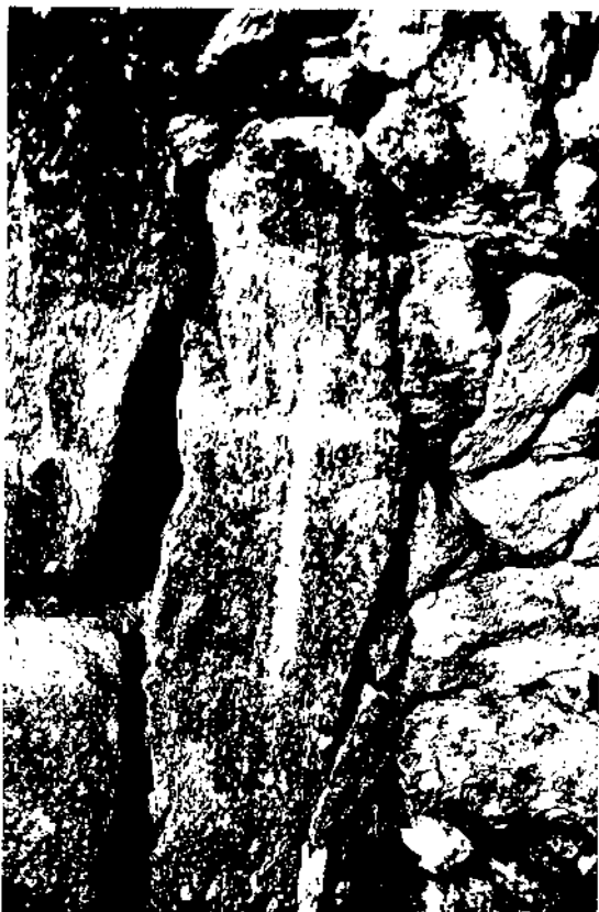
Via Romana. La Granada.