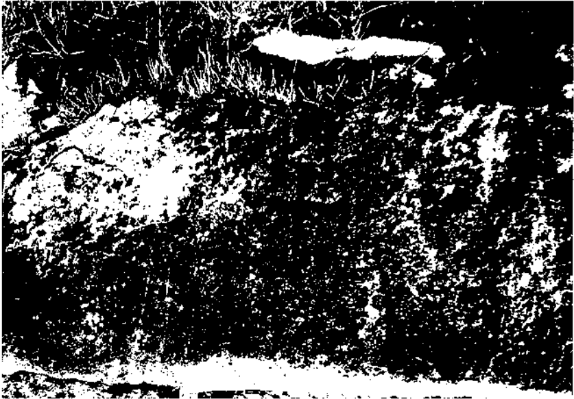
Font de Llinàs. Font-rubí.