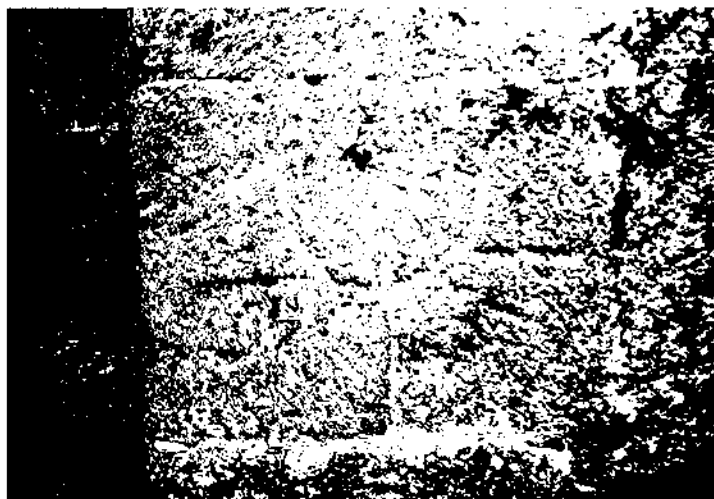
Sant Martí Sadevesa. Torrelavit.