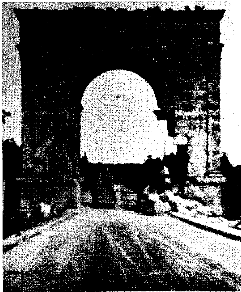
El Arco de Berà destruido parcialmente durante la revolución de 1936. (Foto inédita)

Efectes causats al monument romà per les càrregues de dinamita que hi foren col·locades l'any 1936. Per sort, no foren suficients per enderrocar-lo.