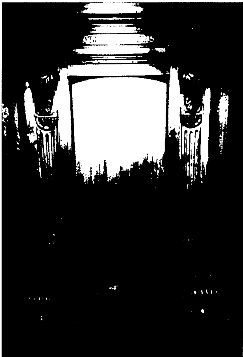
Cadira de la Sala de Juntes de la Biblioteca-Museu Balaguer dedicada al pare Llanas.