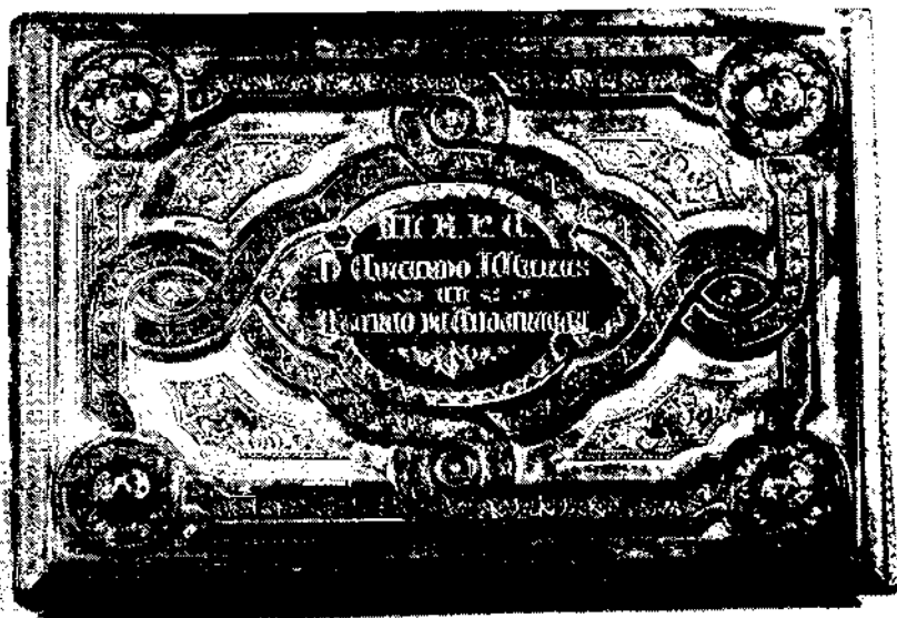
Portada de l'Àlbum en Homenatge al pare Llanas dipositat a la Biblioteca-Museu Balaguer.