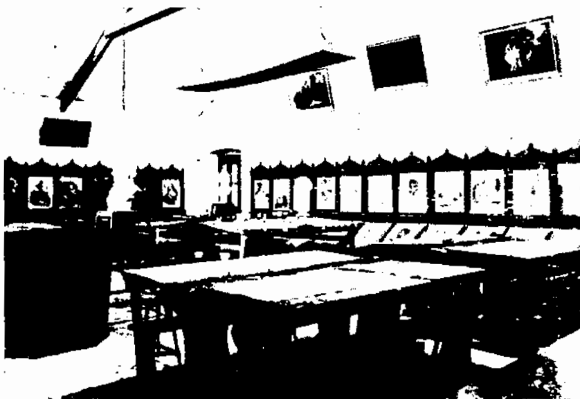
Classe de dibuix.