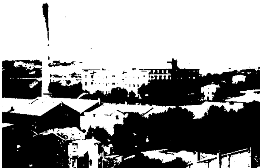
Vista general de les Escoles Pies de Vilanova i la Geltrú.