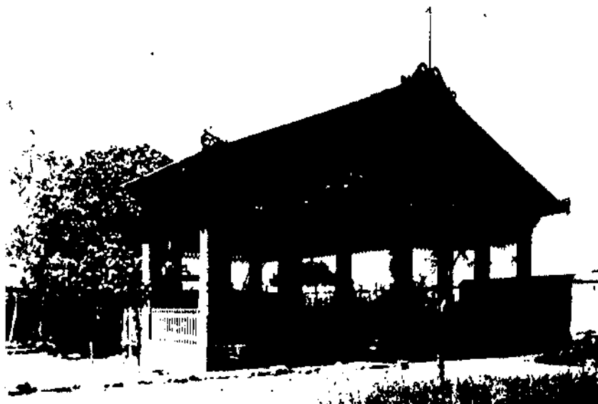
Pavelló exterior de gimnàstica.