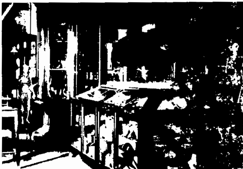
Laboratori de física i museu d'història natural.