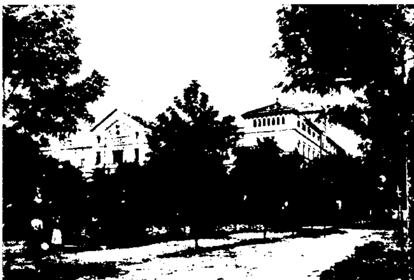
Façana principal del col·legi des de la rambla Samà.