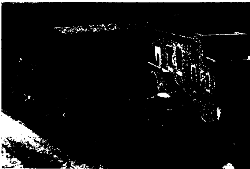
El castell de Sant Martí Sarroca (Alt Penedès). El passat i el present d'una reconstrucció "artificial".