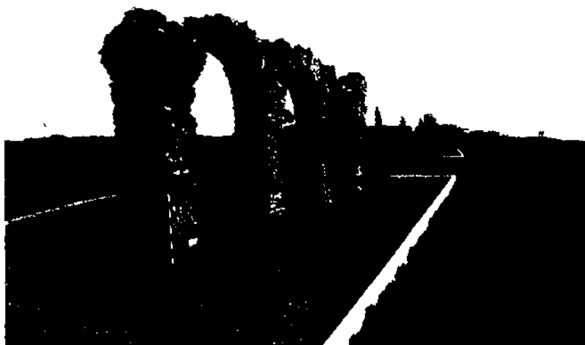
Exemple de rehabilitació i acondicionament amb l'entorn. Aqüeducte romà de Sant Jaume dels Domenys (Baix Penedès).

Sortosament, les restes de l'aqüeducte romà de Sant Jaume dels Domenys sí que varen rebre els treballs de consolidació necessaris, a més de l'adequació d'un espai per a la seva visita.