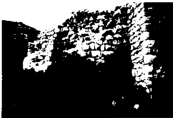
Tres aspectes de l'abandonament i deteriorament del Castell de Garraf (Sitges, Garraf).