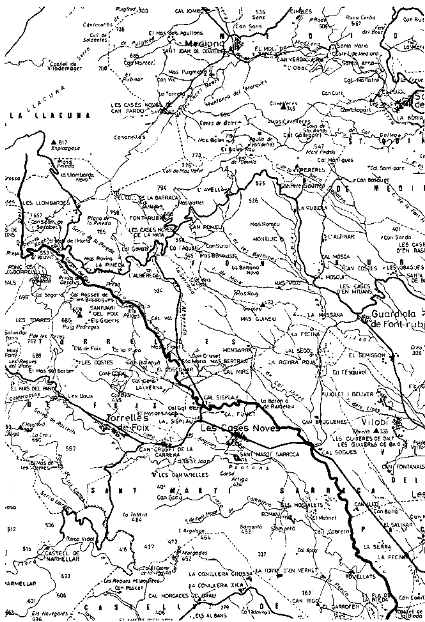
Itinerari general - Sector nord.