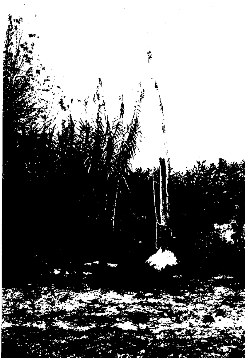
Grua a la riba del Foix en terme de Santa Margarida i els Monjos, lloc on predominen les hortes.