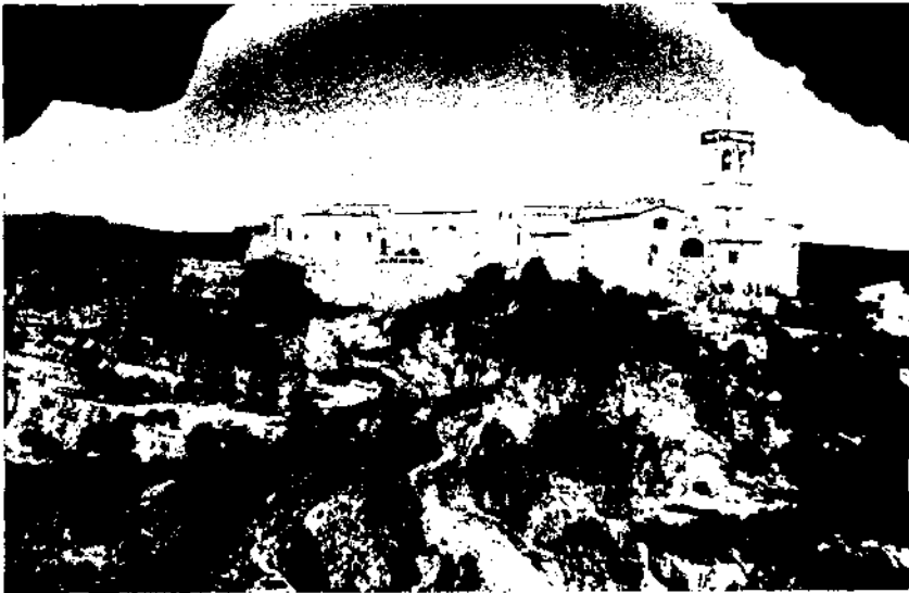
Castell de Sant Martí Sarroca situat sobre la riera de Pontons, afluent del riu de Foix.

Per arribar a Sant Martí, hem creuat dos afluents més del Foix, la riera de Pontons i la de Comalera , ambdues a la dreta del riu.