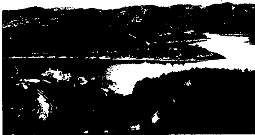
Meandres del riu de Foix al sector del pantà de Castellet.