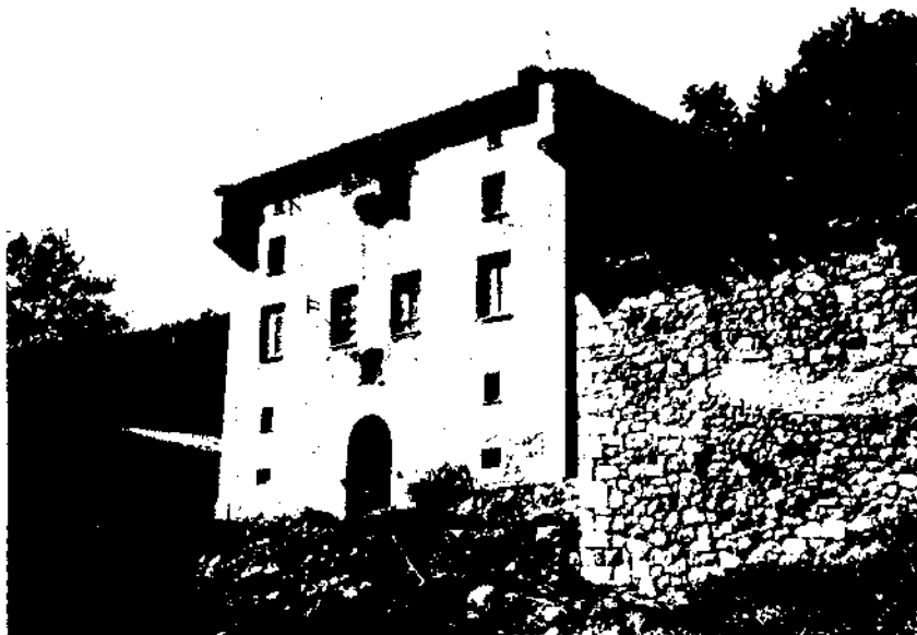
El mas de Pontons, a la capçalera del Foix (foto arxiu Joan Virella-1968).

En baixar del castell, tornem a sortir a la carretera, i agafem un camí, a la dreta, que ens porta a la baronia de Riudefoix , antiga masia i església.