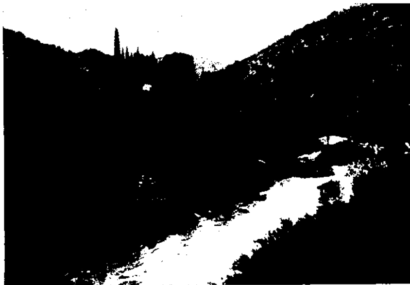
El riu Foix al seu pas per l'ermita de Lourdes.