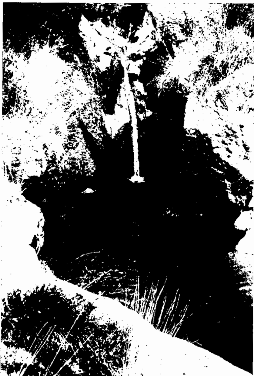
El Pètag Gran de les Dous de Torrelles de Foix (foto arxiu Joan Virella-1973).