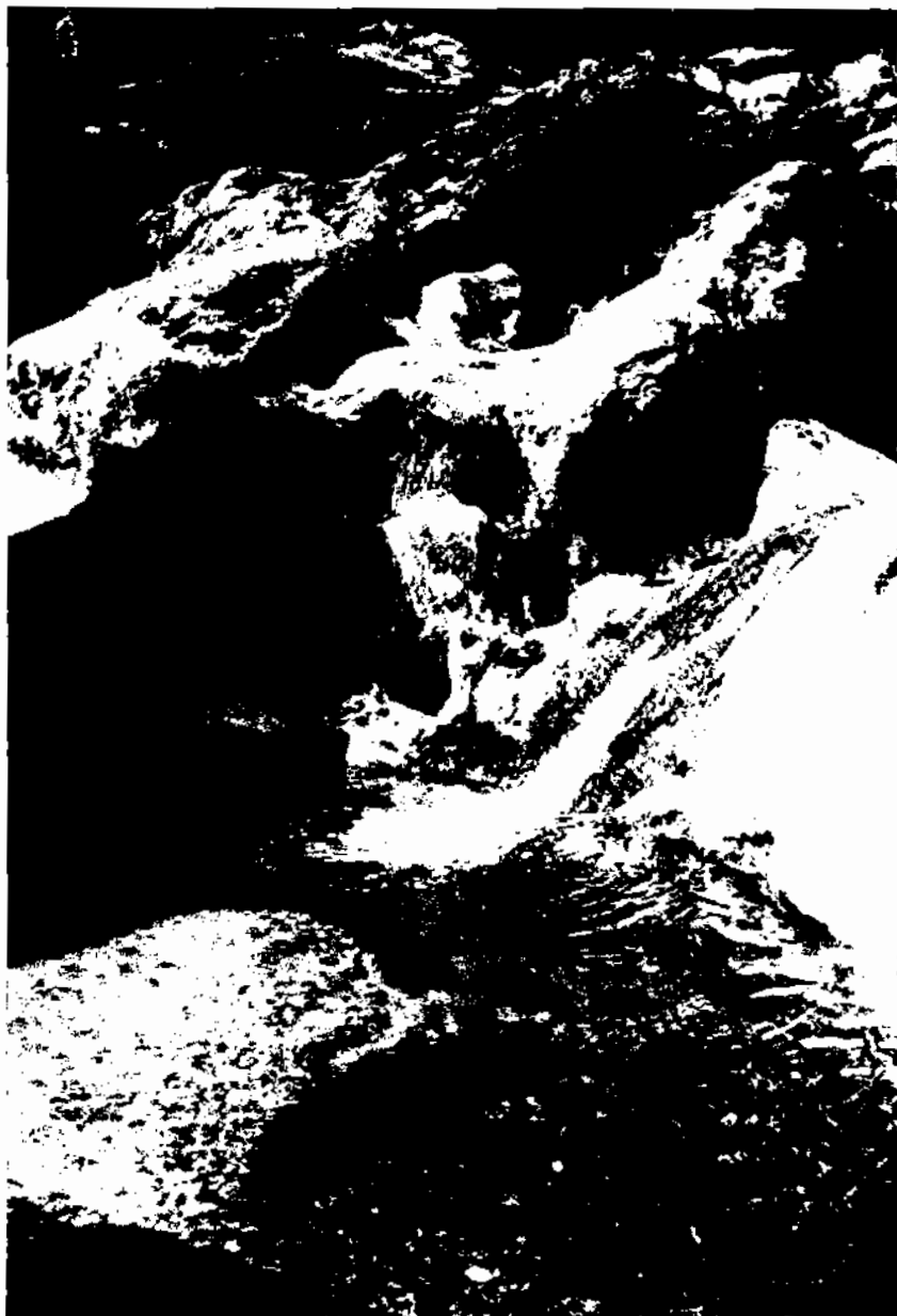
Un altre aspecte de les Dous de Torrelles de Foix.