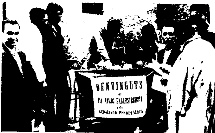
1932. Gelida. Recepció.