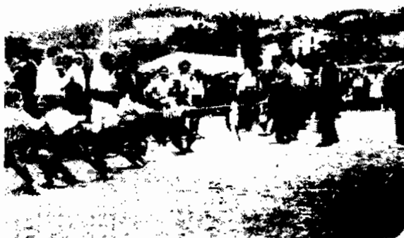
Lluita a la corda