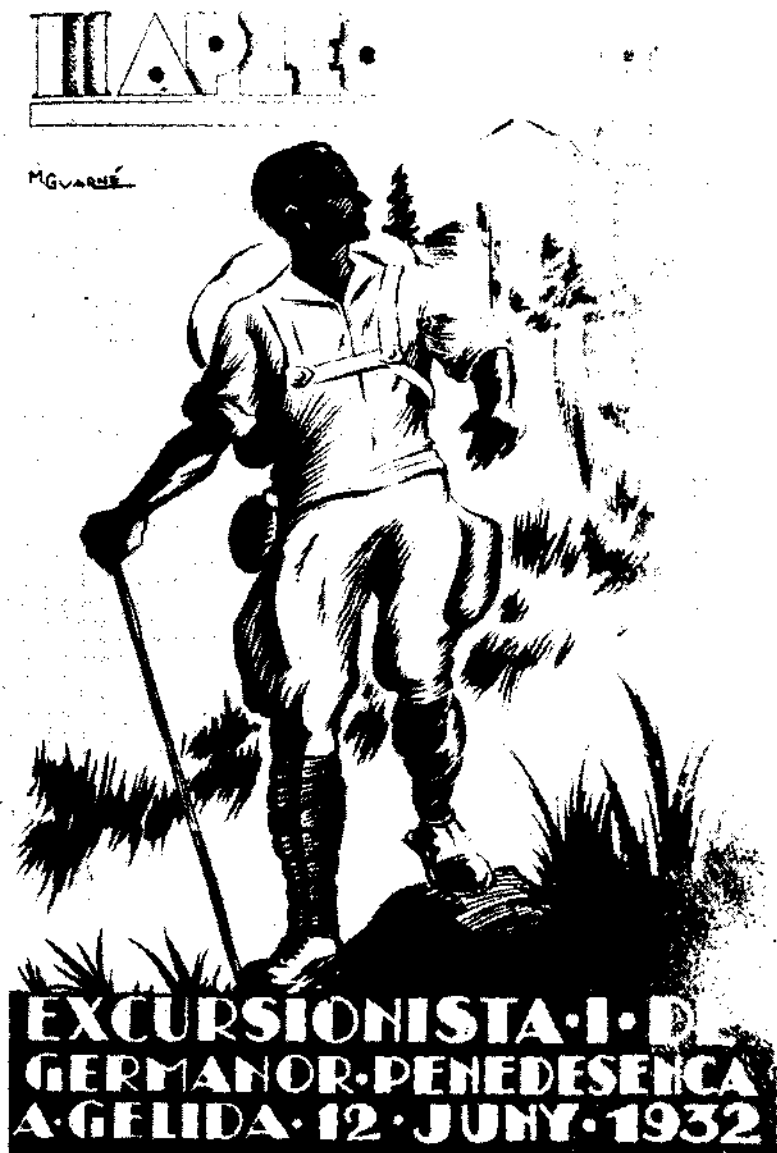
Portada del programa de l'Aplec celebrat a Gelida el 1932, original de l'artista M. Guarné, s'inscriu dintre els millors corrents grafistes d'aquell moment.