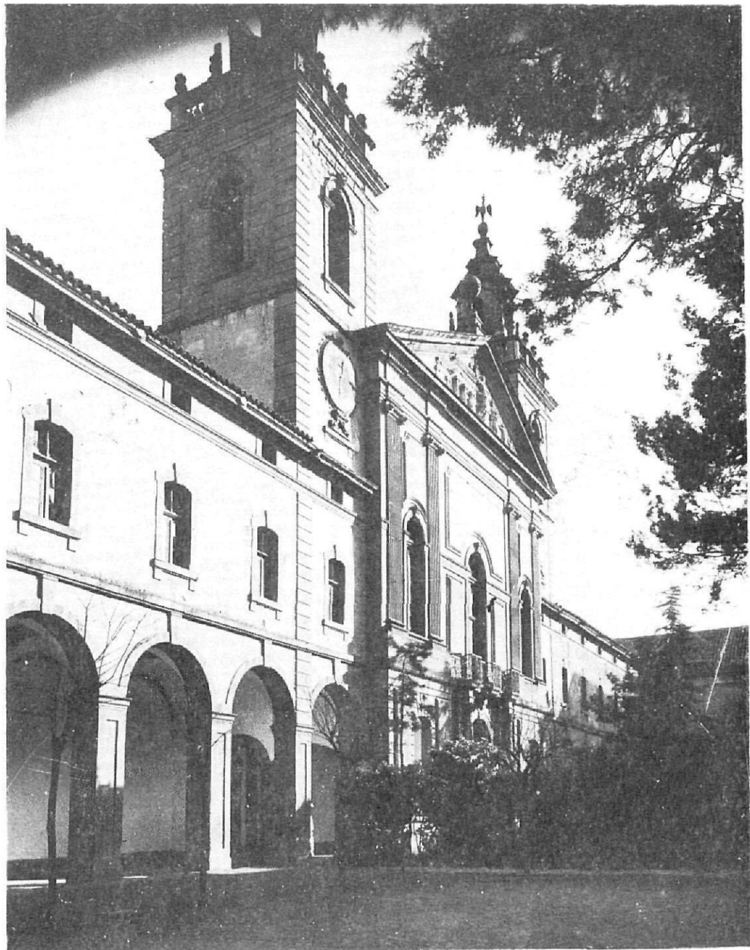
Façana interior al pati gran de la Universitat.