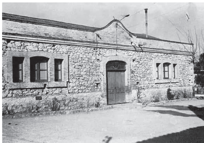
Figura 5. L'edifici de les escoles tal com va ser construït

Podem comprovar que aquestes premisses són seguides, i veiem la mateixa factura de la construcció de les escoles en la d'algunes cases del poble aixecades en el mateix període i probablement obra del mateix constructor. Cal Sebio, al número 1 del carrer de la Bassa, obra del 1931, el garatge de la mateixa casa, al número 6 del carrer de la Bassa del Pi, cal Pere Mateu, al carrer Major, número 32, i també la part de l'edifici de la Cooperativa que corresponia a l'antic molí del Poquet. El material i l'estil és sempre el mateix, pedra del país lligada amb argamassa a l'exterior amb parets interiors enguixades, voltes de les portes, de les finestres i les rematades arquitectòniques construïdes amb maonet cuit. La teulada a doble vessant amb teula àrab. L'orientació de les cases esmentades la marcava l'orientació del carrer on se situen, però les escoles es construïren orientades al sud-est amb grans finestrals per totes les façanes que donen a l'exterior. L'interior era una planta pràcticament simètrica dividida en dues aules i un espai mitjancer entre aquestes.