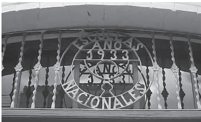
Figura 4. Forjat obra de Pau Cubells Franch

El 4 de març de 1933 s'acordà la data en què es començarien pròpiament les obres de construcció de les escoles. Seria l'1 d'abril, i aquest és el seu nom actual: Escola 1 d'Abril. Es nomenà l'encarregat dels peons que "deberán trabajar en la obra". Va ser el regidor "José Filella Ciuraneta" de cal Julià, l'Agnasi , i el paleta, el mestre d'obra que la construïria: "José Alberich Cubells, el Pausant ".