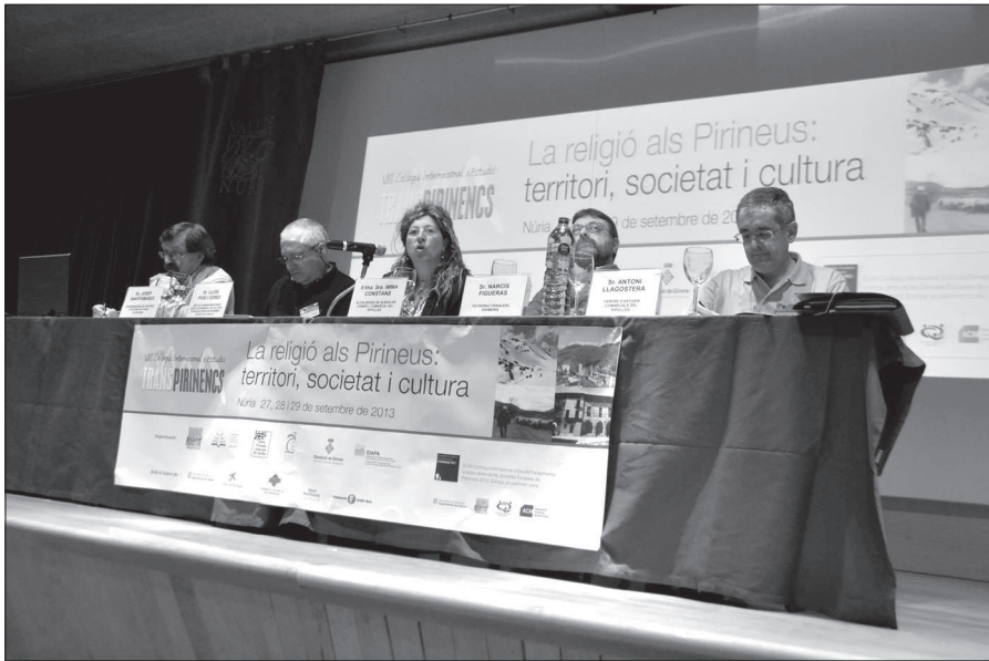
Fig. 6. Celebració del Col·loqui Internacional d'Estudis Transpirinencs a Núria.