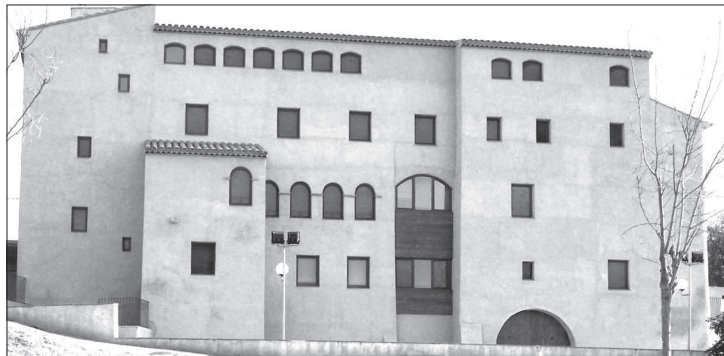
Fig. 1. Imatge del Mas de la Coixa, seu de l'Institut Ramon Muntaner.

L'Institut Ramon Muntaner. Fundació Privada dels Centres d'Estudis de Parla Catalana es va constituir el 3 de juliol de 2003 i té la seva seu al Mas de la Coixa de Móra la Nova (fig. 1).