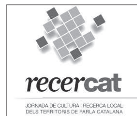
Fig. 3. Logotip del Recercat

Dels projectes de recerca que ha articulat en destaquem: els Jocs en la Història (fig. 4) i l'Inventari del Patrimoni Festiu de Catalunya. El projecte dels Jocs en la Història s'ha articulat en 5 anys, del 2008 al 2012. Té els seus orígens en dues primeres jornades celebrades en el context de la FESCAT de Jocs Tradicionals d'Horta de Sant Joan organitzada des del Departament de Cultura. Es va concretar en quatre jornades itinerants, Tàrrrega, Tarragona, Figueres i Berga i un congrés internacional a Móra la Nova i Ascó. Els treballs de totes les jornades i del congrés han estat editats, amb la qual cosa s'ha aconseguit una col·lecció de referència vinculada al joc i els esports tradicionals. Per altra