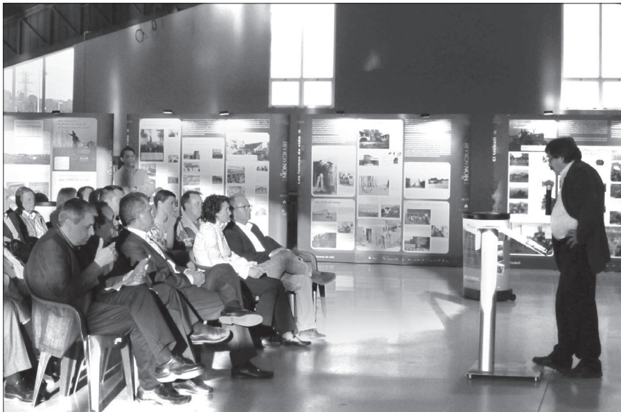
Fig. 8. Participació de l'IRMU a la Fira Agrícola, Ramadera i Industrial de Móra la Nova.