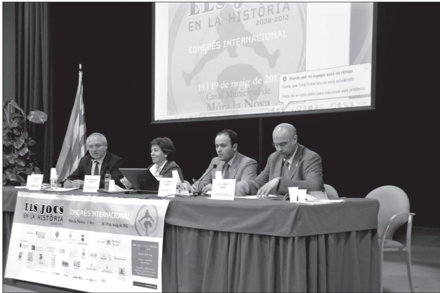
Fig. 4. Celebració del Congrés Internacional Els Jocs en la Història a Móra la Nova.

banda, l'Inventari del Patrimoni Festiu de Catalunya ha estat realitzat en col·laboració amb la Direcció General de Cultura Popular, Associacionisme i Acció Culturals i gràcies a la participació de centres d'estudis i investigadors de totes les comarques de Catalunya. En total s'han recollit entorn a 10.500 festes que en breu podran ser consultades en un espai web creat pel Departament de Cultura.