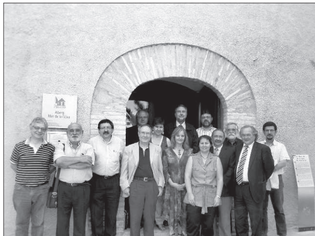
Fig. 2. Reunió de patronat de juny de 2011. Fons IRMU

L'Institut Ramon Muntaner actualment té localitzats i interactua amb al voltant de 400 centres, instituts d'estudis i associacions de recerca local i comarcal del conjunt dels territoris de parla catalana. D'aquestes entitats 305 estan registrades i aporten informació al portal www.irmu.org : 264 de Catalunya, 5 de la Franja, 22 del País Valencià, 3 de la Catalunya del Nord, 7 de les Illes Balears, 2 de l'Alguer, 1 d'Andorra i 1 d'Alemanya. L'estudi estadístic realitzat pel Departament de Cultura de la Generalitat de Catalunya l'any 2007 xifrava en 45.000 les persones vinculades a aquestes entitats a Catalunya. 3