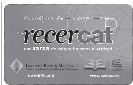
Fig. 5. Carnet Recercat

Pensant en les persones que integren la base de les entitats, s'ha creat el Carnet Recercat (fig. 5), que serveix per identificar el col·lectiu i els centres i els seus associats, però a la vegada, per oferir avantatges a les persones sòcies o vinculades als centres, principalment del món de la cultura. Els avantatges es poden consultar a http://www.irmu.org/base/booklet .