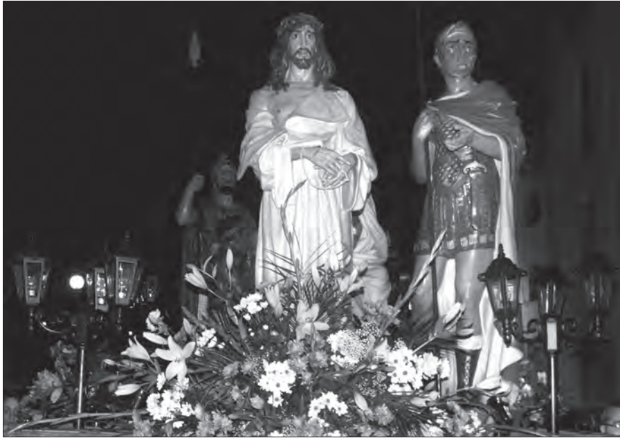
Fig. 5. Jesús al Pretori

Es van localitzar les imatges el 1999 i des de llavors es començà la restauració i el bastiment del pas.