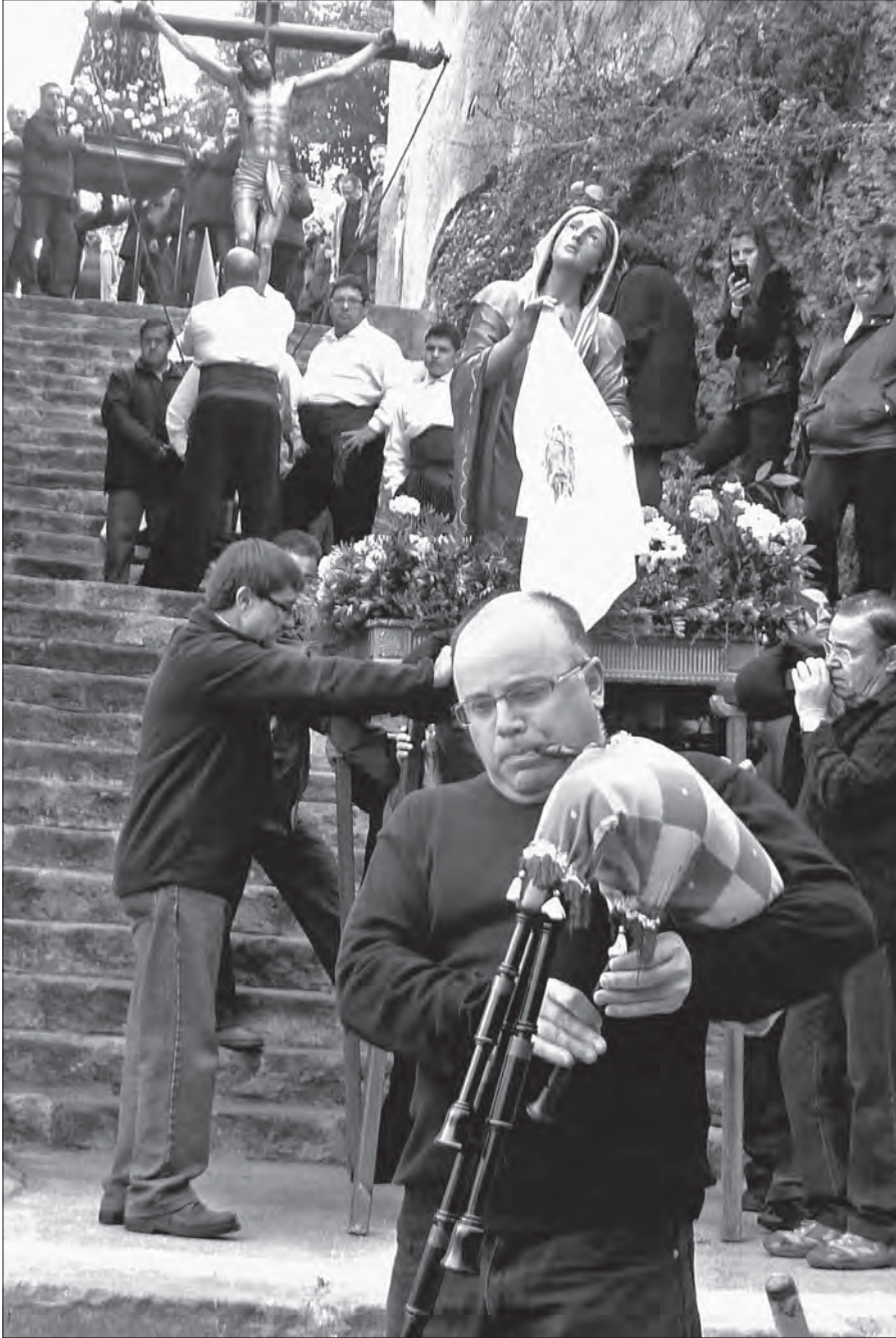
Fig. 4. Viacrucis (M. Cinta Farnós, 2012)