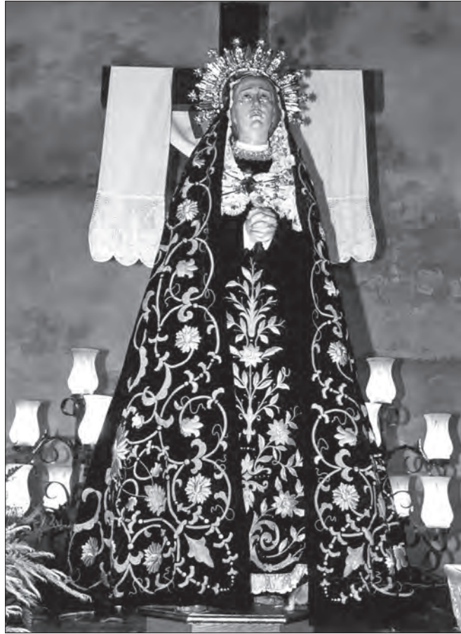
Fig. 9. Dolorosa