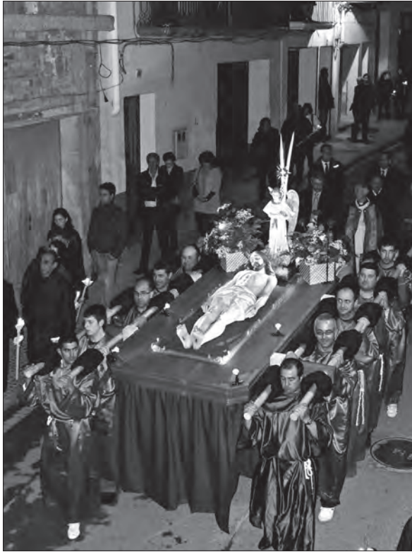
Fig. 8. Llitera