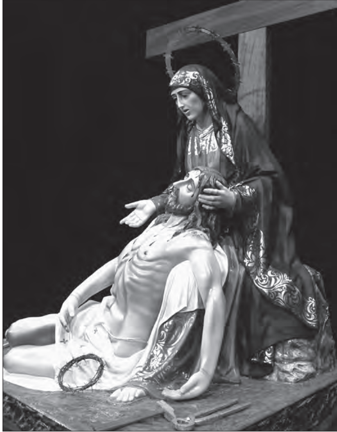
Fig. 7. Pietat

Observacions. La peça es va fer el 2010 amb motiu del bastiment del nou pas del Sant Sepulcre. Desfila al davant del pas portat per una dona.