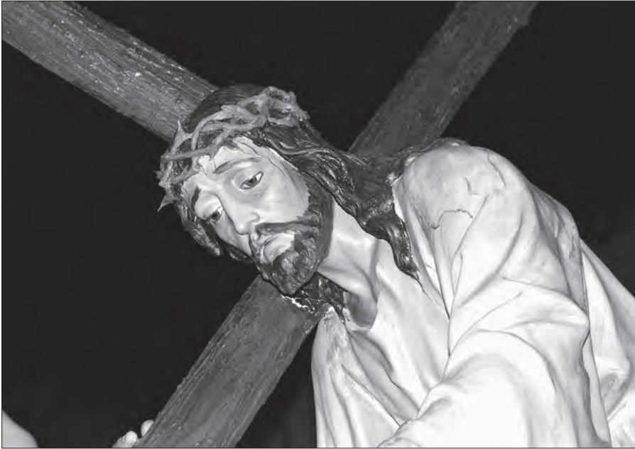
Fig. 6. Jesús amb la creu al coll

Propietat. Totes les imatges les comprà la confraria del Santo Cristo de los Cavalleros el 1941.