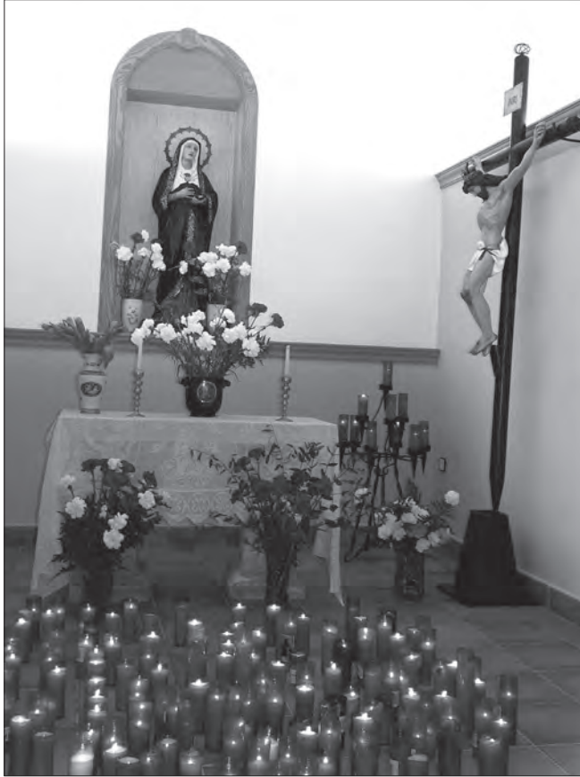
Fig. 1. Ermita del Calvari