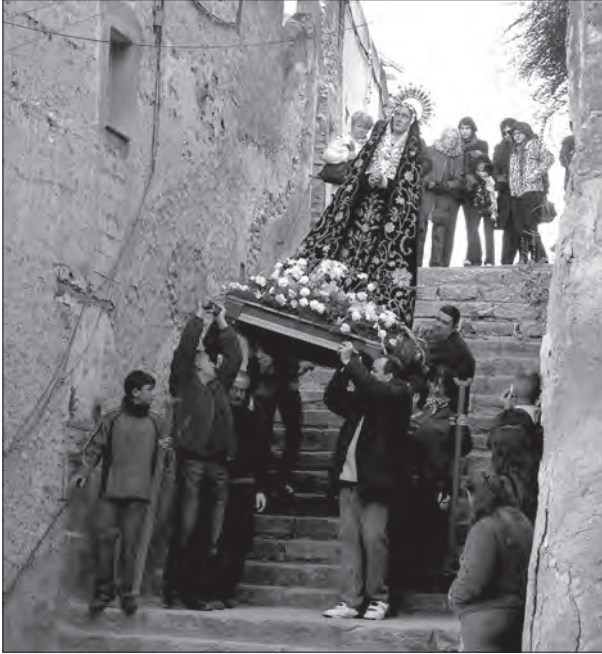
Fig. 2. Baixada de les escales durant el Viacrucis, 2010