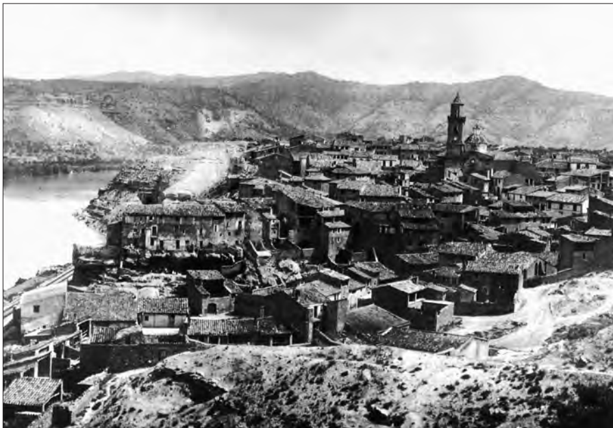
Fig. 1. Vista general de Riba-roja a començaments de segle XX (fons documental del Grup Reculls)

En ço que el senyor Abegar estigué encertadíssim fou de remarcar la poca sort que els riba-rojans han tingut en aconseguir del Govern vies de comunicació, fa constar i amb molta raó com no hi ha dret que en ple segle xx estigui una població com aquesta sense un pam de carretera sempre més quan la distància a Flix és tan curta i el dispendi en la construcció de tan desitjada carretera és relativament tan mesquí.