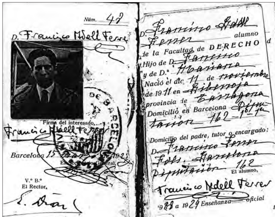
Fig. 2. Carnet de Francesc Adell del 1929 com a estudiant de la facultat de dret de la Universitat de Barcelona