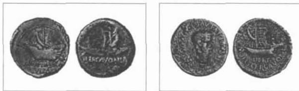
Fig. 4. Monedes d'Hibera Iulia Ilercavonia i de Dertosa Ilercavonia

Aquest fragment de l'obra de Livi ens indica el nom de l'única ciutat, suposadament ilercavona, que abraçaria la causa romana. Si aquesta associació es produí lliurement o per conquesta és una cosa que no sabem, però si considerem la seva possible ubicació dins de la regió ilercavona, hem de pensar que o bé els romans n'haurien forçat d'alguna manera l'aliança, o bé, i malgrat la unió ètnica dels ilercavons, no existia un lligam polític prou estable entre ells, ja que aquests, tal i com es desprèn dels textos dels clàssics, eren majoritàriament filopúnics. És així que hem de pensar que en aquest moment l'estat de la qüestió ha variat sensiblement al territori ilercavó: els romans, que fins ara havien demostrat certa incapacitat per instal·lar-se definitivament al sud de l'Ebre, en retornar sempre a hivernar a Tarraco, comencen a tenir aliats en aquesta àrea —cas d'Intibili o Intibilis—, nucli que es mantindrà habitat posteriorment als esdeveniments bèl·lics, fins època romana, tal com es desprèn de les indicacions de l'itinerari d'Antoní i de l'Anònim de Ravenna.