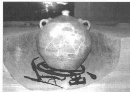
Fig. 2. Exemple d'urna funerària amb part de l'aixovar, on s'hi observa la presència d'un soliferreum, una punta i un regatí de llança, i altres elements metàl·lics dipositats al seu voltant (Museu Comarcal del Montsià)