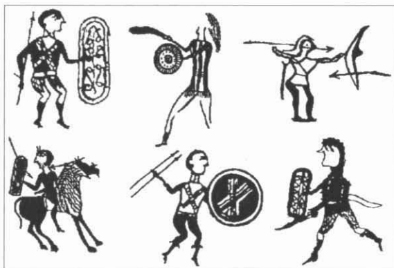
Fig. 1. Als dibuixos de la il·lustració, emprats originalment com a part dels elements decoratius de diversos recipients ceràmics provinents de l'àrea lleuantina (Llíria), apareix representat perfectament l'armament utilitzat pels guerrers ibèrics: llances, arcs, espases (falcata), escuts, etc., així com part del seu abillament habitual

Respecte a la panòplia ofensiva/defensiva ibèrica, gràcies a l'arqueologia s'han pogut recuperar algunes de les principals armes emprades per aquests pobles peninsulars, sobretot en tombes, ja que els habitants de l'antiga Ibèria s'enterraven amb les seves pertinences més preuades, entre les quals hi havia les armes. Una altra informació l'han proporcionat les pintures sobre ceràmica i l'estatuària; d'aquesta manera s'ha pogut reconstruir en gran mesura la imatge del guerrer ibèric. És així que sabem com durant el segle v a.n.e. la indumentària militar va sofrir una evolució, ja que en un primer moment els nobles ibèrics portaven una llança llarga amb punta de ferro i virolla, ideal per poder-la utilitzar malgrat que es trenqués; en alguns casos, un altre tipus de llança més curta, tota metàl·lica, el soliferreum , punyal i espasa; la coneguda i temuda falcata , espasa corba de doble fil amb punta; escut, rodó ( caetra ) o rectangular, amb els angles arrodonits, i, també per a la defensa, casc, cuirassa (rodona, lligada al pit) i grebes o gamberes, mentre que a partir del segle iv a.n.e. el soliferreum es generalitza encara més i desapareix, o almenys així sembla que es desprèn de la recerca arqueològica, l'armament defensiu de bronze. S'ha de destacar també l'ús d'arcs i fletxes o de la fona, i ressaltar el paper dels foners baleàrics en diversos conflictes bèl·lics (fig. 1).