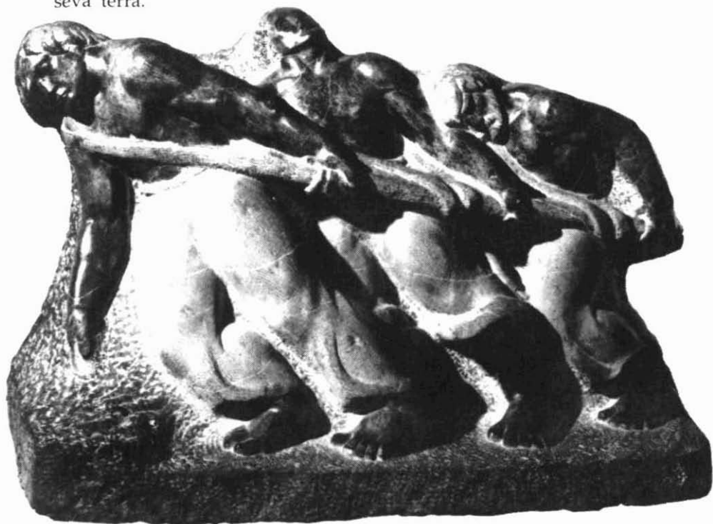
"Els sirgadors". Pedra calcària. Museu d'Art Modern, Tarragona

Però, on realment es pot gaudir de l'extraordinària obra de Santiago Costa és al Museu d'Art Modern de Tarragona, institució a la qual va cedir la totalitat de les seves obres, quan, a l'any 1983 va tornar a la seva terra.