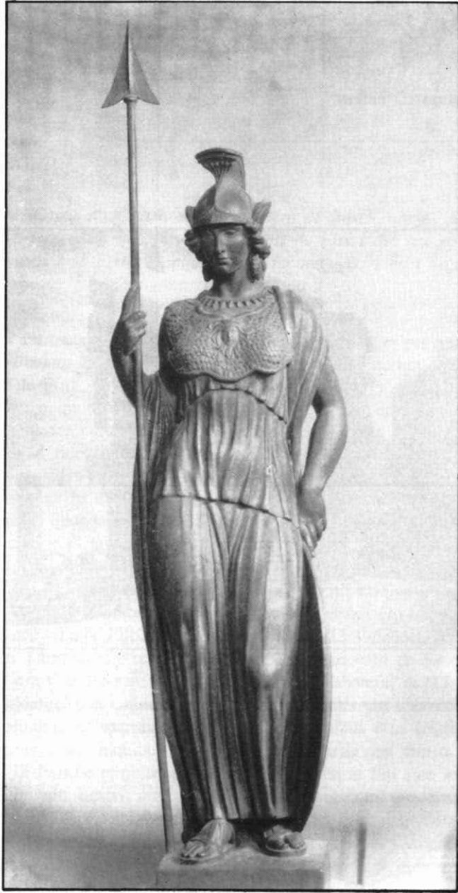
"MINERVA". Bronze. 1.925. Museu d'Art Modern Tarragona.