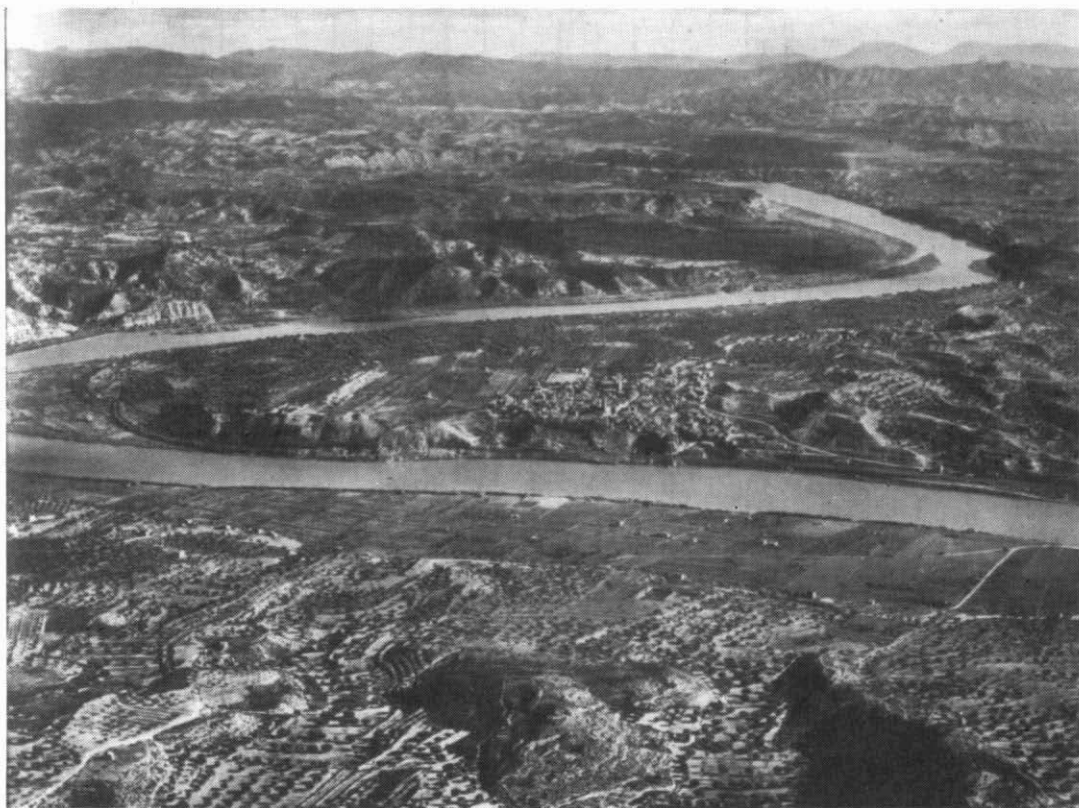
La propietat dels béns eclesiàstics a la Ribera passà a mans de terratinents de la comarca, majoritàriament. A la foto, terres de Riba-roja.