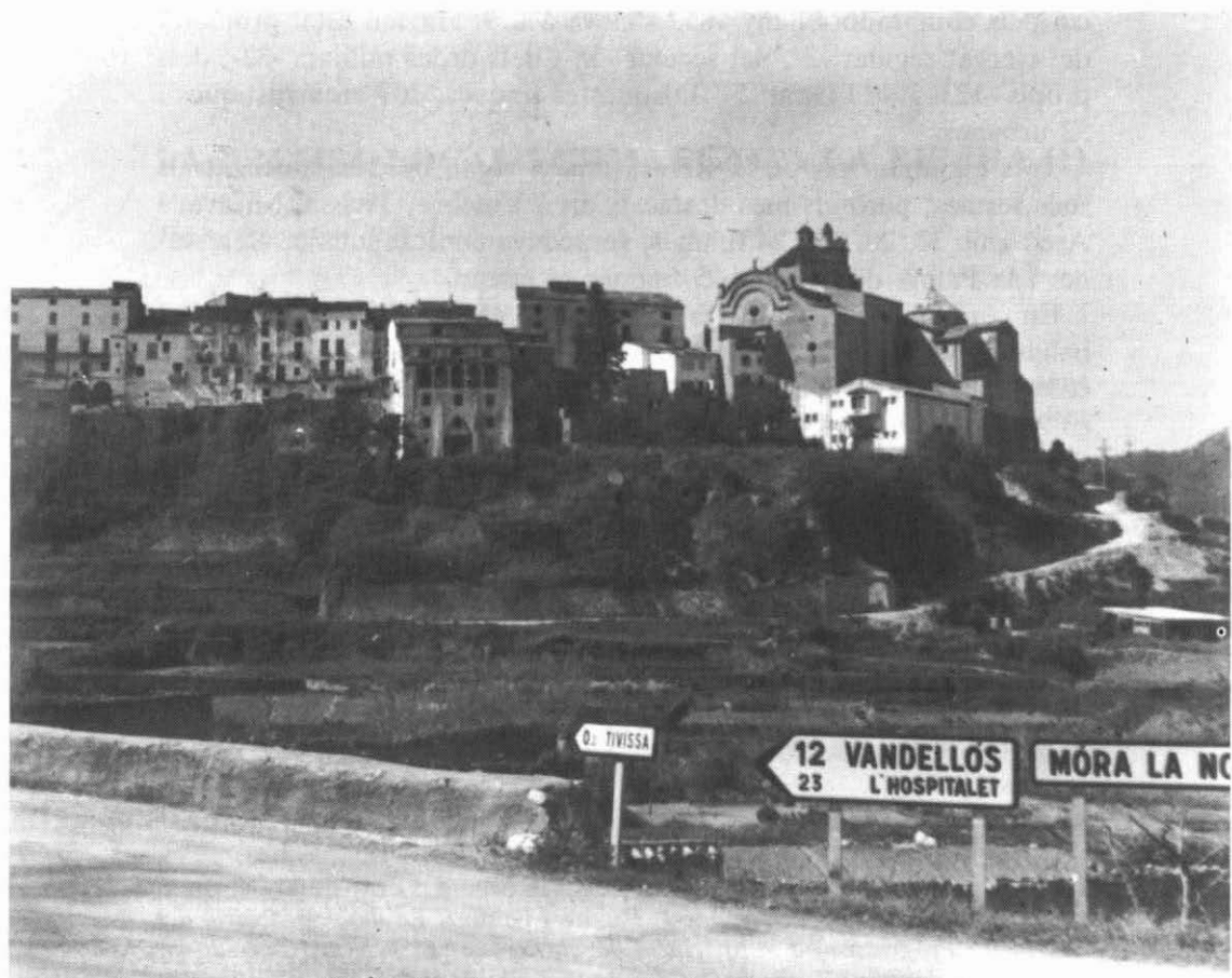
La importància de la desamortització a la comarca fou menor, en relació a altres comarques veïnes. A la foto, Tivissa.