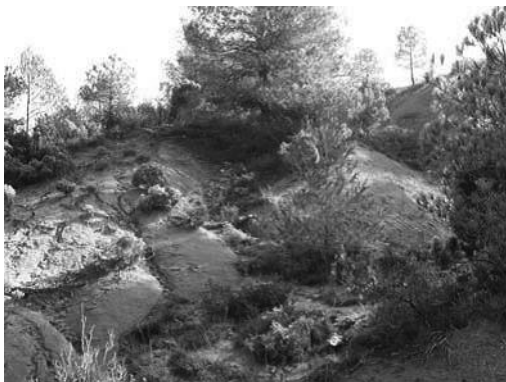
Figura 1 i 2. Formació de sílex entre les margues grises de Cal Tomàs i sílex procedent de l'aflorament. Font: B. Gómez de Soler: Áreas de captación y estrategias... , op. cit., p. 25.

Les roques silícies també es localitzen en posició secundària a l'entorn de Tous en el tram del torrent de Tous que discorre a prop d'una de les formacions primàries denominada El Mas. Des del seu naixement fins a l'altura del municipi es localitzen nivells de l'antiga terrassa del torrent on es va