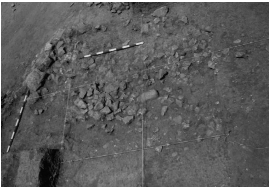
Figura 6. Sòl d'ocupació amb l'empedrat i el fogar delimitat (nivell IIIb) dels Vilars de Tous.

lisi antracològica dels carbons va permetre determinar que s'haurien explotat rouredes i pins de l'entorn per tal d'utilitzar-los en la preparació del sòl i que, a mode d'hipòtesi de treball, haurien tingut la funció d'aïllar la humitat de l'estructura o evitar l'enfangament del nivell d'argiles. 15 El nivell d'utilització del sòl (IIIa) estava associat a un fogar construït a partir d'una cubeta excavada a la superfície i delimitada per un cercle de pedres. Aquest nivell d'ocupació també estava vinculat a un seguit de materials arqueològics com fragments de ceràmica a mà, molins de vaivé, fragments de des-trals polides i abundants restes de talla lítica. En darrer lloc, l'estructura hauria estat coberta per dos nivells posteriors de formació (I i II), el darrer dels quals també contenia abundant material arqueològic, en sobreposar-se al nivell IIIa d'utilització del sòl.