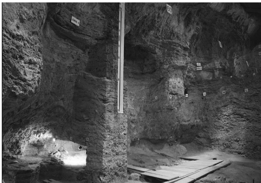
Figura 4. L'Abri Romaní de Capellades.

L'Abri Romaní representa una de les seqüències arqueològiques més completes de les ocupacions humanes durant el Paleolític a Catalunya, juntament amb els abrics i les coves del Pla de l'Estany. La sedimentació de l'abric va comportar la conservació d'una potència de 16,30 m composta per sèries sedimentàries de travertins, palustres, de caigudes de blocs i d'argiles i llims vermells. Les datacions per urani/tori i per radiocarboni emmarquen les ocupacions de l'Abri Romaní entre el 39.100 i els 60.000 anys