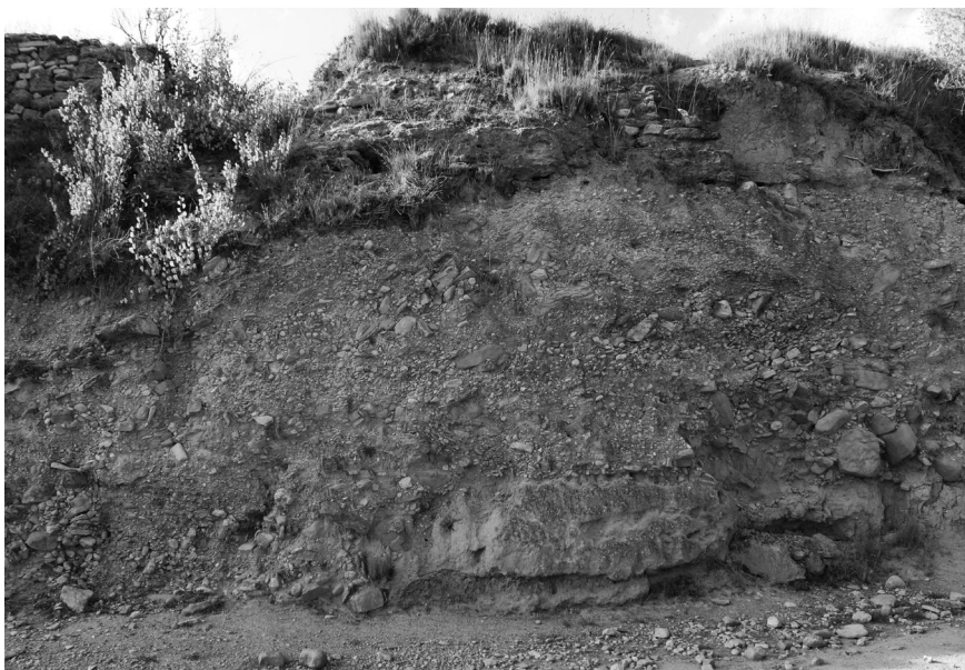
Figura 3. Terrassa fluvial del torrent de Tous.

Les evidències materials dels jaciments arqueològics de Tous amb restes abundants de talla lítica, juntament amb les investigacions que s'han desenvolupat en d'altres jaciments com l'Abric Romaní de Capellades, posen de manifest que els grups humans s'haurien aprovisionat d'aquest recurs i que l'haurien explotat al llarg de la prehistòria amb l'objectiu d'elaborar tot un seguit de mitjans de treball en funció de les seves necessitats naturals i socials.