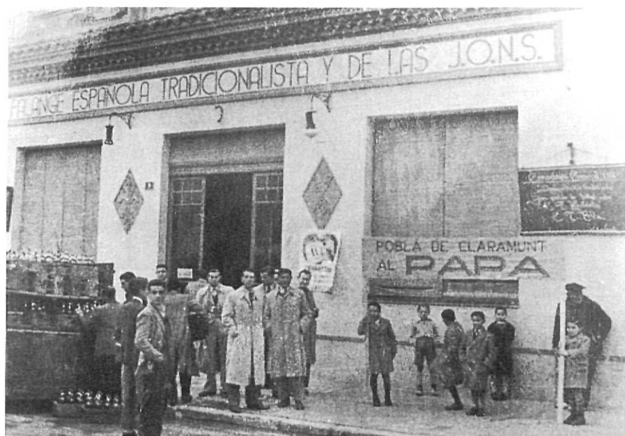
Retolació política del 1939 al 1975.

(Arxiu fotogràfic Municipal de la Pobla de Claramunt)