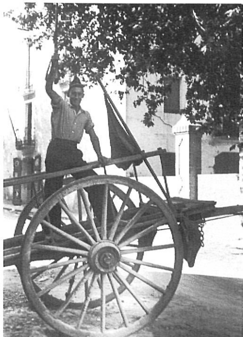
Juliol, 1936. Barricada amb carros.