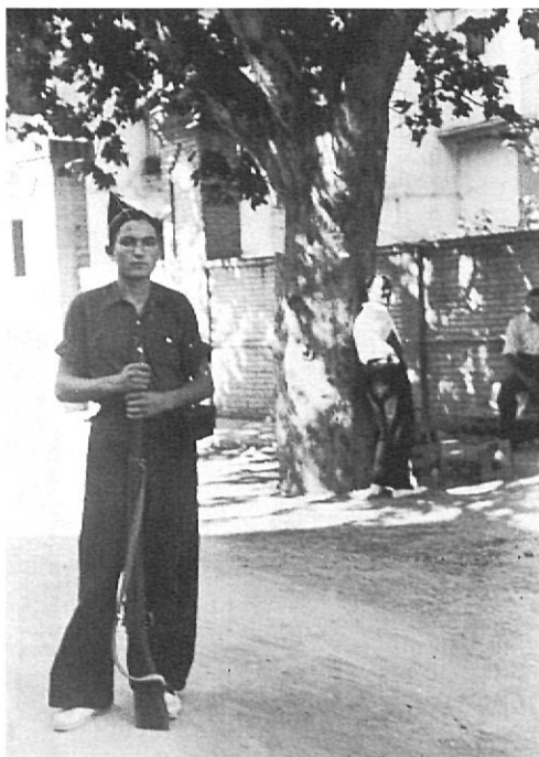
Juliol, 1936. Control de milicians locals armats.