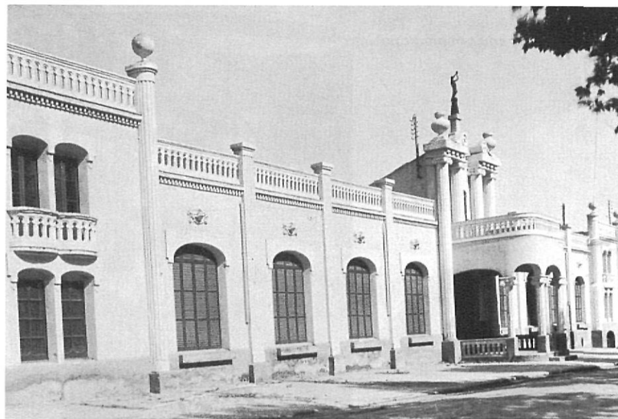
1939. Edifici del Casino.