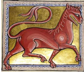
Mirabilia 31 (2020/2)