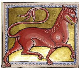
Mirabilia 31 (2020/2)