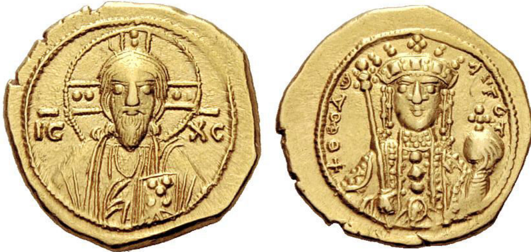
Sólido de la Emperatriz Teodora Augusta.