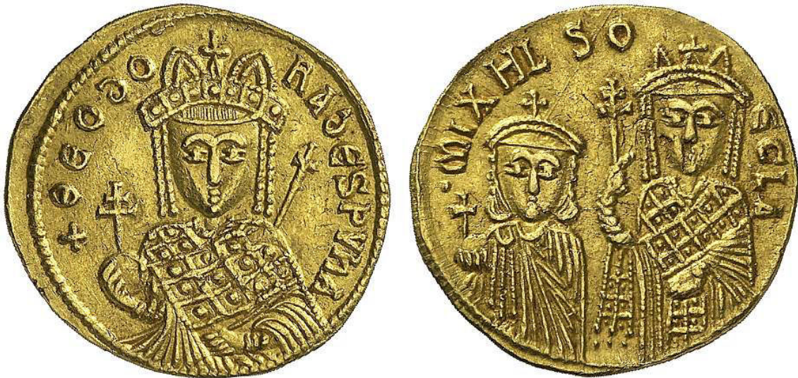
Sólido con la Regente Teodora, Miguel III y su hermana Tecla.

Como ejemplo de monedas donde aparecen las Emperatrices Regentes en todo su poder podemos ver las de Teodora, que gobernó en nombre de su hijo Miguel III (842-867), que tenía dos años al morir su padre Teófilo, ocupando la Emperatriz la Regencia (junto a un Consejo en el que también estaba Tecla, su hija mayor, y sus hermanos Bardas y Petronas). De este período son interesantes las primeras monedas, en las que aparece en anverso la emperatriz Teodora, gobernante efectiva