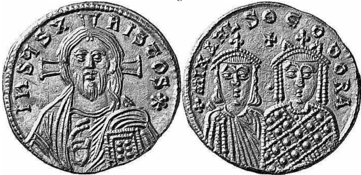
Sólido con la figura de Cristo, Miguel III y su madre Teodora.

Otro ejemplo es el de la Emperatriz Zoé Carbonopsina, amante de León VI, con quien tuvo un hijo, e inmediatamente se casó con ella y la coronó como Augusta (enero de 906), ante el asombro de la Iglesia y el pueblo, que habían aceptado legalizar la situación de su hijo (el futuro Constantino VII) pero no la de Zoé. Los problemas empiezan a la muerte de León VI (mayo 912). En teoría debían reinar juntos los coemperadores Alejandro (hermano de León VI) y Constantino VII, pero, dada la corta edad del segundo, su tío tomó todo el poder en sus manos y cambió totalmente el gobierno. Su muerte a los trece meses (junio 913) llevó a la Regencia del patriarca Nicolás, que fue nefasta y pronto tuvo que retirarse y entregar el poder a la madre del emperador, Zoé (febrero 914), que decidió crear un gobierno militar que quedó en manos del drungario Romano Lecapeno, convertido luego en Regente (marzo 919). Del período de gobierno de Zoé (914-919) tenemos monedas donde