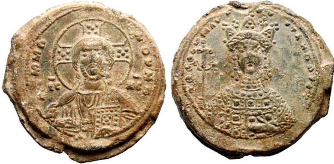
Sello de Plomo de la Emperatriz Teodora.

Un tercer tipo, en este caso de plata ( milliaresion ), muestra en el anverso la figura en actitud orante de la Virgen de Blaquernas ( Blachenitissa ), muy ligada a la familia imperial; mientras el reverso sólo aparece la leyenda en siete líneas, resaltando la ayuda que la Madre de Dios otorga a la Emperatriz Teodora Porfirogéneta, a quien da el título de despoina , mientras en el oro siempre aparece como Augusta. 49