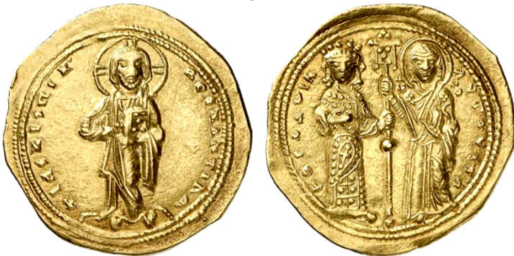
Sólido de la Emperatriz Teodora recibiendo el Labarum de la Virgen.