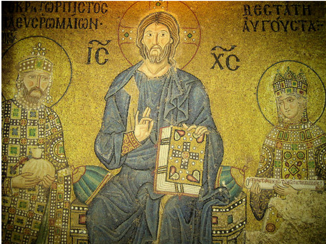
Mosaico de Santa Sofía de la Emperatriz Zoé y su marido.

Otro importante acontecimiento que ocurrió estos años fue la consolidación del Cisma de la Iglesia Ortodoxa. En 1054 el Patriarca de Constantinopla Miguel Cerulario se enfrentó al papa León IX poniendo el acento en las diferencias entre ambos ritos (uso de pan ácimo, celibato sacerdotal, normas litúrgicas) y, sobre todo, negando a Roma la primacía sobre Constantinopla. El conflicto terminó con la excomunión mutua (julio) entre los representantes papales y los del patriarca. Desde entonces la Iglesia Ortodoxa rompió toda vinculación con Roma.