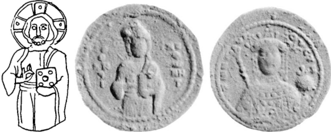
Sólido de la Emperatriz Zoé con el Cristo Antiphonetes.

Numismáticamente hablando estos tres días fueron muy importantes, existe una moneda única en el Museo Arqueológico de Estambul, que muestra en anverso la representación de medio cuerpo del Icono de Cristo denominado Antiphonetes 38 , que se encontraba en la iglesia de la Virgen de Chalkoprataia, y que era especialmente venerado por la emperatriz Zoé (tenía una copia del mismo y había fundado una iglesia bajo su advocación donde pensaba ser enterrada), y en reverso la imagen de Zoé revestida con las joyas y atributos imperiales, pudiendo ser considerada por tanto como su primera moneda de soberanía en solitario.