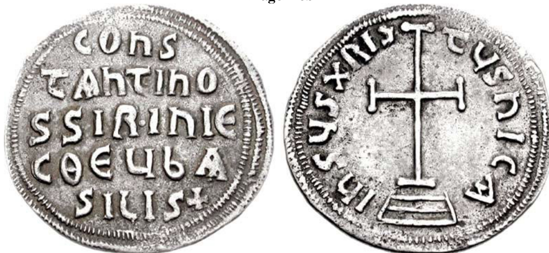
Fig. 8a y 8b. Sólido y Miliarensis de los Coemperadores Irene y Constantino VI.

Poco a poco Constantino VI fue perdiendo apoyos, debido a sus continuos errores de gobierno y por los escándalos de su vida personal. Irene se aprovechó de ello y, tras conseguir controlar al ejército, ordenó detener a su hijo. Constantino VI fue llevado a Palacio y allí le sacaron los ojos ante su madre (15 de agosto de 797), en la Pórfira (salón de la púrpura), donde había nacido 27 años antes, siendo exiliado a Prinkipo. Así acabó el gobierno de la dinastía Isauria. 33