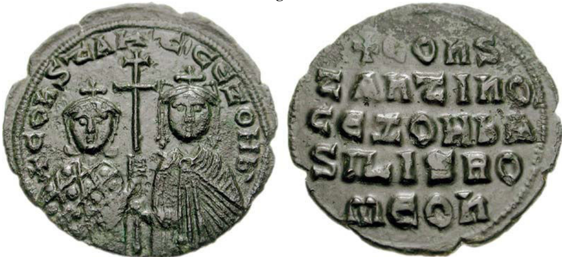
Bronce de Constantino VII y su madre Zoé.

Por último veremos el caso de Constantino X Ducas (1059-1067), que estaba casado con Eudoxia Makrembolitissa, sobrina del patriarca Miguel Cerulario, a quien nombró Augusta, y sus hijos mayores, Miguel y Constantino, fueron asociados al