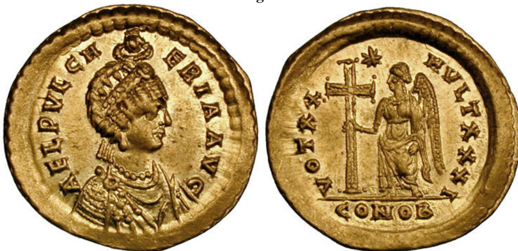
Sólido de Pulqueria (h.423-429)