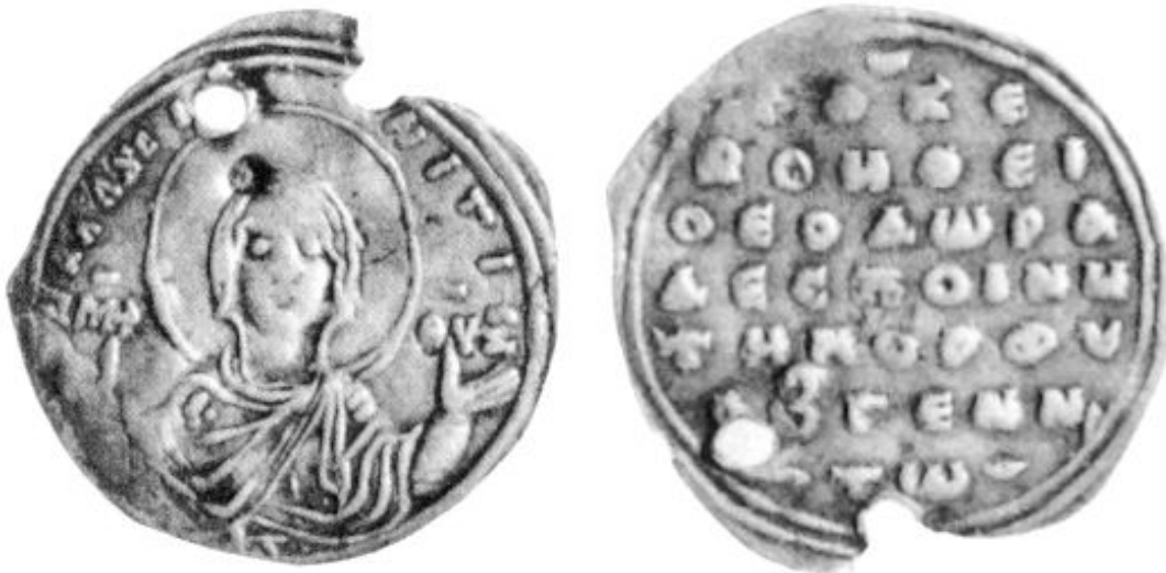
Milliaresion de la Emperatriz Teodora ( despoina ).