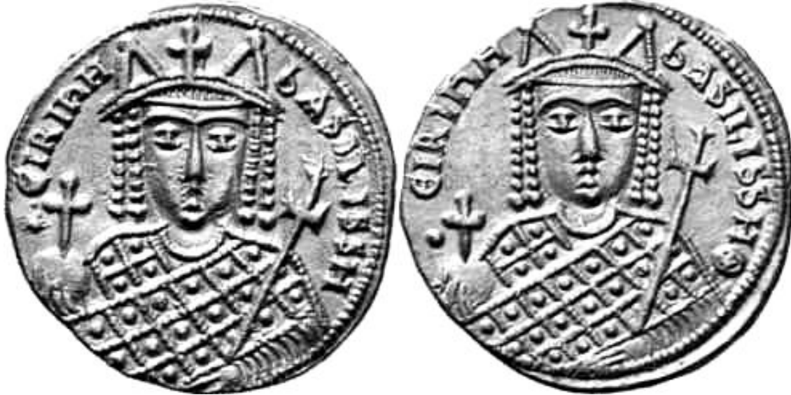
Sólido del Emperador Irene.

En conclusión, el gobierno de Irene supone un paso más en el camino de las mujeres hacia el trono de Bizancio. Por primera vez (aunque sea tras un golpe de estado) una mujer gobierna en su propio nombre, primero como coemperador y luego sola, aunque tenga que ejercer el poder con títulos masculinos, y es reconocida en todo el Imperio. E incluso después de su muerte es enterrada en el mausoleo reservado a los emperadores en la iglesia de los Santos Apóstoles de Constantinopla.