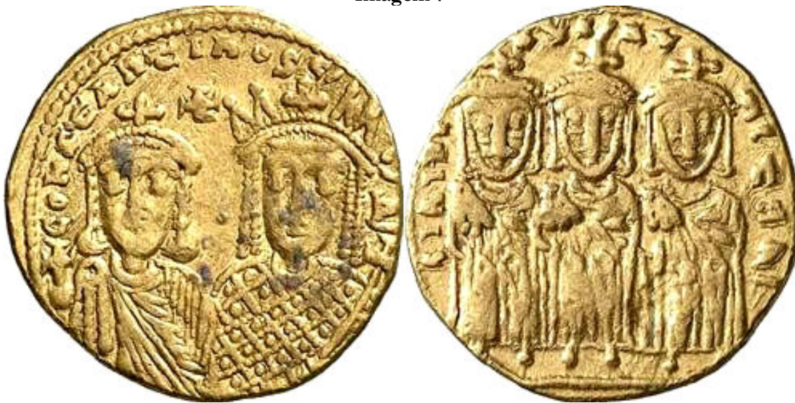
Sólido de la Regente Irene y Constantino VI

Los problemas surgieron cuando Irene se “excedió” en su regencia: por una parte consiguió que el VII Concilio Ecuménico, celebrado en Nicea (787), restableciera el culto de las imágenes suprimiendo todas las leyes iconoclastas 28 , quedando Constantino VI cada vez más relegado, a pesar de tener ya edad suficiente para gobernar sólo. Irene había triunfado, pero su poder seguía dependiendo legalmente de su hijo, a quien intentaba controlar e incluso limitar sus movimientos, y cuando este quiso empezar a gobernar por sí mismo ella le negó este derecho 29 , declarando