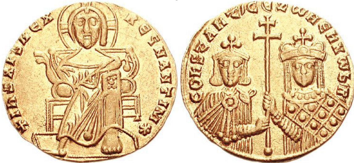
Sólido con la figura de Cristo, Constantino VII y su madre Zoé.