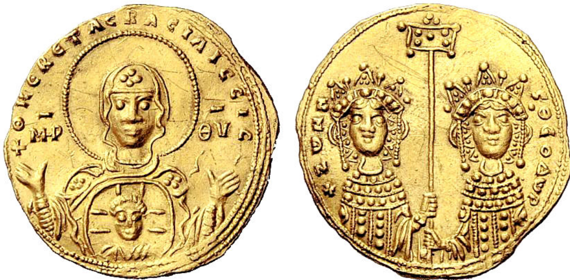
Sólido de las Emperatrices Zoé y Teodora.

Del período conjunto de gobierno de Zoé y Teodora en 1042 solo se conoce un tipo de moneda de oro. En él se deja claro la nueva situación política y de relación de poder: en el anverso aparece la Virgen de frente, con el Niño Jesús en su pecho, también de frente. Alrededor la leyenda asegura que el poder de la Virgen ayuda a las emperatrices y en el reverso se muestra la imagen de las dos hermanas, vestidas con traje de ceremonia, Zoé a la izquierda y Teodora a la derecha, ambas de frente y sosteniendo el labarum conjuntamente, mostrando así la cosoberanía. 42