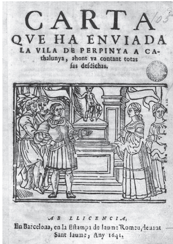
Carta que ha enviada la vila de Perpinyà a Catalunya. F. Bon. 105. Biblioteca de Catalunya, Barcelona.

Un dels plecs poètics de més valor literari que destaca per la mètrica regular, per la simbologia, per la ironia, per la barreja d'elements cultes i populars i per la portada amb elements de la naturalesa és Comparació de Catalunya —vegeu la segona il·lustració. Així com el poema, la il·lustració de la portada està elaborada amb detall. La il·lustració es divideix en dues parts que pertanyen a dos bàndols oposats, és a dir a Catalunya i a Castella—, a diferència de Carta que ha enviada , on les dues parts pertanyien