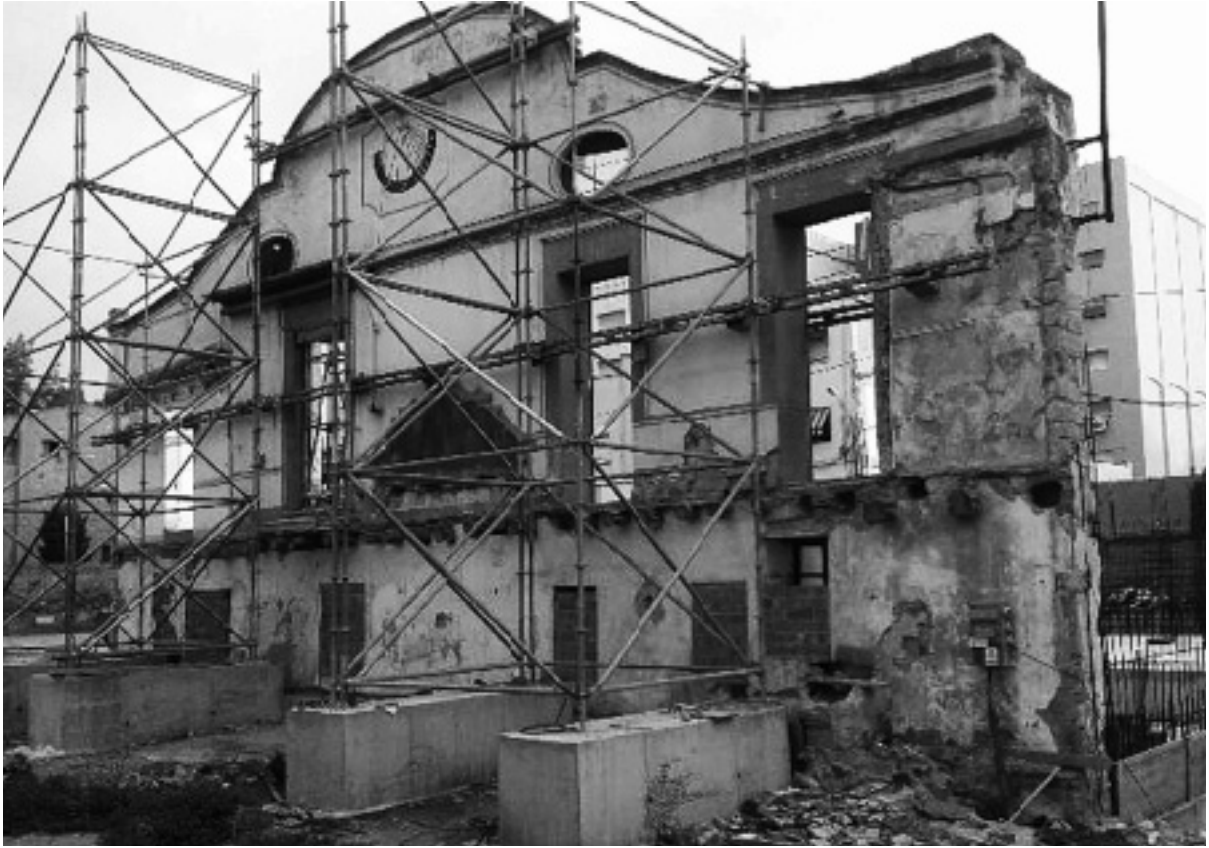
La masia catalogada de Can Fatjó ha estat enderrocada l'estiu de 2014, amb llicència municipal, deixant només dempeus la façana

Les 1.000 signatures recollides i la intervenció de l'Avenç va fer enrere el projecte constructiu a l'hora que s'endegava un procés per salvar l'entorn de la masia, amenaçat per la realització d'altres projectes d'obres.