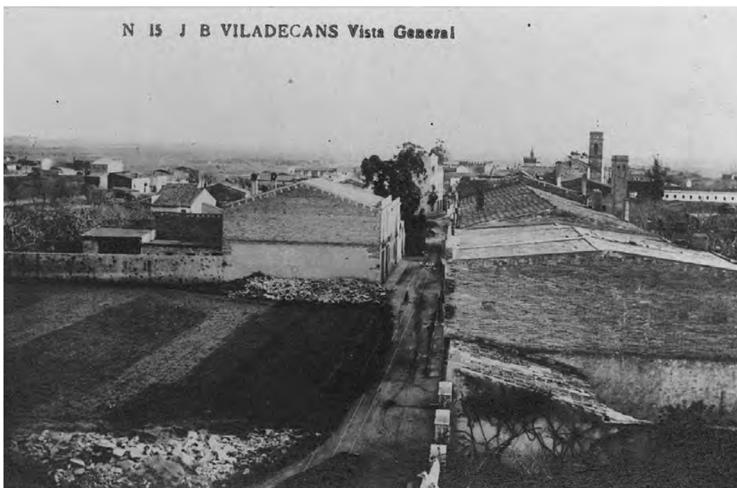
El carrer de la Muntanya de Viladecans, en una imatge d'inicis del segle xx.