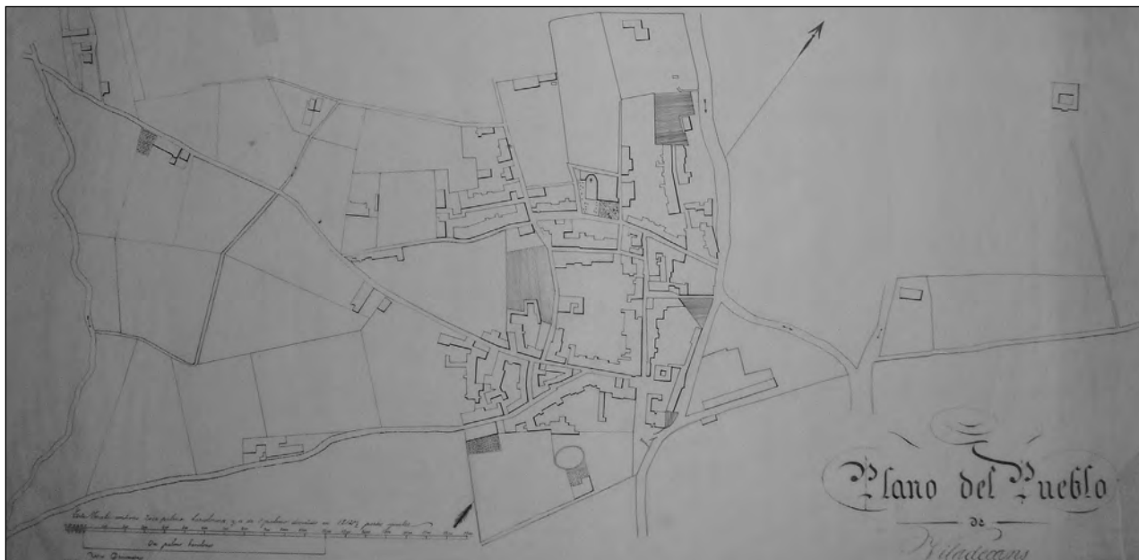
Plànol de la xarxa de carrers de Viladecans, 1852. AMVA, Fons Ajuntament de Viladecans.

relació de finques urbanes de la població datada l'any 1852 3 esmentava el carrer del Raval de l'Església, el carrer de les Canals, el carrer Major, el carrer de Sant Joan i el de la Riera de Sant Climent, conjuntament amb la plaça dels Traginers, el carrer de l'Estrella, el carrer de Balletbó, el carrer de Sant Isidre, el carrer del Sol, el de l'Estrella, el de la Poca Farina, el de Sant Marià, el de Sant Josep i la consideració urbana –per primer cop a la seva història– de la plaça de la Vila, anomenada, aleshores, plaça de la Constitució.