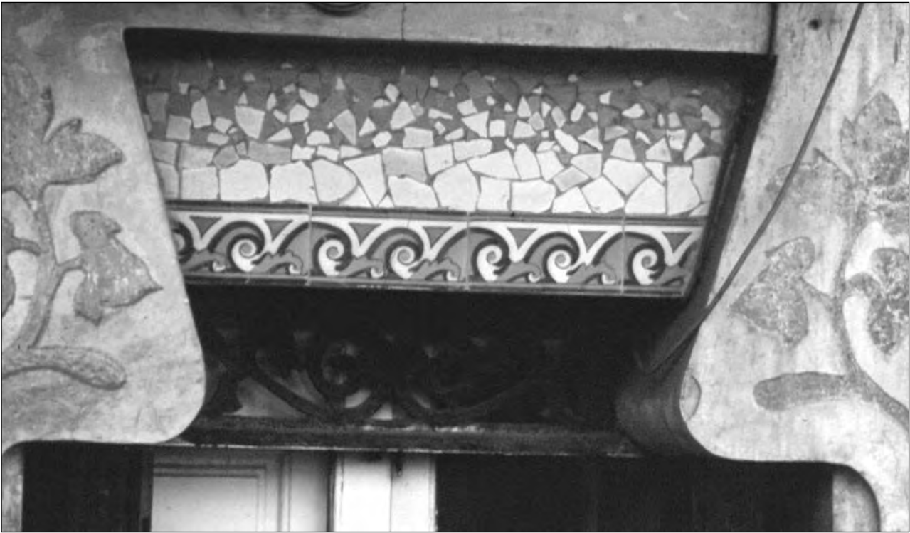
Detall del trencadís ceràmic i esgrafiats en una finestra de Can Tarragó, Molins de Rei.