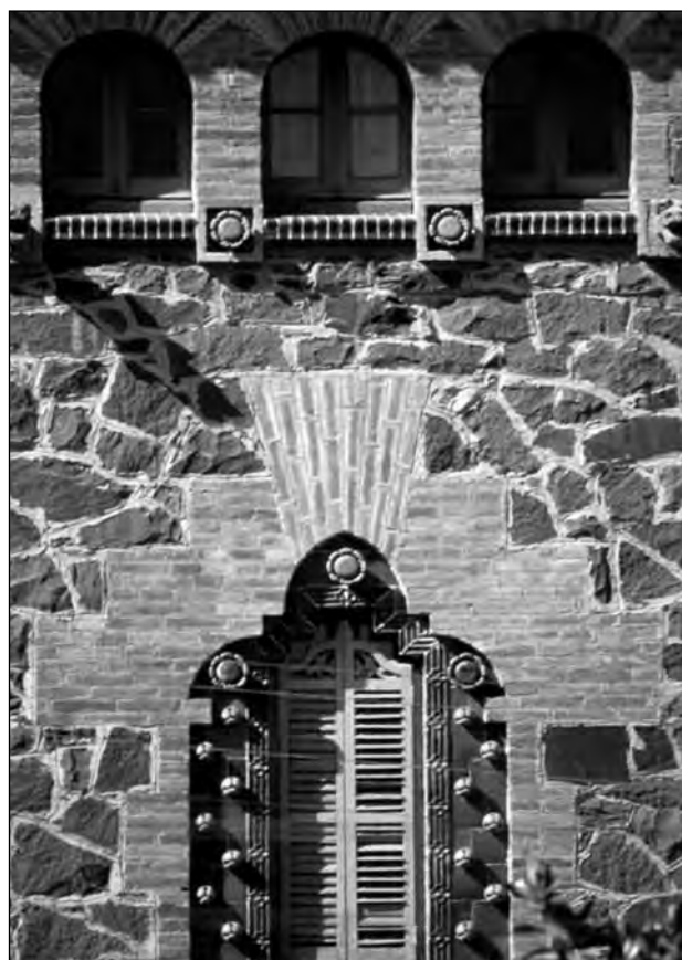
Detall d'una finestra i de la galeria de solana de la Granja Garcia. Antoni M. Gallissà, Cervelló.