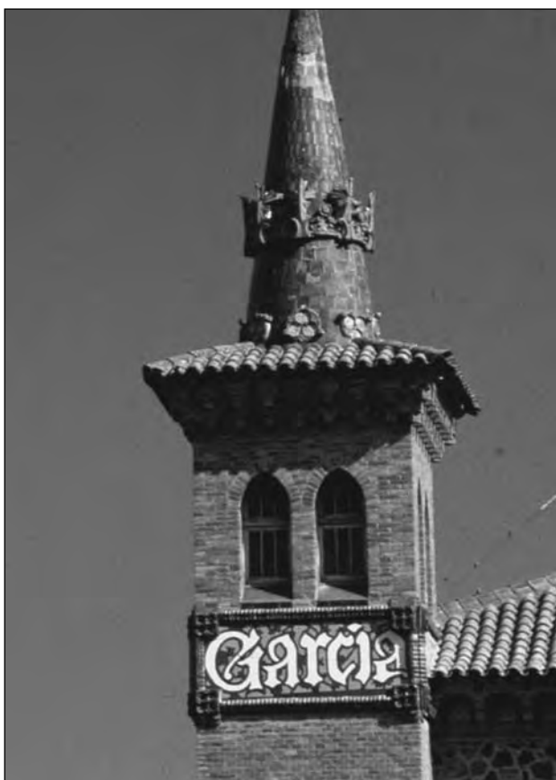
Detall del rètol de Granja Garcia. Antoni M. Gallissà, Cervelló.