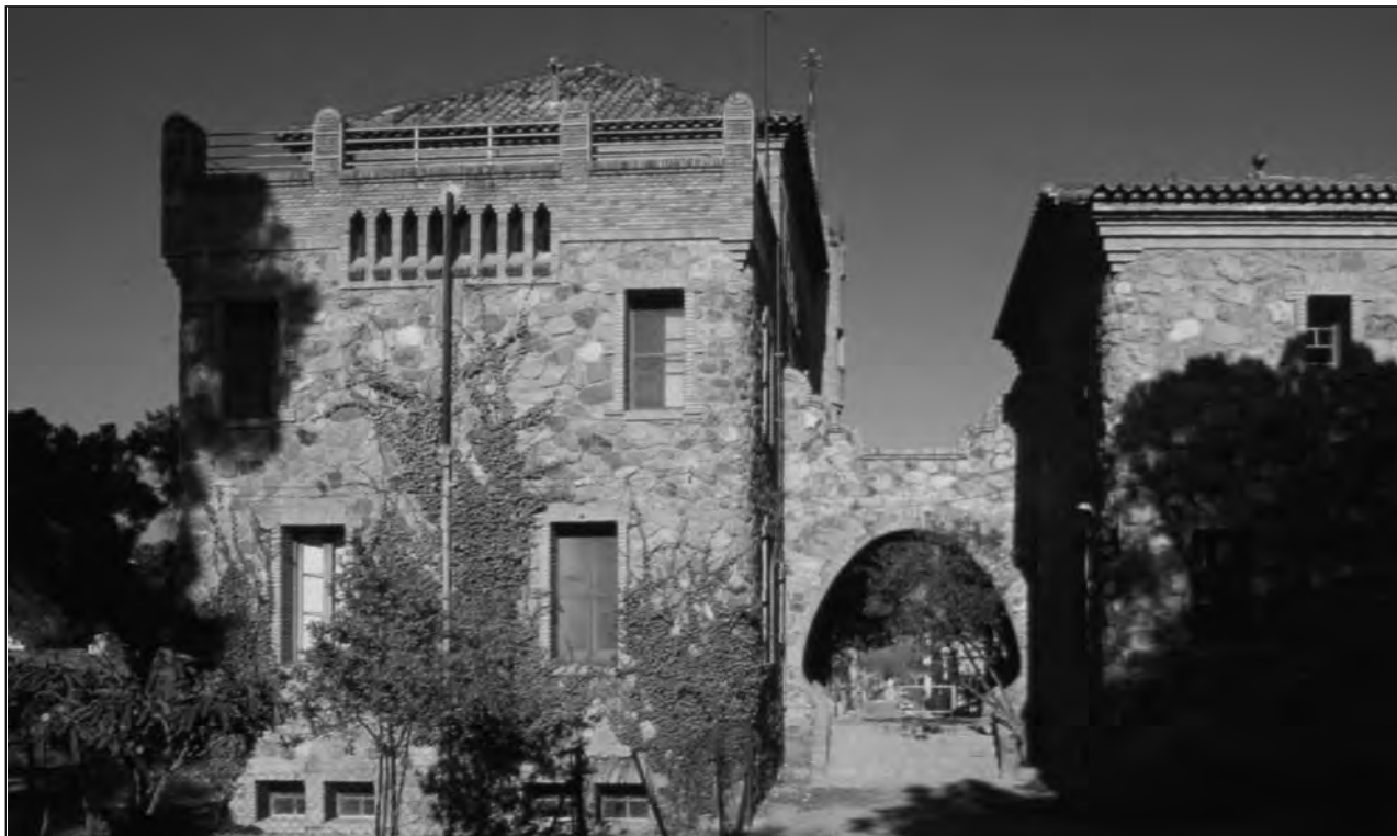
Escola i Casa del Mestre. Francesc Berenguer i Mestre, Colònia Güell (Santa Coloma de Cervelló).