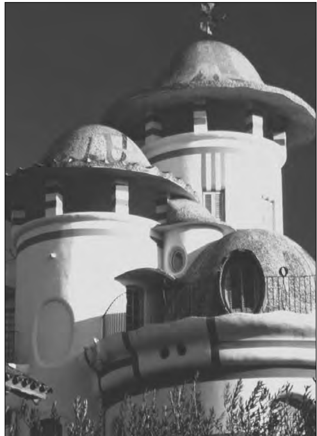
Torre de la Creu. Josep M. Jujol, Sant Joan Despí.

Avui aquests dos edificis són els més emblemàtics de la població, tot i que n'hi ha molts d'altres de nova construcció o en els quals Jujol va intervenir fent-hi alguna reforma. Alguns d'aquests edificis són, per exemple, la Torre Serra Xaus —que combina cossos quadrangulars disposats en rotació—, la seva pròpia casa o Cal Passani —una torre dissenyada a partir de la intersecció de cossos quadrangulars—, la torre Rovira —que destaca pels seus esgrafiats— i l'església —amb púlpits, sagrari, confessional i altars—, i constitueixen una ruta dedicada a Jujol que es duu a terme cada