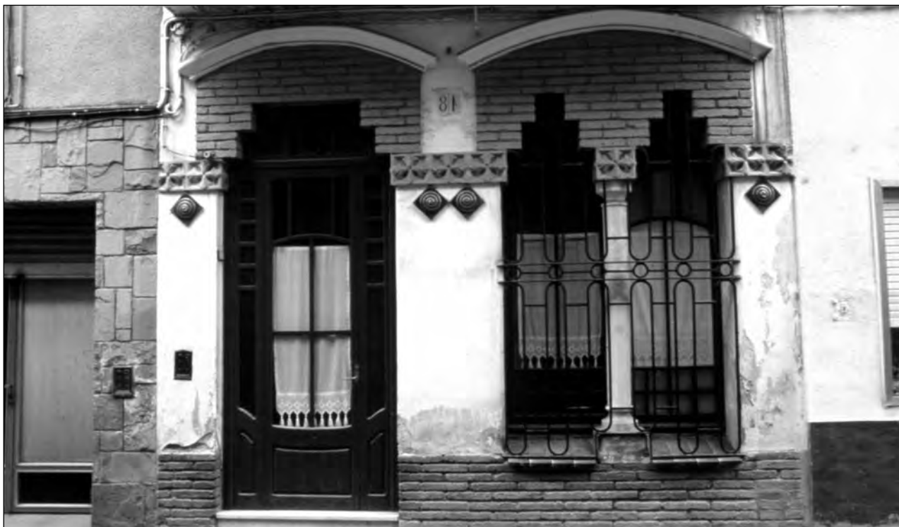
Filigrana de maó i detalls decoratius en ceràmica, exemple del modernisme popular.