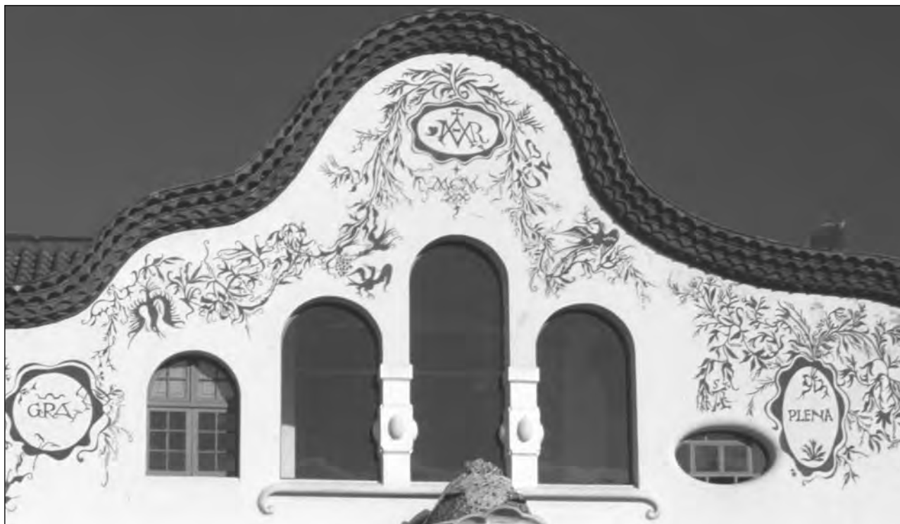
Detall de la galeria de solana i dels esgrafiats de Can Negre. Josep M. Jujol, Sant Joan Despí. Fot. Francesc Muntada