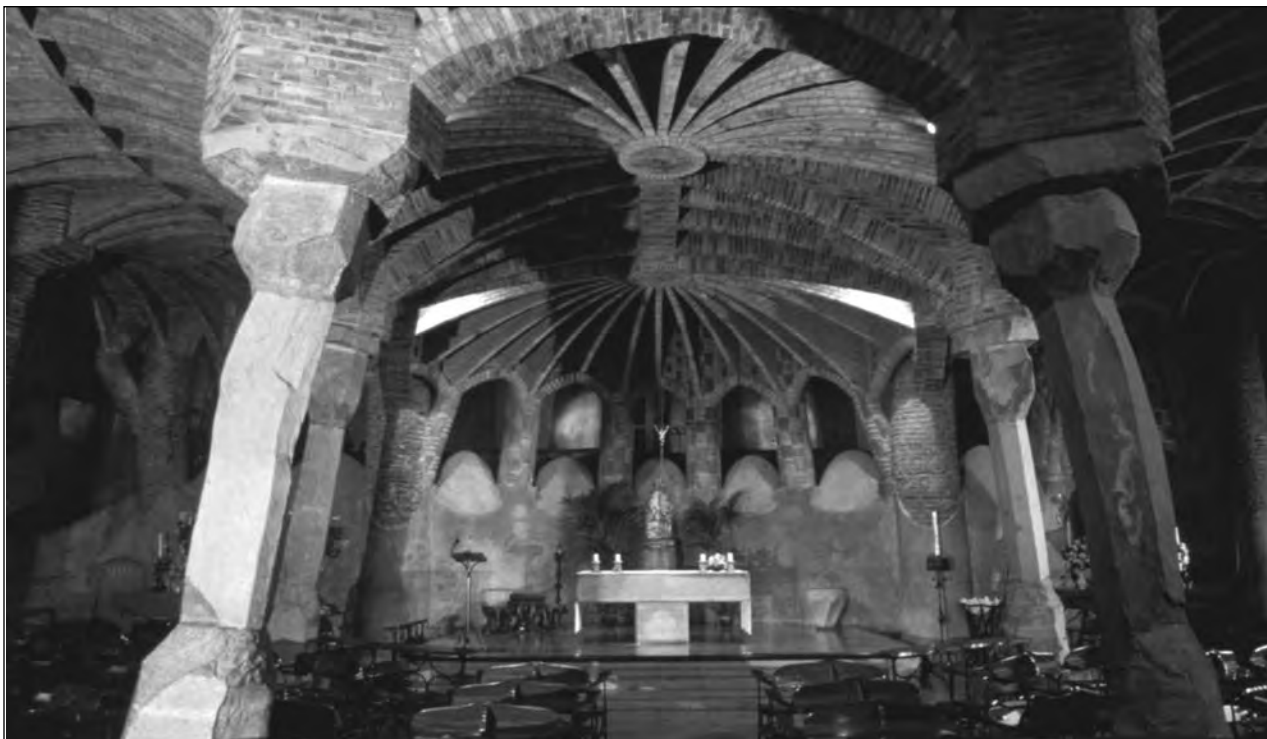
Interior de la cripta. Antoni Gaudí, Colònia Güell (Santa Coloma de Cervelló).