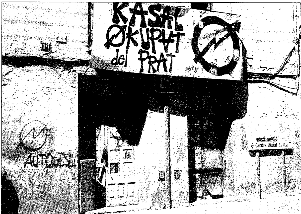
El moviment OKUPA, un dels pocs moviments socials que ha mantingut encès durant els darrers anys el llum de la mobilització en defensa de reivindicacions de resistència. A la fotografia, una casa okupada al Prat.

les desigualtats centre-perifèria han derivat vers les desigualtats nord-sud , del marc internacional s'ha passat a un marc global i els països subdesenvolupats o del Tercer Món ara són països en vies de desenvolupament . Fins i tot, en poc menys de quinze anys de diferència, les ONG han perdut el valor afegit que tenien, ja que algunes han afegit la D de desenvolupament, o bé se'ls qüestiona seriosament la vigència de la N . D'igual manera, les cases okupes són CSO 3 per adequació pràctica, els ecologistes són verds per raons cromàtiques i les associacions de gais i lesbianes han obtingut el reconeixement de moviment, col·lectiu o grup de pressió , tant en l'esfera mediàtica com en la política.