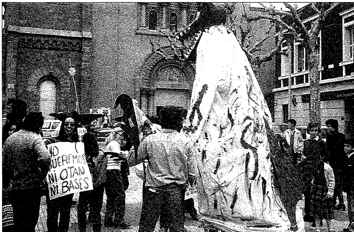
Els moviments pacifistes han mantingut activa la seva reivindicació contra la guerra i contra la intervenció americana en diferents conflictes. A la fotografia, una manifestació contra l'OTAN.

vida política continuaria imposant-se la lògica electoral. Els partits, tot i patir crisis internes, es consolidaren, i els mitjans de comunicació jugarien un paper encara més cabdal a l'hora de canalitzar el discurs polític. D'altra banda, però, trobem que la societat civil experimentà un procés de maduració a l'hora d'intervenir en la vida política. És un període de consolidació dels plantejaments sorgits en la dècada anterior i de generació de noves cultures polítiques. D'aquesta manera es faran visibles (a tall d'exemple) organitzacions independentistes, llibertàries, d'extrema esquerra i d'extrema dreta, totes elles presents a la comarca tot i que sovint restringides a un àmbit local. Moltes d'aquestes organitzacions estaran formades bàsicament per joves, fet que desmentirà el tòpic que els joves no s'interessen per la política. S'estendran les mal anomenades tribus urbanes i s'ampliarà el ventall de moviments socials. Un tret característic d'aquest període és que els partits polítics tindran la seriosa necessitat de connectar amb les sensibilitats ciutadanes, que a grans trets s'expressaran de dues maneres: 1) a través d'espais reivindicatius, 2) a través de grans mobilitzacions puntuals.