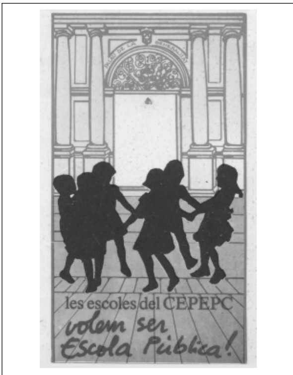
Una de les enganxines utilitzades pel moviment d'ensenyants i pares del CEPEPC per l'escola pública

Acceptar aquestes condicions va suposar un gran sa-