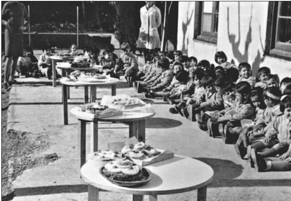
Celebració de la Pasqua a l'escola Mestral de Sant Feliu de Llobregat, l'any 1970.

Catalana, que agrupa les escoles de l'antic GAEC i de la Federació de Cooperatives d'Ensenyament de Catalunya.