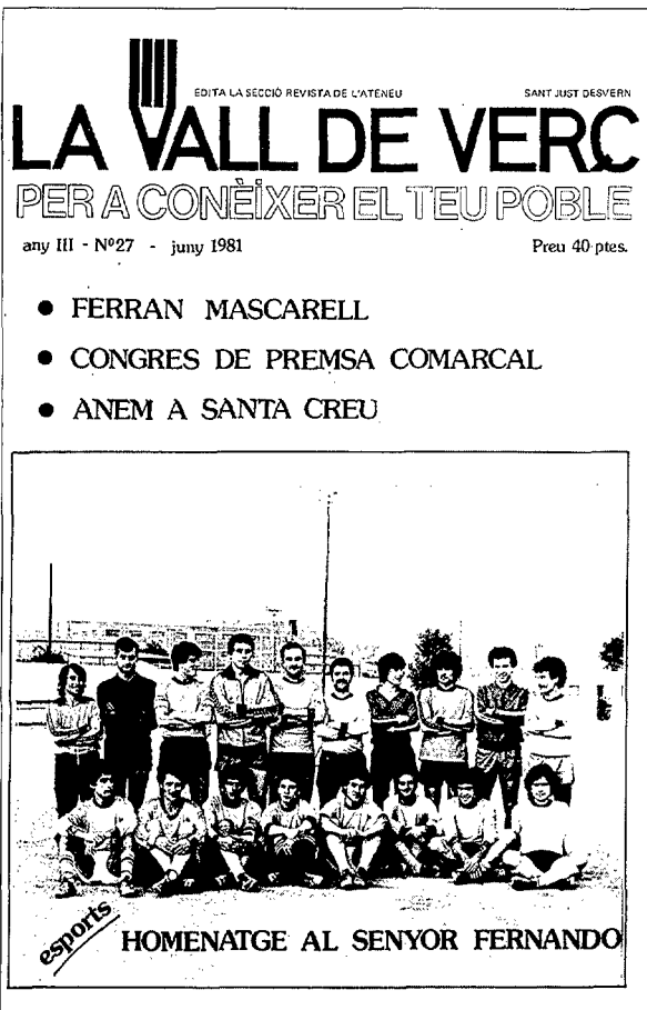
La Vall de Verç, núm. 27, juny 1981