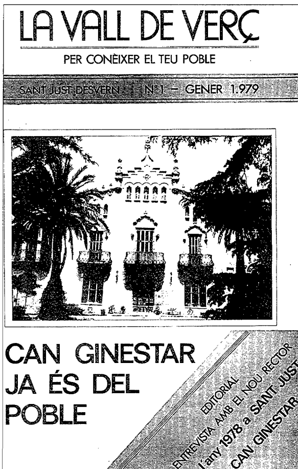
La Vall de Verç, núm. 1, gener 1979

L'editorial del número 1 de La Vall de Verç deia: "Coincidint amb el començament d'any, tornem a engegar per tercera vegada la revista de l'Ateneu,