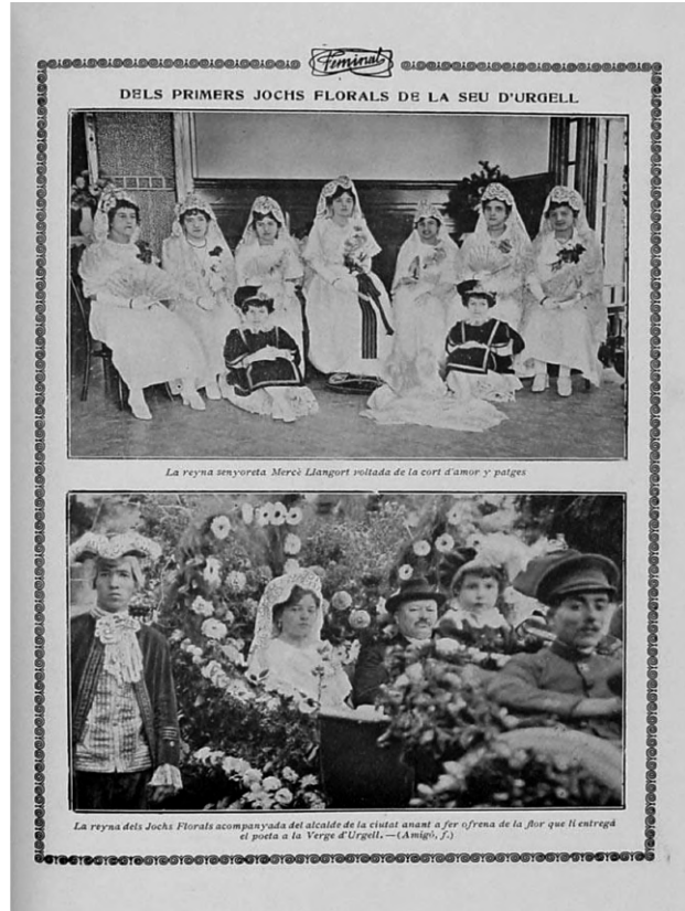
Figura 3: Jocs Florals de la Seu d'Urgell l'any 1917.

Segon: UNA ASSOCIACIÓ DE CAIRE POLÍTIC. L'any 1912 el centre carlí de Les Borges Blanques organitzà, per al mes de maig, una vetllada política, literària i musical d'arrel profundament tradicionalista. Dins dels actes religiosos i cívics programaren els primers "Juegos Florales Jaimistas". La seva pretensió no era purament literària, sinó de propaganda dels seus ideals polítics. I això, òbviament, va fer minvar la qualitat de les obres presentades i la seva projecció