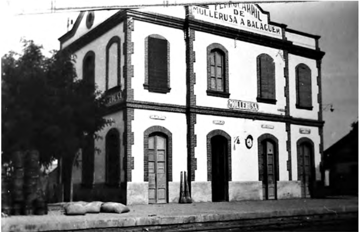
Figura 7: Estació de Ferrocarril de la Sucrea, any 1920.

La industrialització creixent, sumada als serveis creats anteriorment, constituïren les bases d'aquesta nova Mollerussa que s'anava transformant. A conseqüència de l'augment progressiu de la població i dels negocis va aparèixer una petita burgesia i un determinant ambient cultural que va fer possible que a partir de 1900 es comencés a editar premsa local, que l'any 1905 es fundés la Societat l'Amistat, i que el 1923 se celebressin els primers Jocs Florals de la seva història.