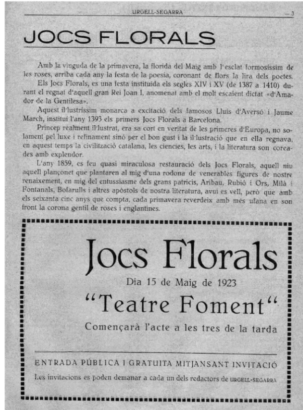
Figura 9: Anunci dels Jocs Florals de Mollerussa.