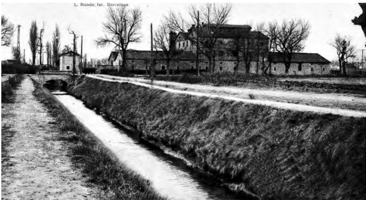
Figura 6: La Casa Canal de Mollerussa. Dècada de 1920.

La construcció del Canal (1861) i la instal·lació de les oficines de la Casa Canal van eixamplar l'àrea d'influència de Mollerussa; el Sindicat General de Regants també s'establí a la població, i en endavant, no tan sols qualsevol problema relacionat amb el reg hi havia de ser resolt, sinó que també s'hi celebraven les subhastes dels novens, és a dir, de la novena part dels fruits que la Companyia del Canal tenia dret a rebre a canvi del servei d'aigua. També hi contribuïren l'establiment d'una estació de ferrocarril del nord (1854), la creació de la Fira de Sant Josep, la instauració del mercat setmanal dels dimecres l'any 1872, la instal·lació de la Forestal d'Urgell (1890), la creació del ferrocarril de via estreta, "el carrilet", entre Mollerussa i Balaguer l'any 1901 i la construcció del canal auxiliar l'any 1929.