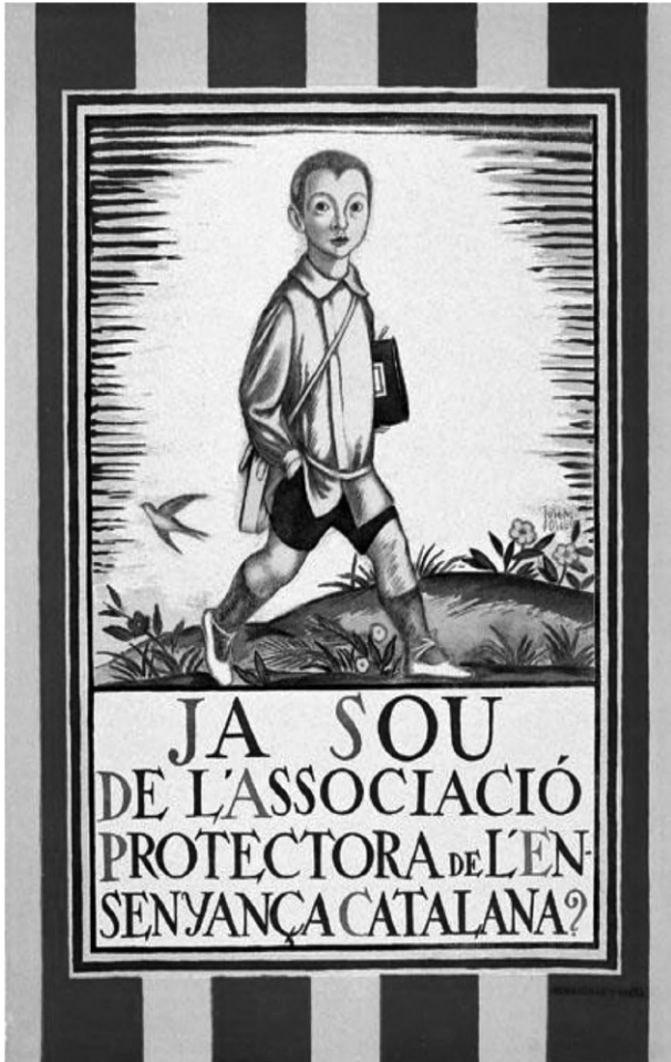
Figura 8: Cartell Associació Protectora de l'Ensenyança Catalana.

publica el cartell 3 dels Jocs Florals de Mollerussa per al mes de maig, fent-los coincidir amb el primer dia de la seva Festa Major. Ofereix els tradicionals premis ordinaris: la Flor Natural, l'Englantina i la Viola. El premi, anomenat d'honor i de cortesia, és ofert per la propia revista. El guanyador, seguint els costums establerts en les festes del Gai Saber, triarà la dama, la qual, un cop proclamada Reina de la Festa, lliurarà els altres premis. L'Englantina, tal com s'havia acordat en el ple municipal del dia 17 de gener, anirà a compte de l'Ajuntament de Mollerussa. I la Viola, justificada per la temàtica religiosa, serà assumit per mossèn Joan Pintó Cases, arxiprest i rector de la parròquia mollerussenca. La junta directiva de la sala d'espectacles de la Societat "Foment d'Urgell", lloc on es farà la festa literària, notifica als seus organitzadors, el dia 8 d'abril, que "la