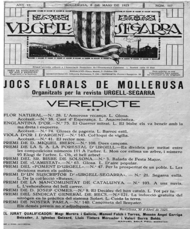
Figura 10: Veredictes a la revista Urgell-Segarra .

El veredictes del jurat es publica a les pàgines de la revista Urgell-Segarra el dia 6 de maig i als diaris lleidatans El Diario de Lérida 4 i El Ideal 5 , els dies 9 i 11 de maig respectivament. En la memòria del secretari, s'hi deixa constància de tres fets significatius: que el nombre de composicions rebudes és importantíssim si es té en compte les circumstàncies de temps que han rodejat els preparatius de la festa, que Mollerussa pot estar satisfeta del resultat de la seva crida als