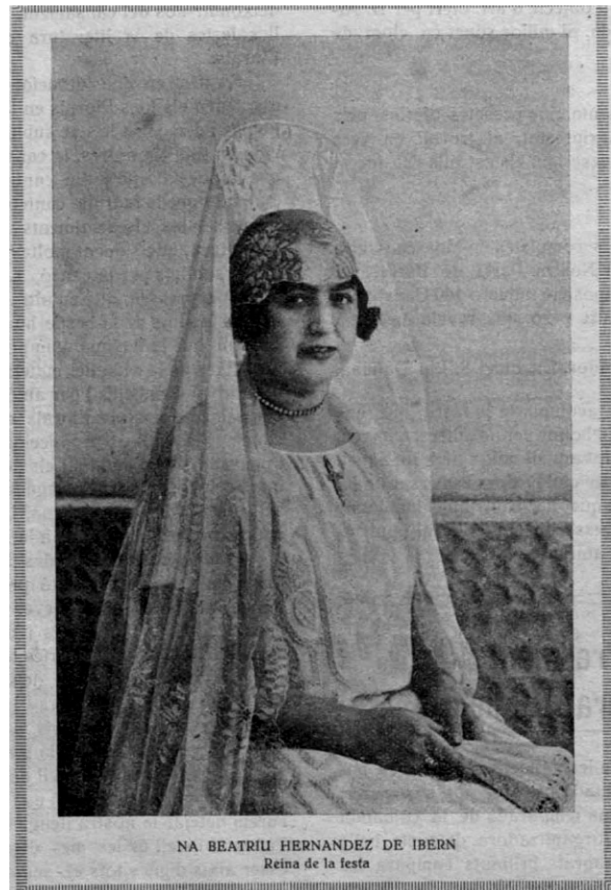
Figura 11: La reina de la festa.