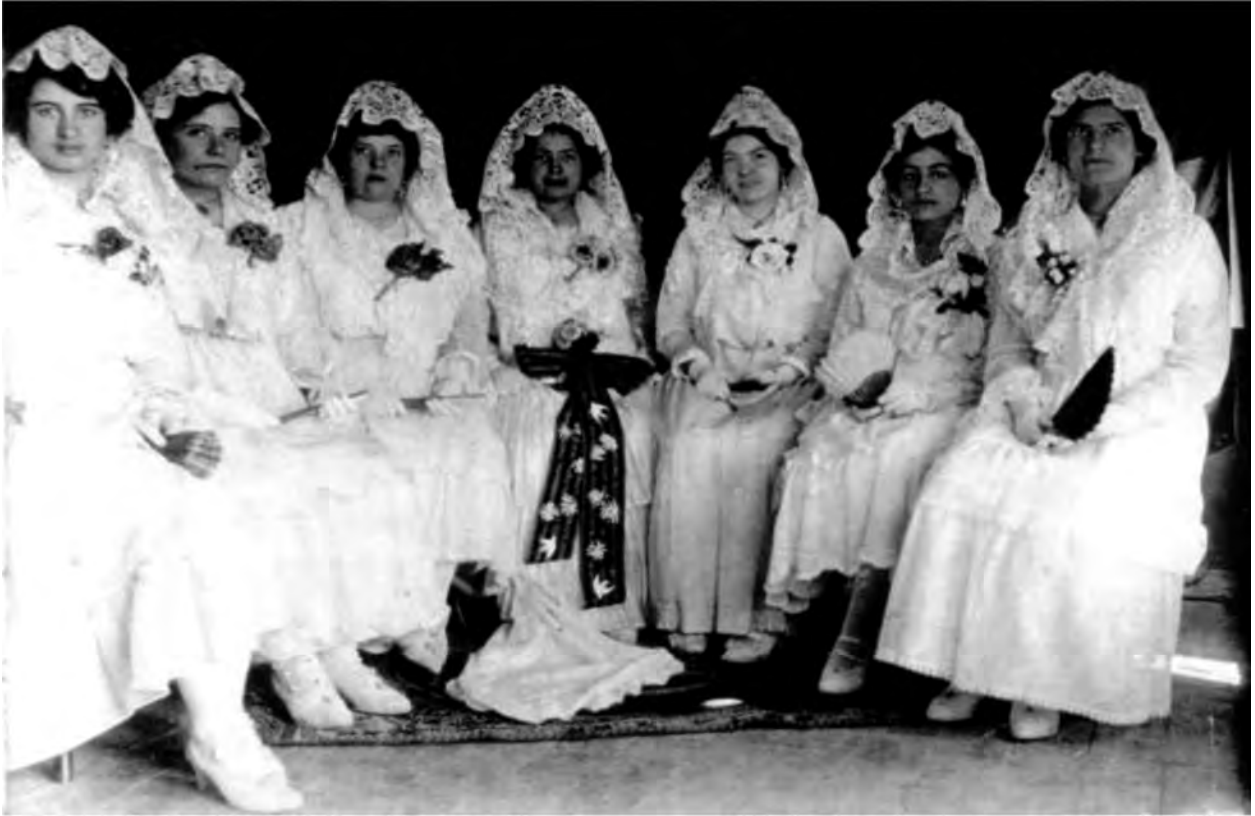
Figura 4: Jocs Florals de Torà l'any 1915.